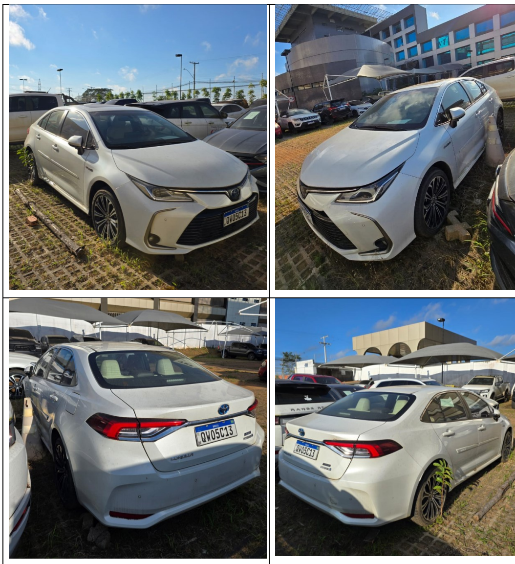
Figura 10 - Imagens do Toyota Corolla, placa: QW05C13, examinado no pátio descoberto da SR/PF/AC, em 02/07/2025.

Durante a vistoria, ao comparar imagens no Laudo n° 144/2023-SETEC/SR/PF/AC, foi constatada depreciação na parte externa do veículo, especificamente na lataria, que apresenta sinais de oxidação (ferrugem), conforme evidenciado na Figura 11.