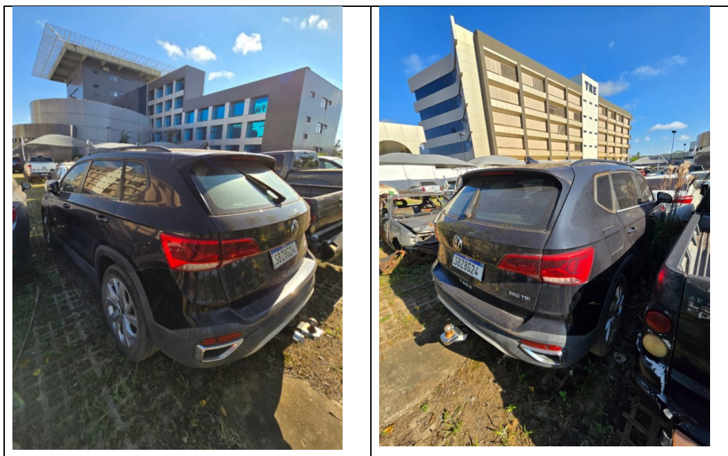
Figura 15 - Imagens do Volkswagen TAOS, placa: SBZ8G24, examinado no pátio descoberto da SR/PF/AC, em 02/07/2025.

Durante a vistoria foi verificada depreciação no veículo iniciando nas pestanas externas (figura 16).