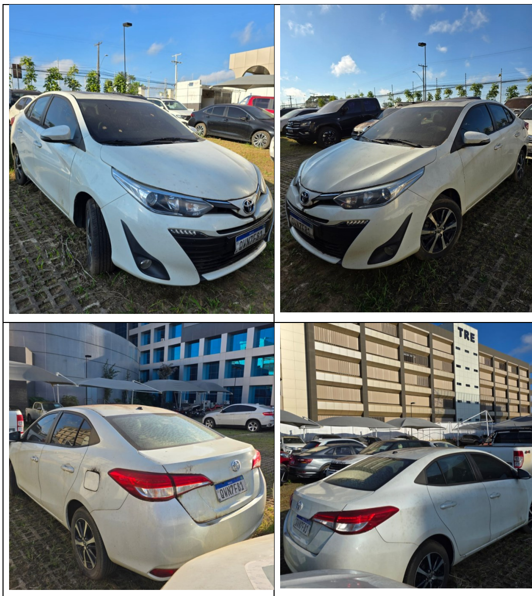
Figura 8 - Imagens do Toyota Yaris, placa: QWN7F81, examinado no pátio descoberto da SR/PF/AC, em 02/07/2025.

Durante a vistoria, constatou-se depreciação na parte externa do veículo (lataria), com presença de sinais de oxidação (ferrugem), conforme verificado por meio da comparação com as imagens do Laudo n° 141/2023-SETEC/SR/PF/AC e evidenciado na Figura 9.