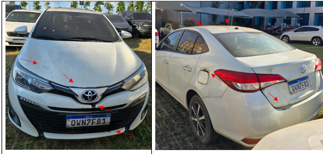
Figura 9 - Imagens do Toyota Yaris, placa: QWN7F81, examinado no pátio descoberto da SR/PF/AC, em 02/07/2025.

Setas vermelhas indicam oxidação na lataria do veículo.