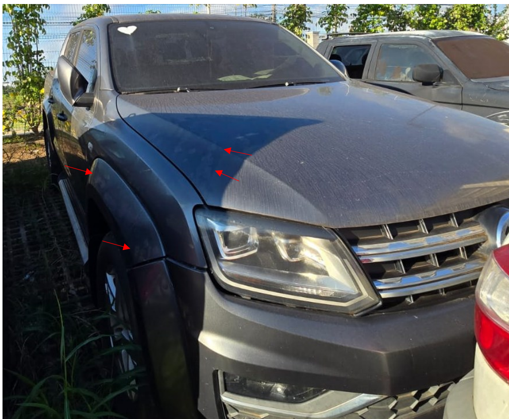
Figura 5 - Imagens do Volkswagen Amarok, placa: QLZ-1978, examinada no pátio descoberto da SR/PF/AC, em 02/07/2025.

Setas vermelhas indicam desbotamento na pintura da lataria do veículo.