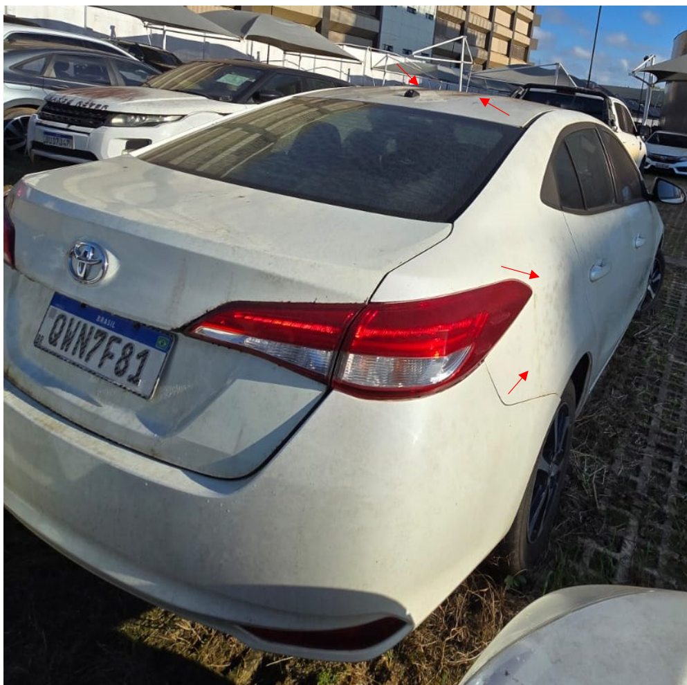
Figura 11 - Imagens do Toyota Corolla, placa: QWO5C13, examinado no pátio descoberto da SR/PF/AC, em 02/07/2025. Setas vermelhas indicam oxidação na lataria do veículo.

Consigna-se que os exames não abrangeram exames físicos no veículo e nas suas partes mecânicas tais como motor, câmbio e sistemas e módulos eletrônicos. Após a observação dos elementos requisitados, registra-se na Tabela 7 o valor atual de mercado do veículo e a estimativa de depreciação nos cenários elencados.