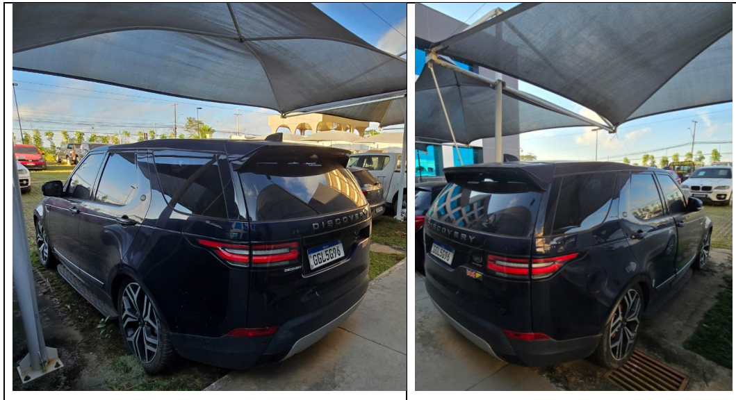
Figura 6 - Imagens da Land Rover Discovery, placa: GGL5G96, examinada no pátio da SR/PF/AC, em 02/07/2025.

Durante a vistoria observou-se que a parte externa do veículo (lataria) apresenta sinais de sujeira, conforme evidenciado na Figura 6.