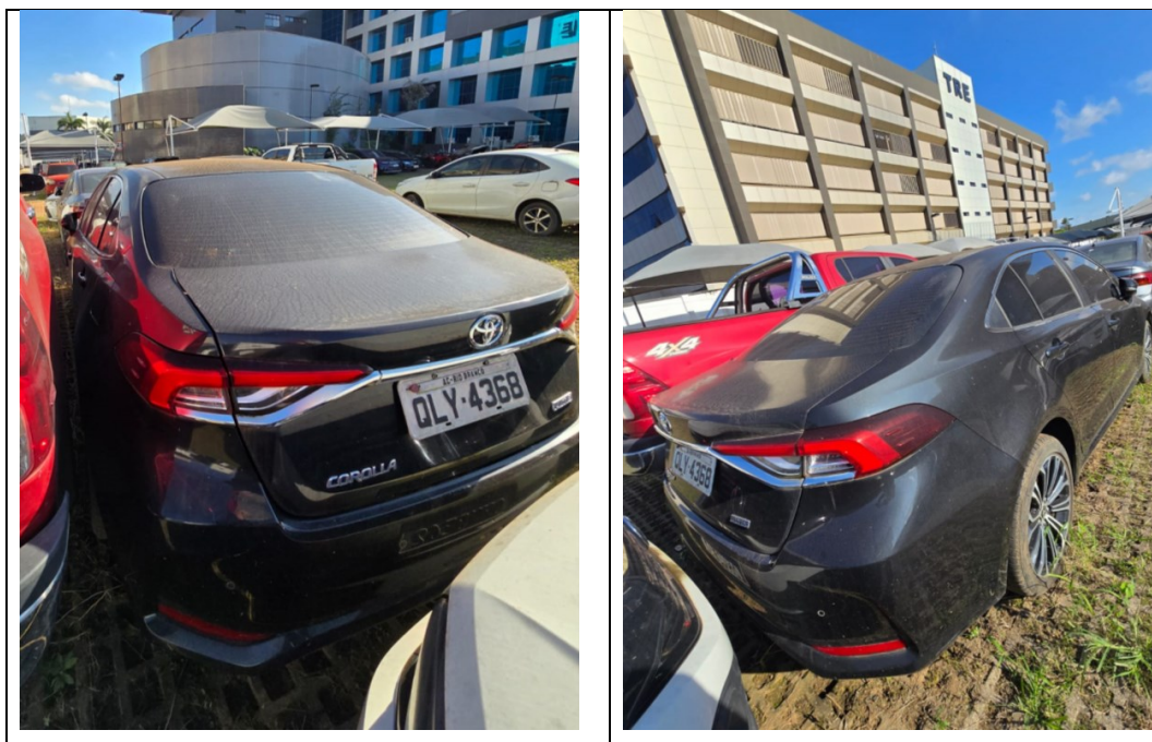
Figura 21 - Imagens do Toyota Corolla, placa: QLY4368, examinado no pátio descoberto da SR/PF/AC, em 02/07/2025.

Durante a vistoria, constatou-se que a parte externa do veículo apresenta acúmulo de poeira e sujidades, conforme ilustrado na Figura 21.