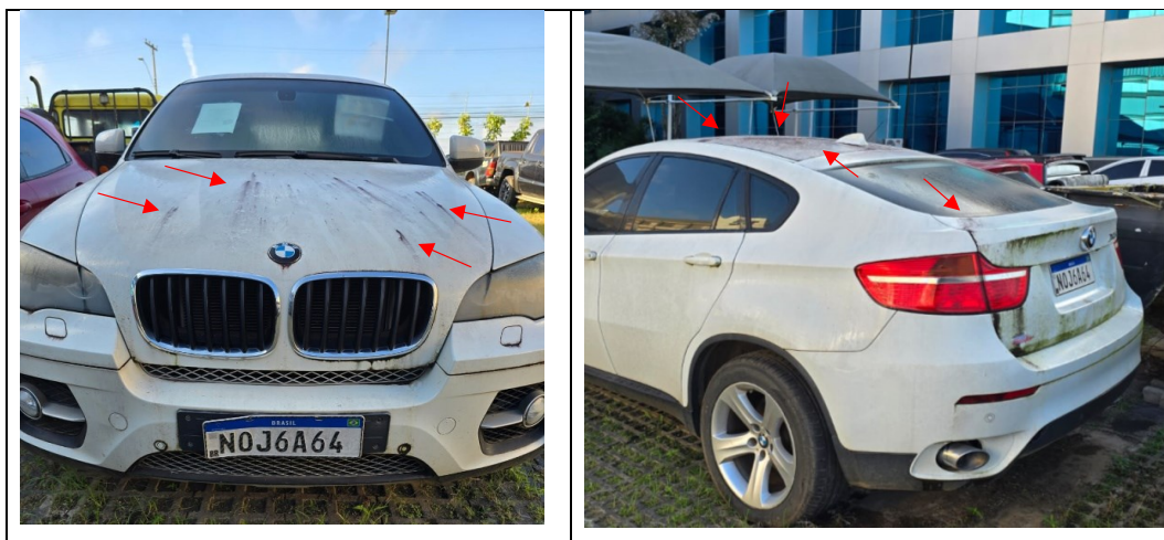
Figura 3 - Imagens da BMW X6 DRIVE, placa: NOJ6A64, examinada no pátio descoberto da SR/PF/AC, em 02/07/2025. Setas vermelhas indicam oxidação na lataria do veículo.

Consigna-se que os exames não abrangeram exames físicos no veículo e nas suas partes mecânicas tais como motor, câmbio e sistemas e módulos eletrônicos. Após a observação dos elementos requisitados, registra-se na Tabela 2 o valor atual de mercado do veículo e a estimativa de depreciação nos cenários elencados.