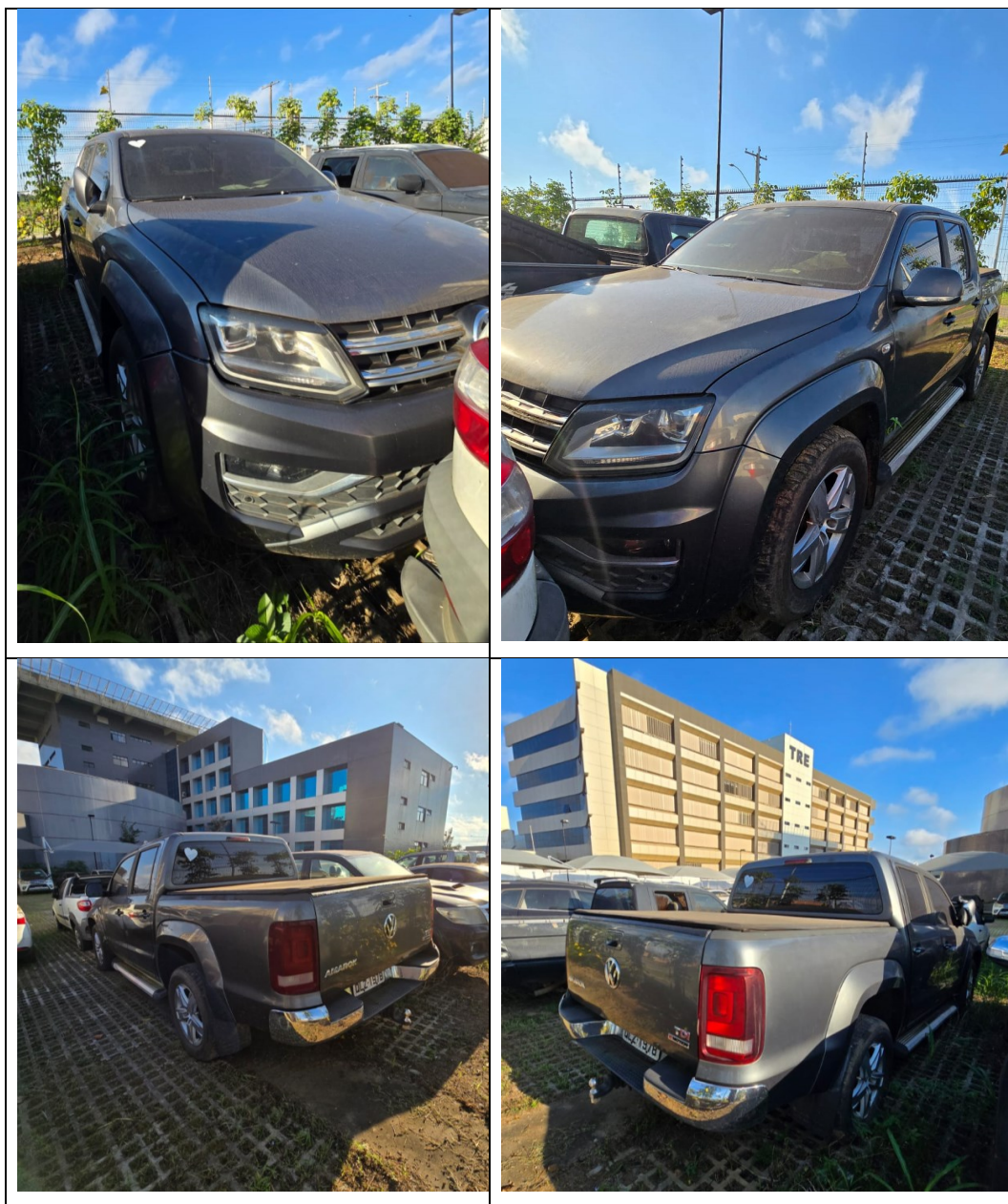
Figura 4 - Imagens do Volkswagen Amarok, placa: QLZ-1978, examinada no pátio descoberto da SR/PF/AC, em 02/07/2025.

Durante a vistoria pode ser verificada depreciação ao comparar imagens no Laudo nº 004/2022-SETEC/SR/PF/AC, a lataria do veículo apresenta sinais de descoloração e opacidade na pintura, características comumente associadas à ação contínua dos raios solares (figura 5).