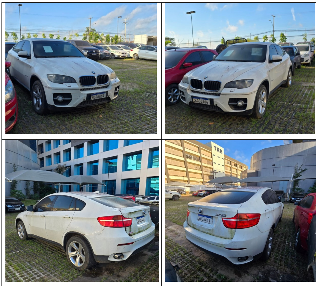
Figura 2 - Imagens da BMW X6 DRIVE, placa: NOJ6A64, examinada no pátio descoberto da SR/PF/AC, em 02/07/2025.

O veículo examinado encontrava-se alocado no pátio descoberto da Superintendência Regional de Polícia Federal no Acre, na cidade de Rio Branco/AC, conforme pode ser aferido na Figura 2.