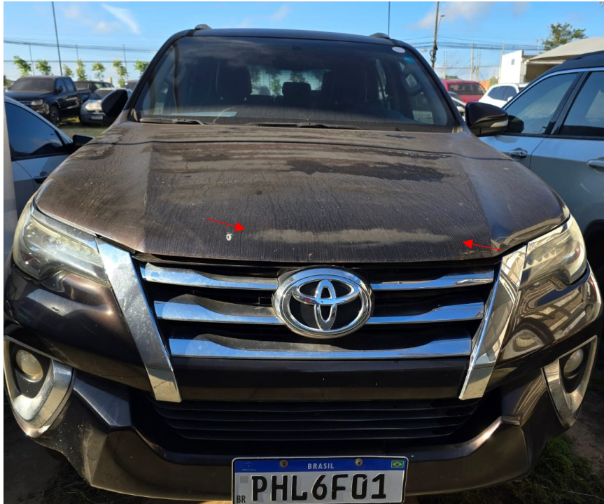
Figura 20 - Imagens da Toyota Hilux SW4, placa: PHL6F01, examinada no pátio descoberto da SR/PF/AC, em 02/07/2025. Setas vermelhas indicam oxidação na lataria do veículo.

Durante a vistoria pode ser verificada depreciação ao comparar imagens no Laudo nº 135/2023-SETEC/SR/PF/AC, a parte externa, lataria, do veículo apresenta sinais de oxidação, ou ferrugem (figura 20).