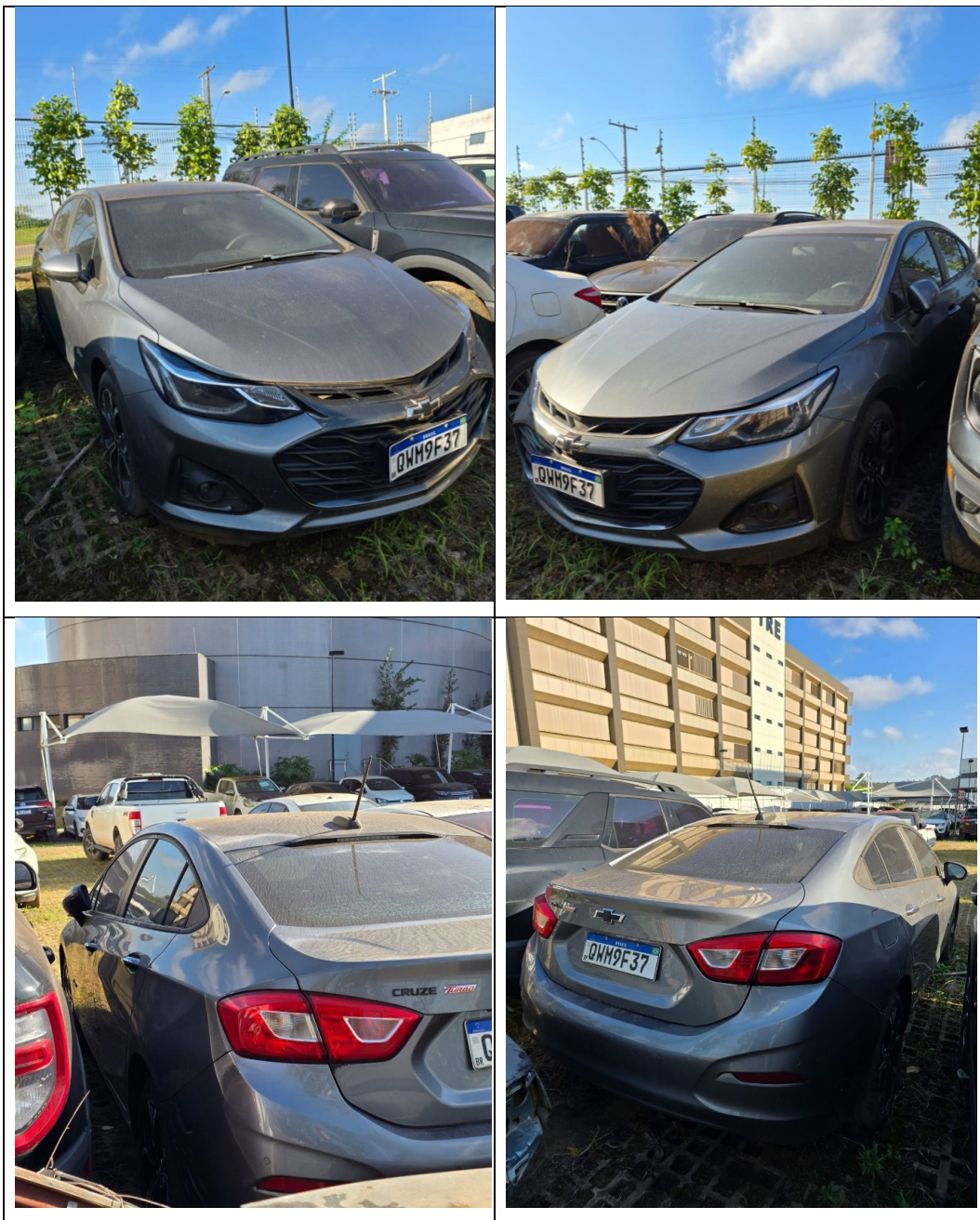
Figura 13 - Imagens do Chevrolet Cruze, placa QWM9F37, examinado no pátio descoberto da SR/PF/AC, em 02/07/2025.

O veículo periciado estava localizado no pátio descoberto da Superintendência Regional da Polícia Federal no Acre, em Rio Branco/AC, conforme evidenciado na Figura 13.