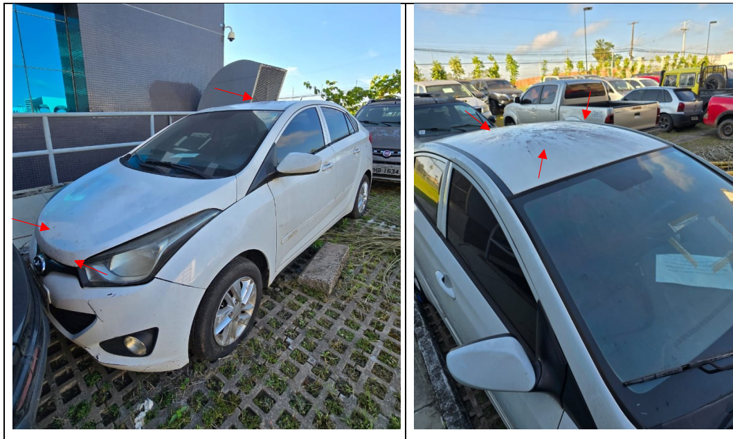
Figura 23 - Imagens do Hyundai HB20S, placa: NAD9546, examinado no pátio descoberto da SR/PF/AC, em 02/07/2025.

Durante a vistoria pode ser verificada depreciação ao comparar imagens no Laudo nº 138/2023-SETEC/SR/PF/AC. A parte externa, lataria, do veículo apresenta sinais de oxidação, ou ferrugem (figura 23).