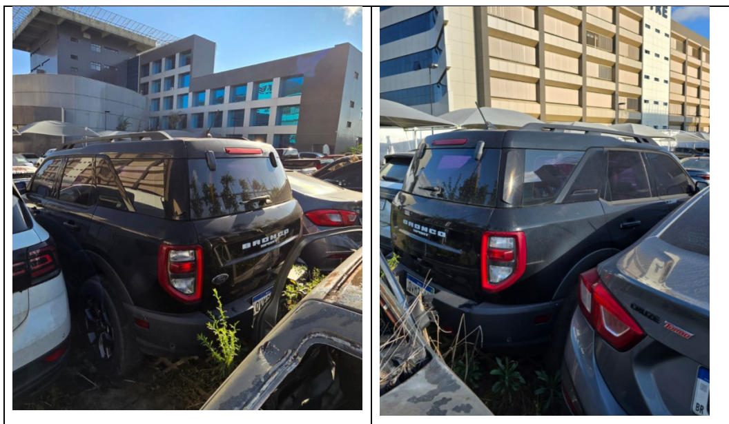
Figura 12 - Imagens do Ford Bronco, placa: QWM2J47, examinado no pátio descoberto da SR/PF/AC, em 02/07/2025.

Durante a inspeção, constatou-se desgaste na condição externa do veículo, notadamente na lataria, a qual apresenta acúmulo de sujeira, conforme registrado na Figura 12.