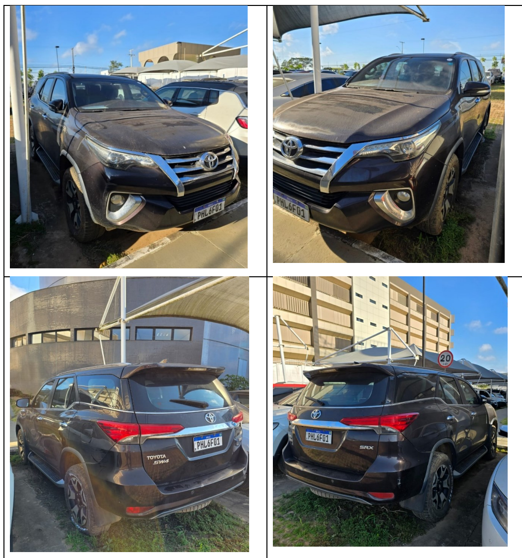
Figura 19 - Imagens da Toyota Hilux SW4, placa: PHL6F01, examinada no pátio descoberto da SR/PF/AC, em 02/07/2025.

O veículo examinado encontrava-se alocado no pátio descoberto da Superintendência Regional de Polícia Federal no Acre, na cidade de Rio Branco/AC, conforme pode ser aferido na Figura 19.