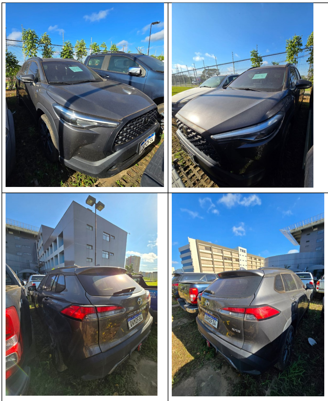
Figura 14 - Imagens do Toyota Corolla Cross, placa: QWM2F34, examinado no pátio descoberto da SR/PF/AC, em 02/07/2025.

Durante a vistoria, constatou-se que a parte externa do veículo apresentava acúmulo de poeira, conforme ilustrado na Figura 14.