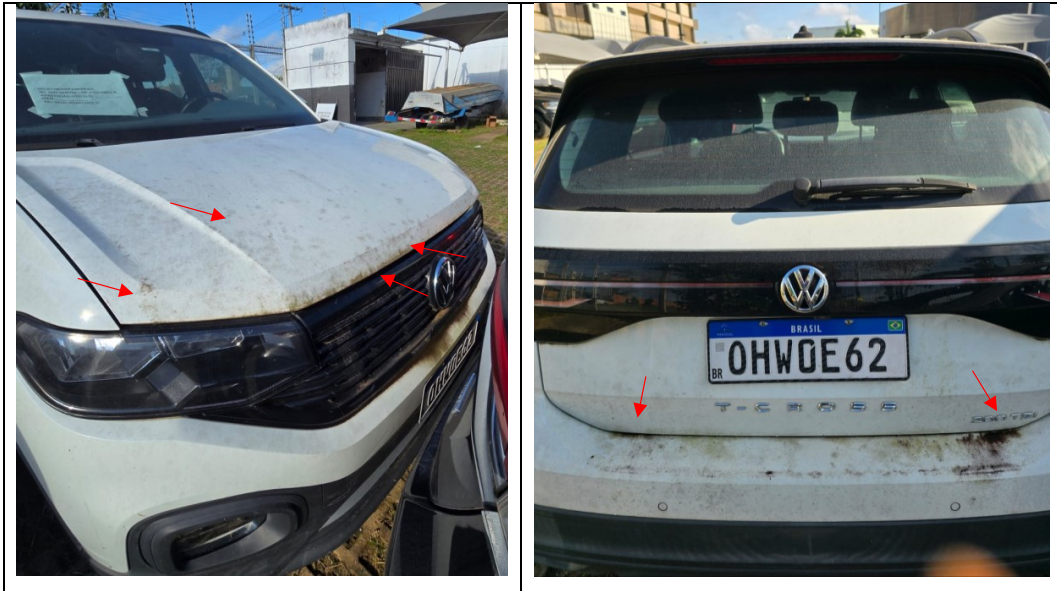
Figura 18 - Imagens do Volkswagen/T Cross, placa: OHW0E62, examinado no pátio descoberto da SR/PF/AC, em 02/07/2025. Setas vermelhas indicam oxidação na lataria do veículo.

Durante a vistoria pode ser verificada depreciação ao comparar imagens no Laudo nº 133/2023-SETEC/SR/PF/AC, a parte externa, lataria, do veículo apresenta sinais de oxidação, ou ferrugem (figura 18).