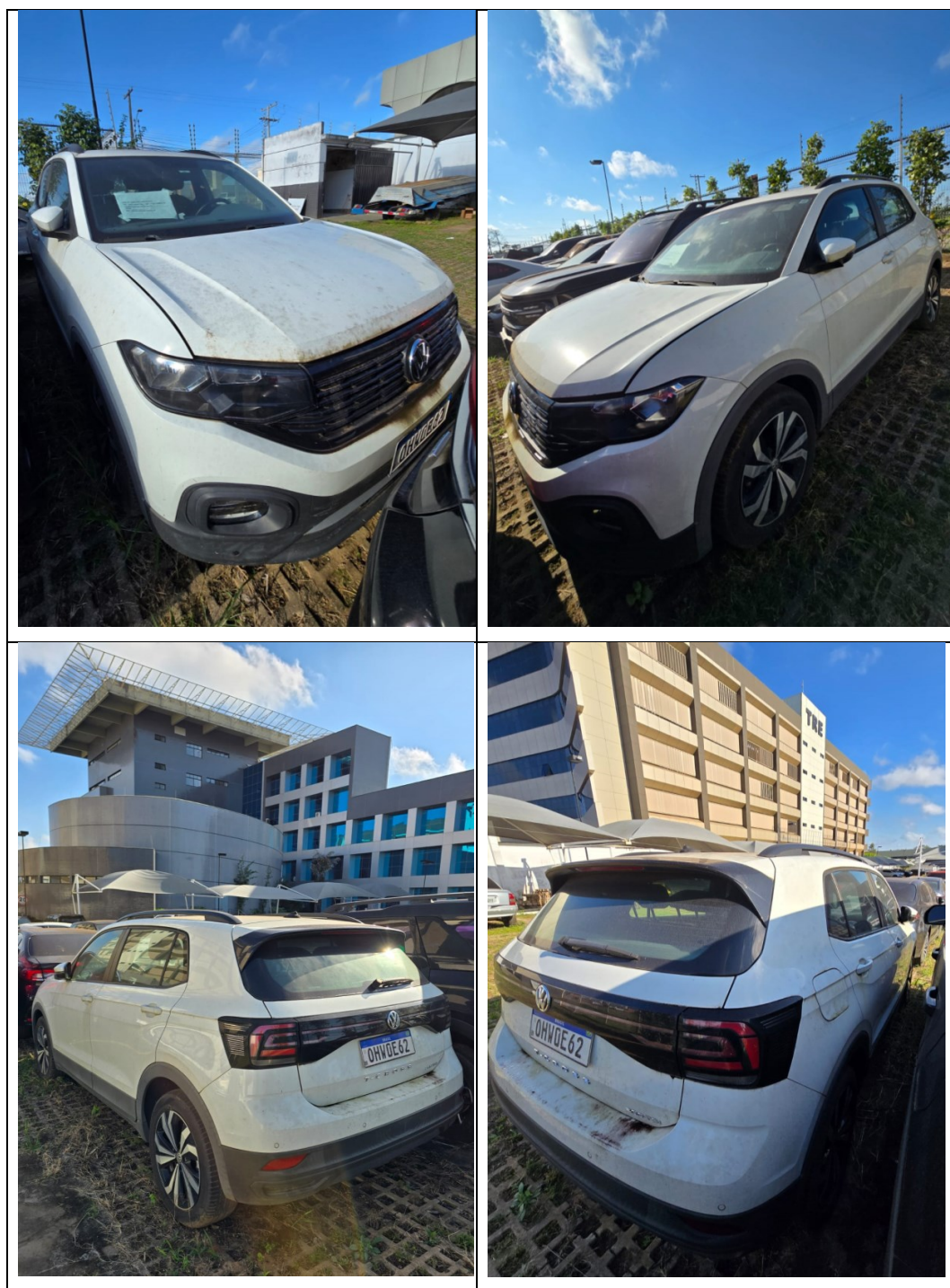
Figura 17 - Imagens do Volkswagen/T Cross, placa: OHW0E62, examinado no pátio descoberto da SR/PF/AC, em 02/07/2025.