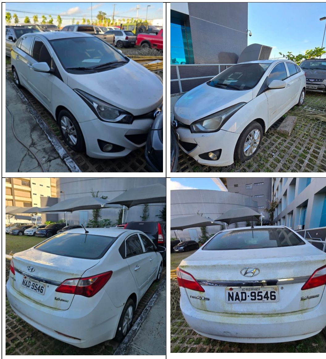
Figura 22 - Imagens do Hyundai/HB20S, placa: NAD9546, examinado no pátio descoberto da SR/PF/AC, em 02/07/2025.

O veículo examinado encontrava-se alocado no pátio descoberto da Superintendência Regional de Polícia Federal no Acre, na cidade de Rio Branco/AC, conforme pode ser aferido na Figura 22.