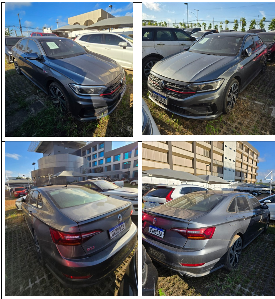
Figura 7 - Imagens do Volkswagen Jetta, placa: QWM-0D18, examinada no pátio descoberto da SR/PF/AC, em 02/07/2025.

O veículo examinado encontrava-se alocado no pátio descoberto da Superintendência Regional de Polícia Federal no Acre, na cidade de Rio Branco/AC, conforme pode ser aferido na Figura 7.