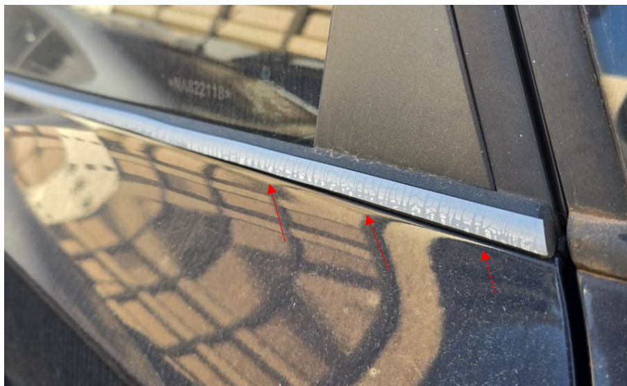
Figura 16 - Imagens do Volkswagen TAOS, placa: SBZ8G24, examinado no pátio descoberto da SR/PF/AC, em 02/07/2025.

Durante a vistoria foi verificada depreciação no veículo iniciando nas pestanas externas (figura 16).