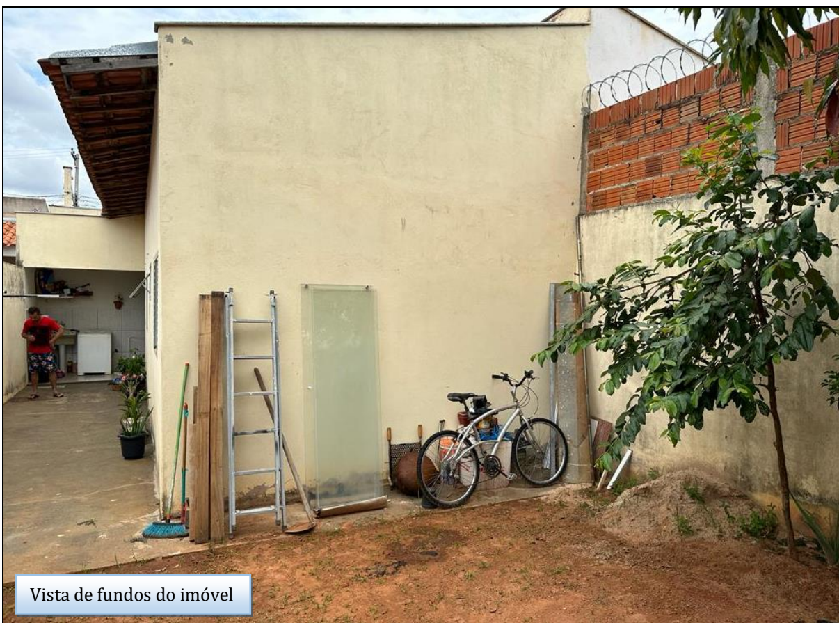
Vista de fundos do imóvel