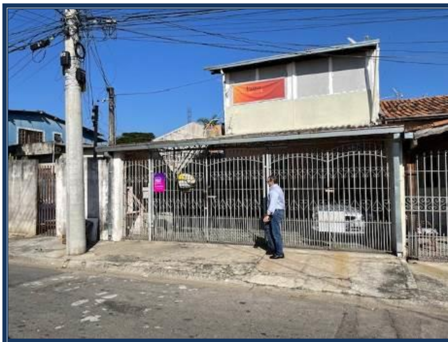
Vista da frente do imóvel em questão.