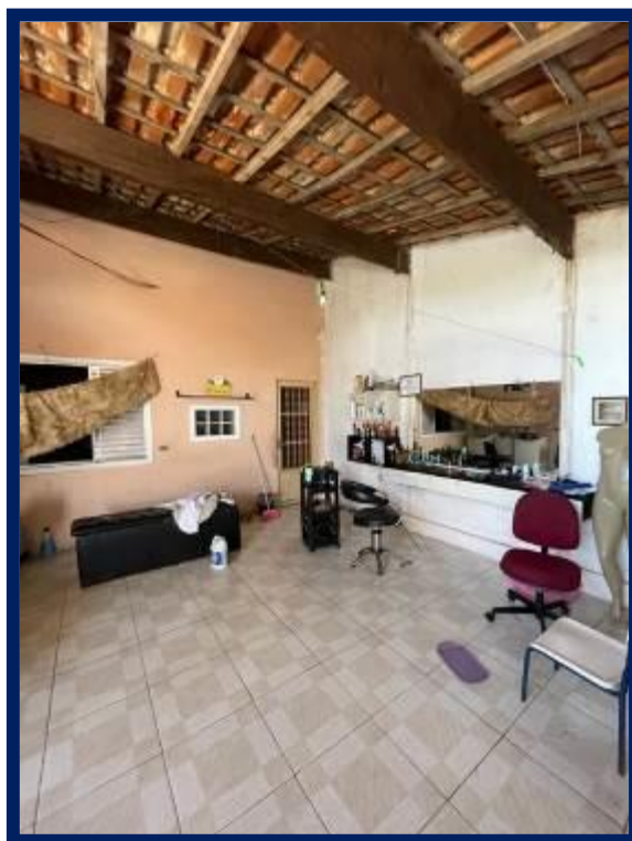
Superior – Casa 3: Salão.