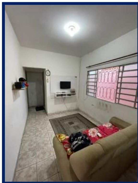
Térreo – Casa 2: Cozinha e sala.