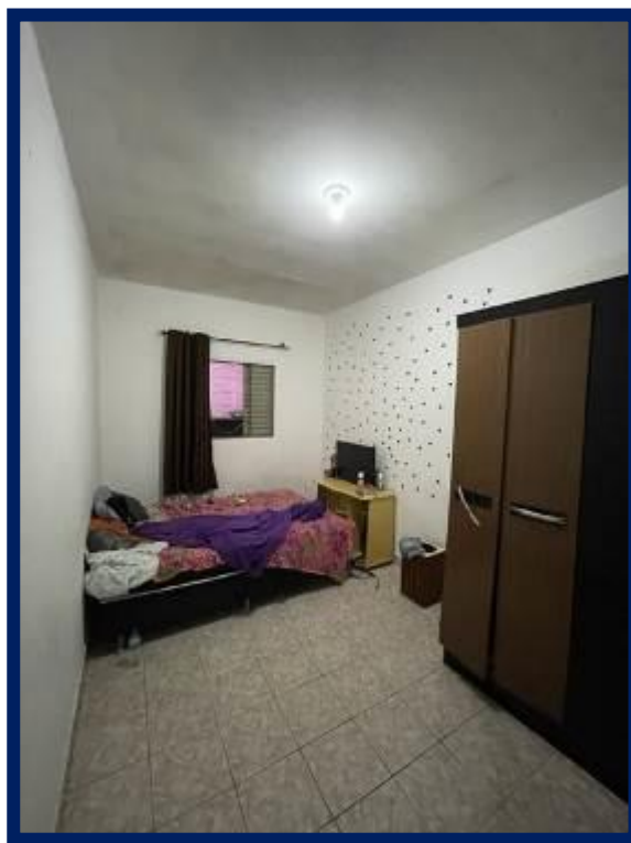
Térreo – Casa 2: Banheiro e dormitório.