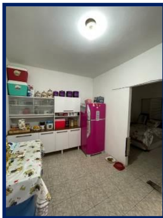
Térreo – Casa 1: Sala e cozinha.