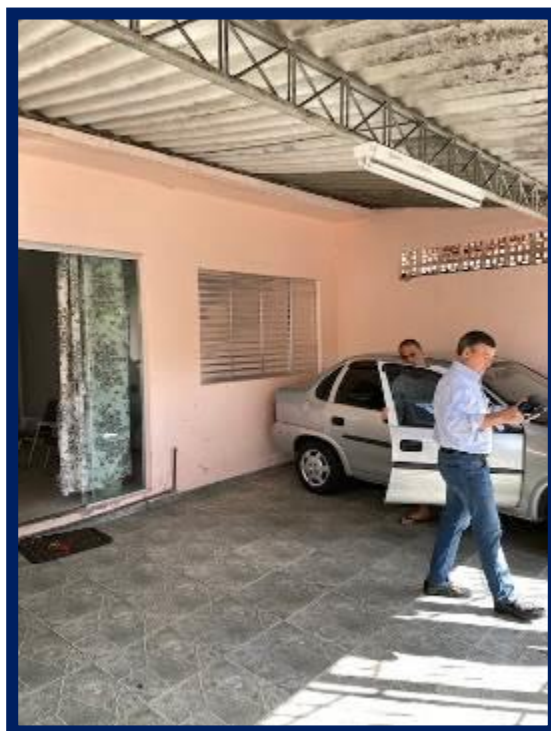
Térreo – Garagem: Cobertura.