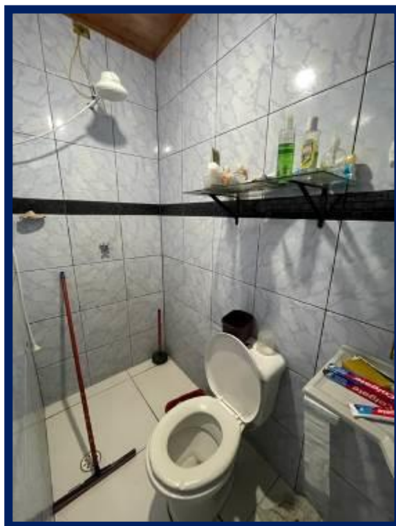
Superior – Casa 3: Sala / cozinha e banheiro.