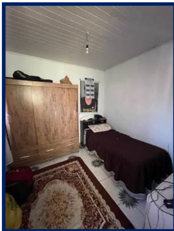
Superior – Casa 3: Dormitórios 1 e 2.