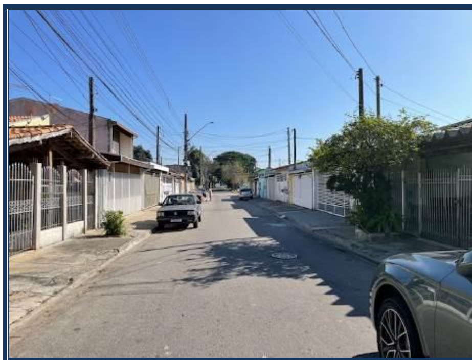
Vista da Rua Regina Alves dos Santos que lhe dá acesso.