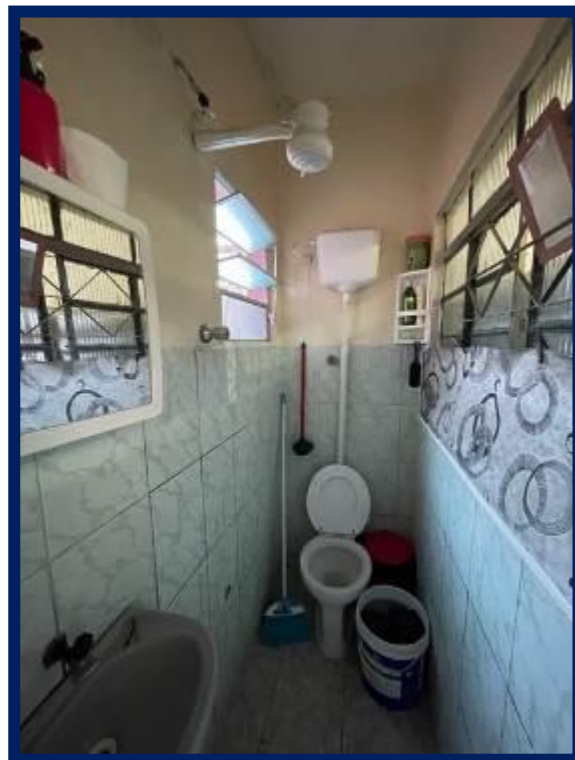
Térreo – Casa 1: Dormitório e banheiro.