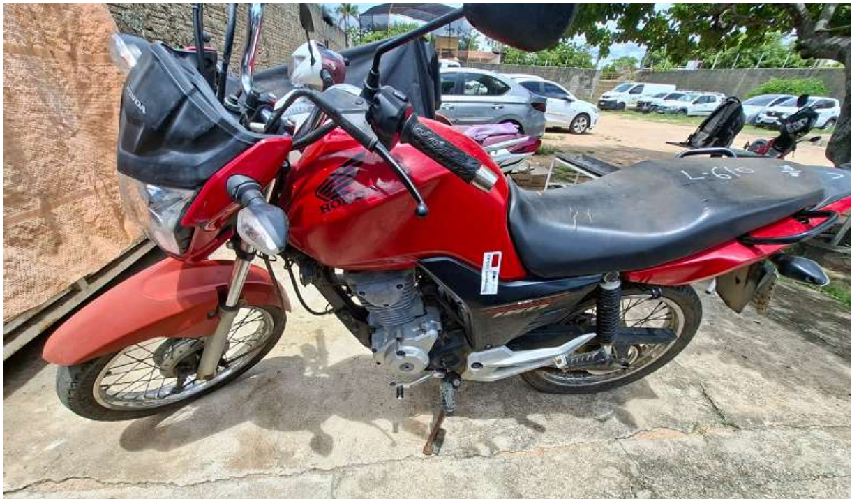
FOTO 01: Vista panorâmica do lado esquerdo do veículo, evidenciando o estado geral de conservação.