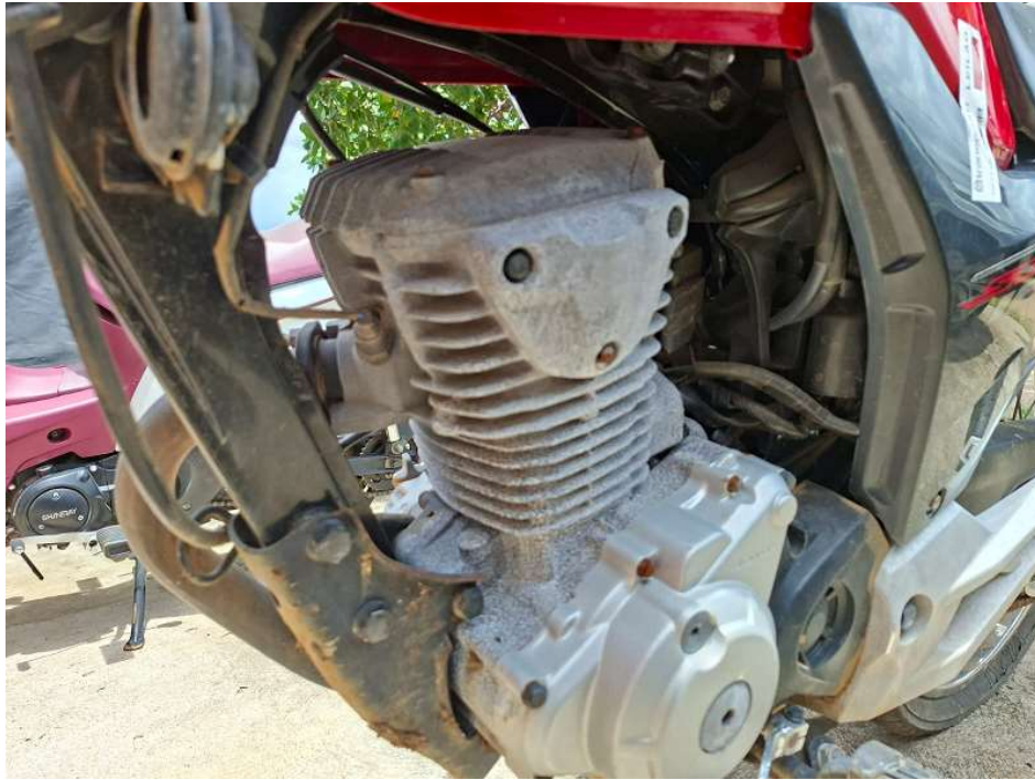
FOTO 06: Detalhe do bloco do motor e sistema de exaustão (lado esquerdo).