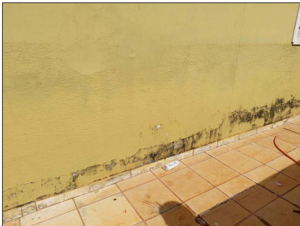
FOTO Nº 09:- Detalhe parcial da parte externa do imóvel, onde podemos observar o seu atual estado de conservação.