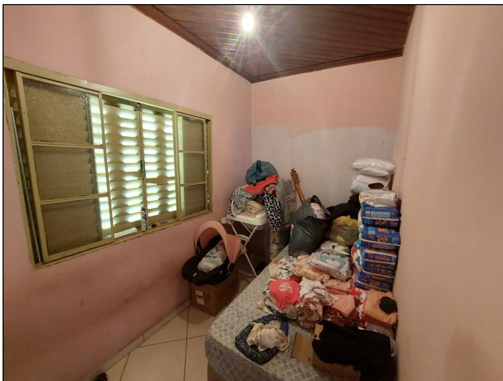
FOTO Nº 07:- Detalhe do interior do segundo dormitório existente no imóvel.