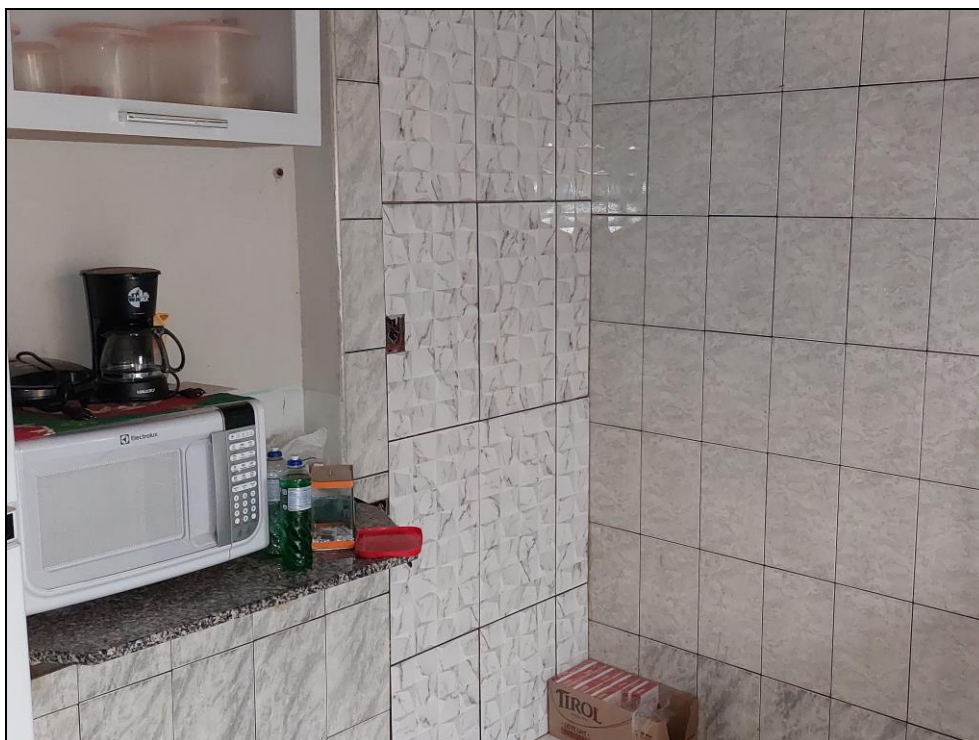
FOTO Nº 04:- Detalhe parcial do compartimento denominado cozinha, onde podemos observar os materiais que foram aplicados e o estado de uso e conservação.