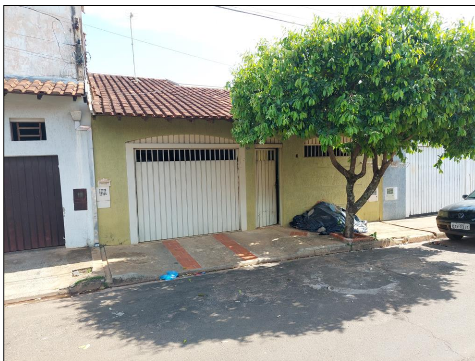
FOTO Nº 01:- Detalhe parcial do imóvel com frente para a Rua Vereador Mário Alves Pereira onde podemos observar as suas principais características construtivas.

A seguir juntamos fotos que ilustram a área objeto da presente avaliação, as quais foram obtidas durante a vistoria que realizamos, ou seja: