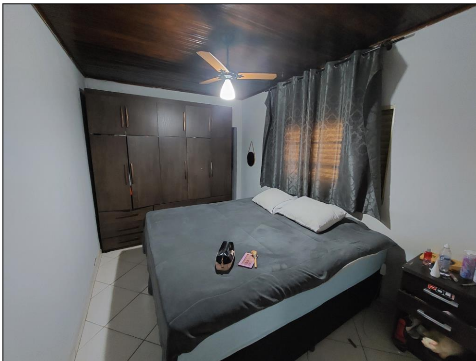
FOTO Nº 05:- Detalhe parcial interior de dum dos dormitórios existente no imóvel, onde podemos observar os acabamentos que foram aplicados.