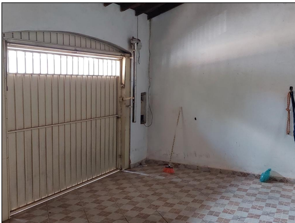
FOTO Nº 02:- Detalhe parcial do espaço destina da garagem de veículos, onde observamos as principais características construtivas desse local.