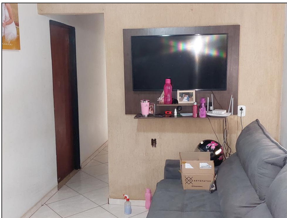
FOTO Nº 03:- Detalhe parcial do interior do imóvel, no compartimento denominado sala de estar.