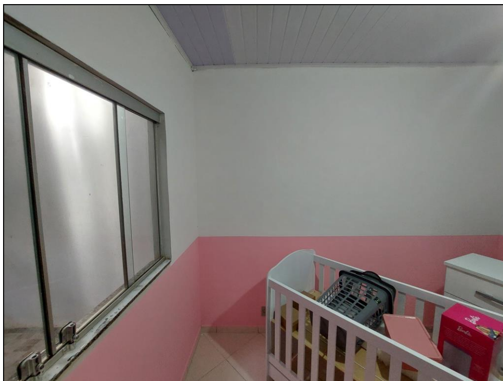
FOTO Nº 08:- Detalhe do interior do terceiro dormitório, onde podemos observar as principais características construtivas desse compartimento.