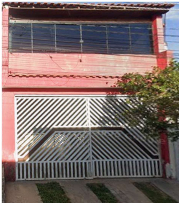
Foto 02- vista lateral direita