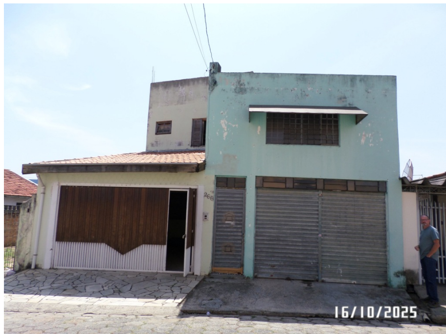
FOTO 02– VISTA FRONTAL DO IMÓVEL VISTORIADO COM FRENTE PARA RUA MARIANA, EMPLACAMENTO 266 (COMERCIAL) E 270 (RESIDENCIAL).

Rua Barão de Jacareí, 70 – Centro – Jacareí – SP CEP 12.308-001 – TEL. 12-3951.9136 E-mail – robertojuvele@hotmail.com