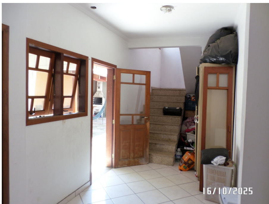
FOTO 07 – VISTA PARCIAL TÉRREO – HALL ACESSO ÁREA SERVIÇO E ESCADA SECUNDÁRIA AO SUPERIOR.