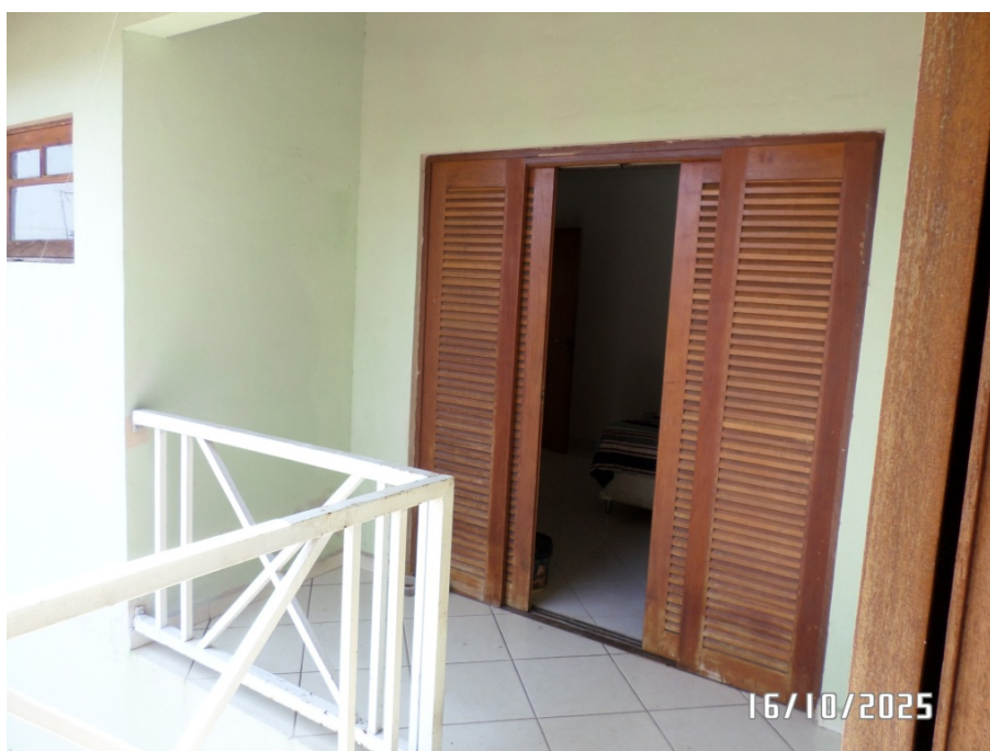
FOTO 16 – VISTA PARCIAL PAV. SUPERIOR – SACADA INTERLIGAÇÃO DORMITÓRIO 2 E DORMITÓRIO 3.