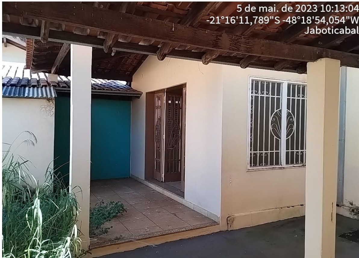
Figura 5 Hall de entrada.