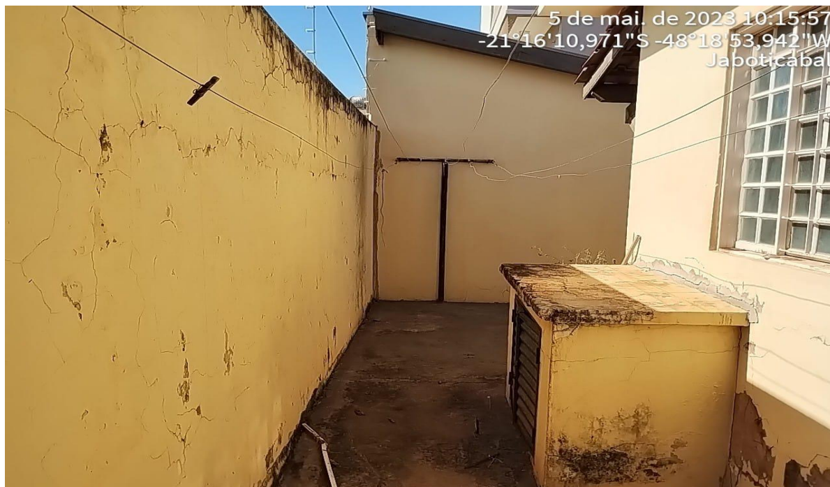
Figura 14 Fundos