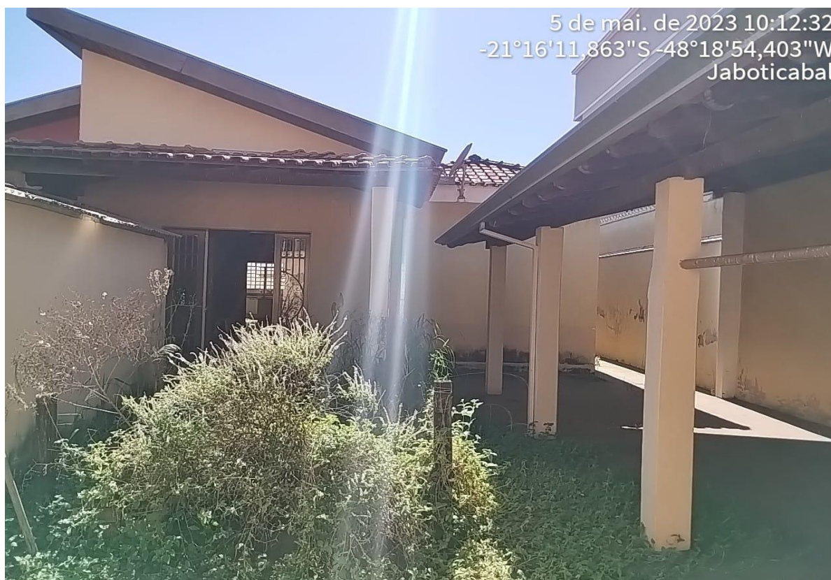
Figura 3 Fachada secundária do imóvel

A edificação como um todo possui padrão de CONSTRUÇÃO NORMAL EM ESTADO DE CONSERVAÇÃO RASOÁVEL NECESSITANDO DE PEQUENOS REPAROS , com IDADE APARENTE DE 20 ANOS .