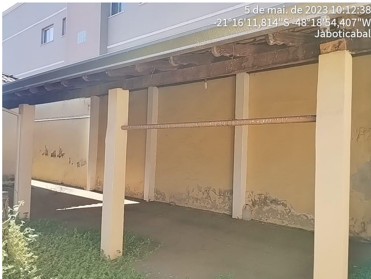
Figura 4 Garagem