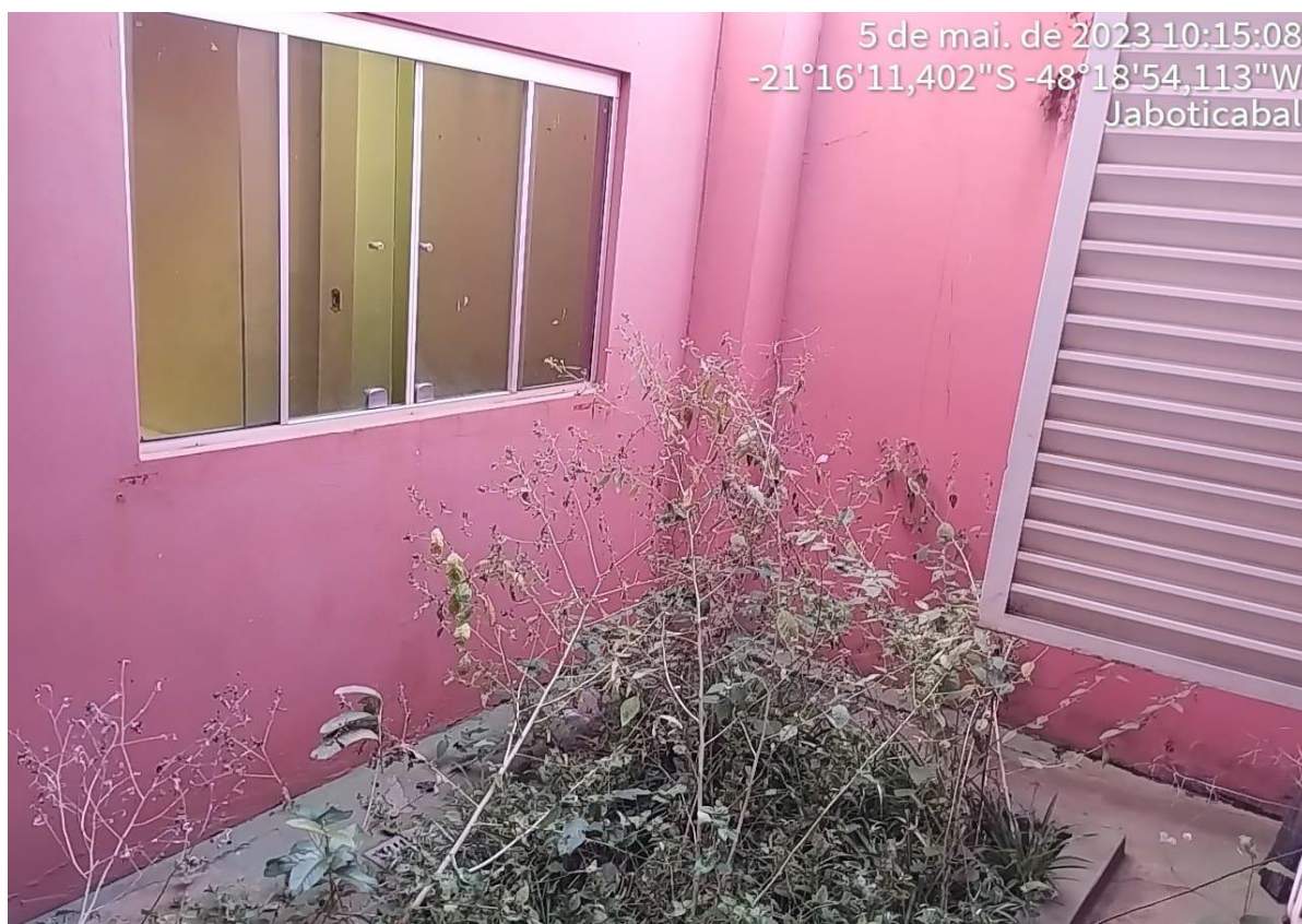
Figura 13 Jardim