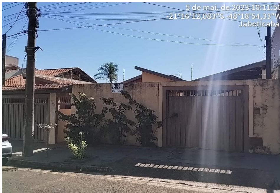
Figura 2 Vista do imóvel avaliando

Este trabalho considerou a área do terreno, bem como a área construída, como válidas para o imóvel avaliando, pois apesar não está averbada ela é mensurável, existente e de suma importância para as atividades comerciais do imóvel avaliando, portanto faz parte do imóvel.