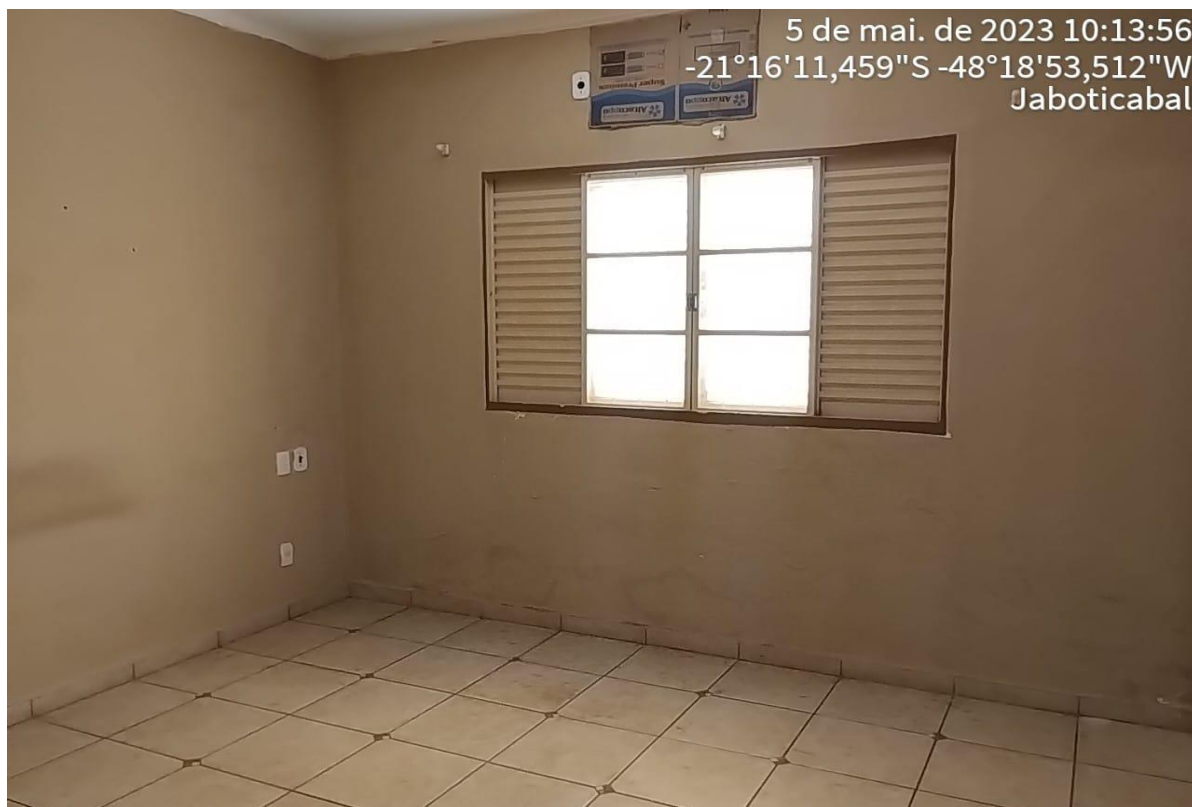
Figura 12 Dormitório