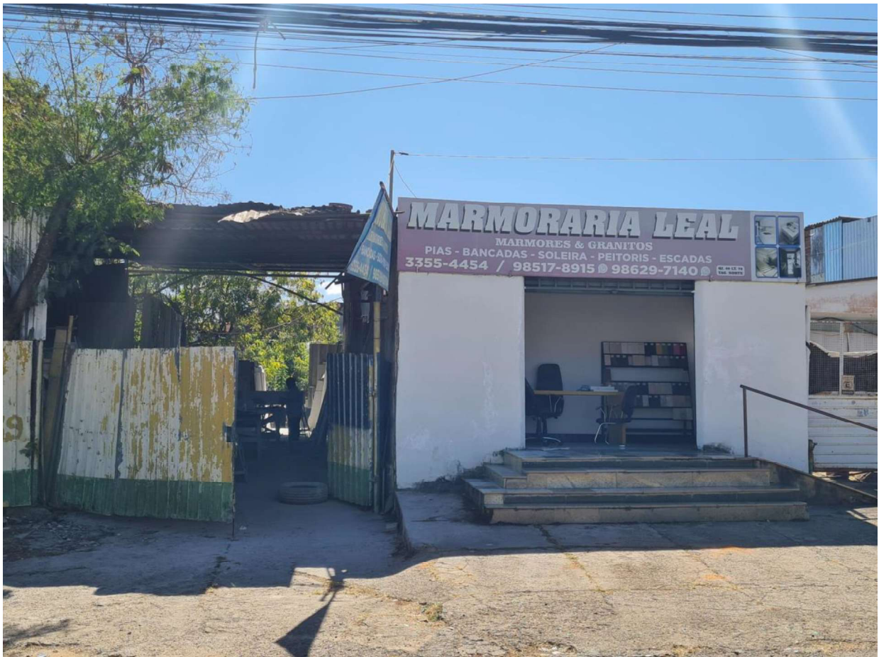
Frente do Imóvel