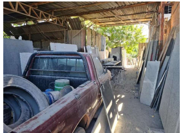
Interior do Galpão