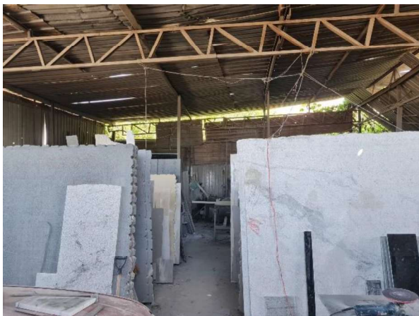
Interior do Galpão