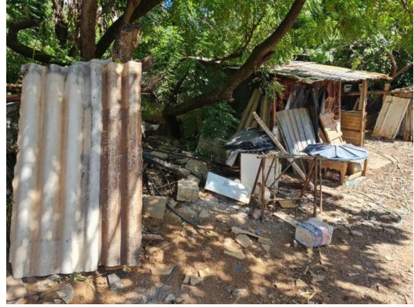
Fundos do Imóvel