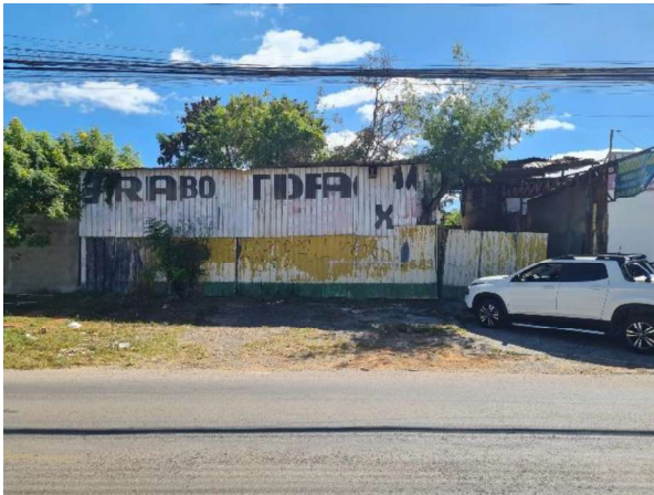
Frente do Imóvel