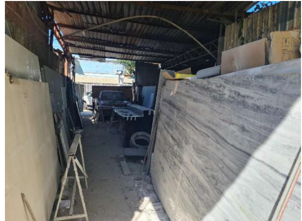
Interior do Galpão