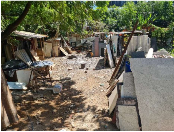
Fundos do Imóvel