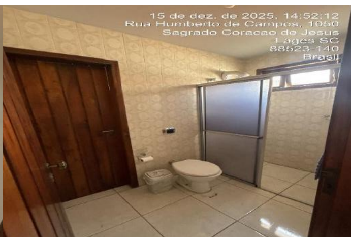
Inserir descrição da foto