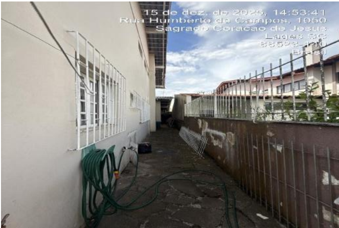
Inserir descrição da foto