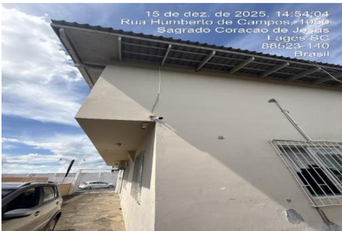
Inserir descrição da foto

Precisão e Fundamentação conforme NBR 14.653-2