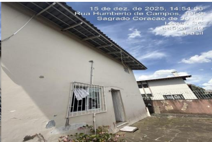
Inserir descrição da foto