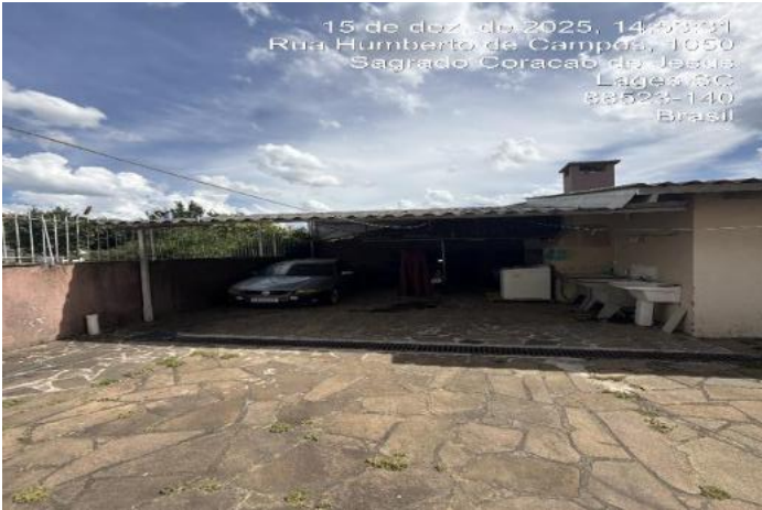
Inserir descrição da foto