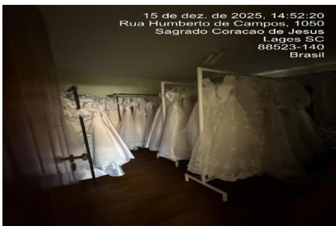
Inserir descrição da foto