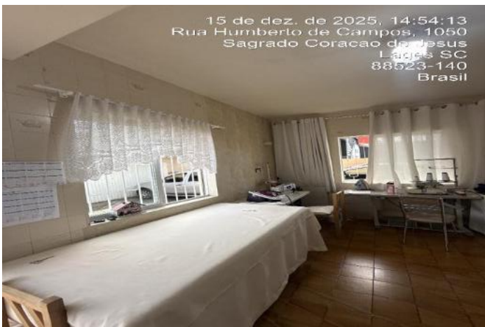
Inserir descrição da foto