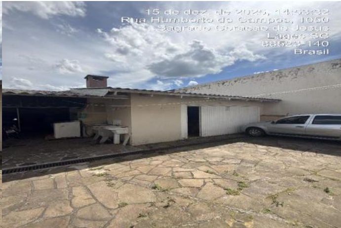
Inserir descrição da foto