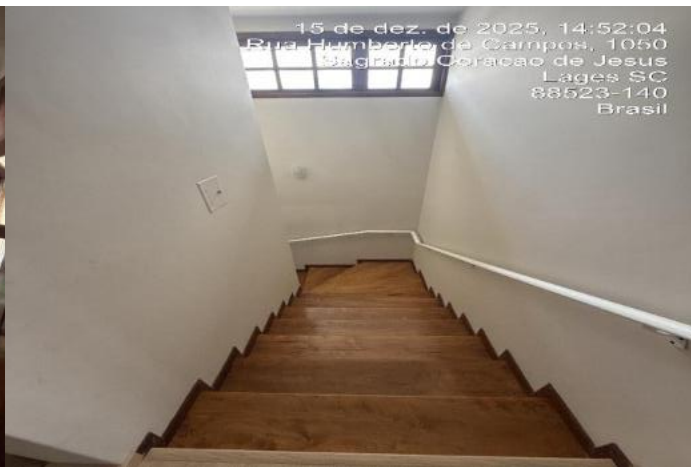
Inserir descrição da foto