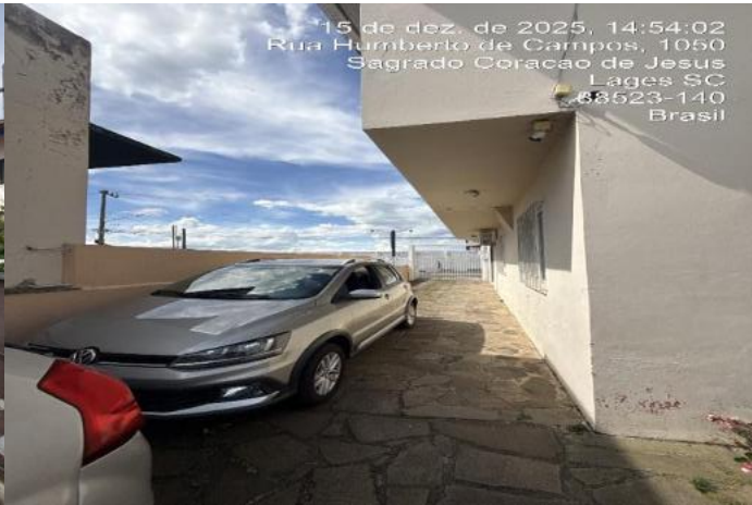
Inserir descrição da foto