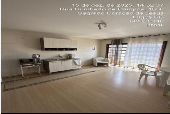
Inserir descrição da foto

Precisão e Fundamentação conforme NBR 14.653-2