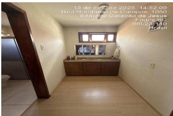
Inserir descrição da foto