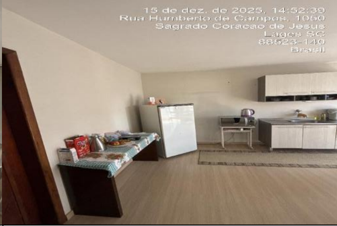
Inserir descrição da foto