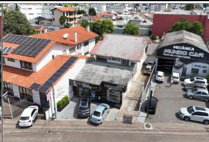
Vista do Logradouro