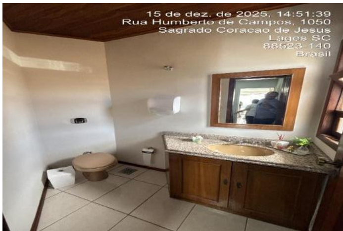
Inserir descrição da foto

Precisão e Fundamentação conforme NBR 14.653-2