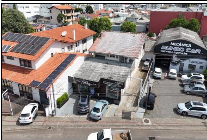
Vista de Identificação do Logradouro