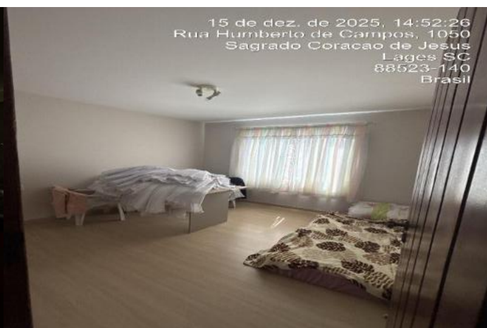
Inserir descrição da foto