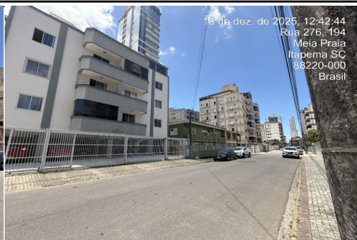
Vista de Identificação do Logradouro Vista do Logradouro