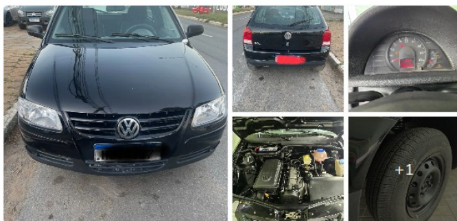
Gol 1.0 2013

Com manual Chave reserva Revisões feitas em concessionária