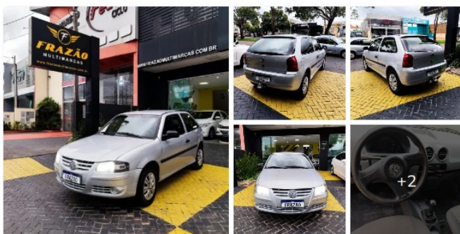
GOL 1.0 3P GIV