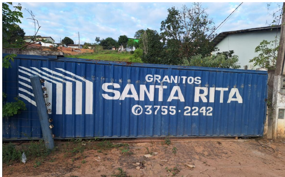
Figura 4 - Portão