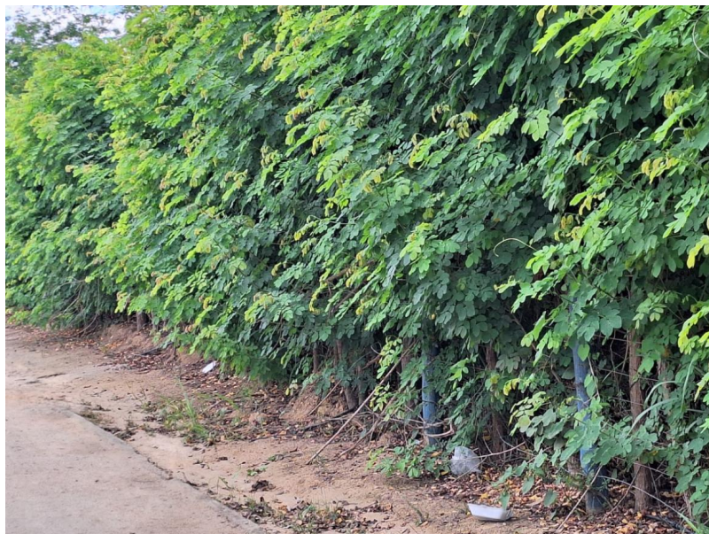
Figura 2 - Frente