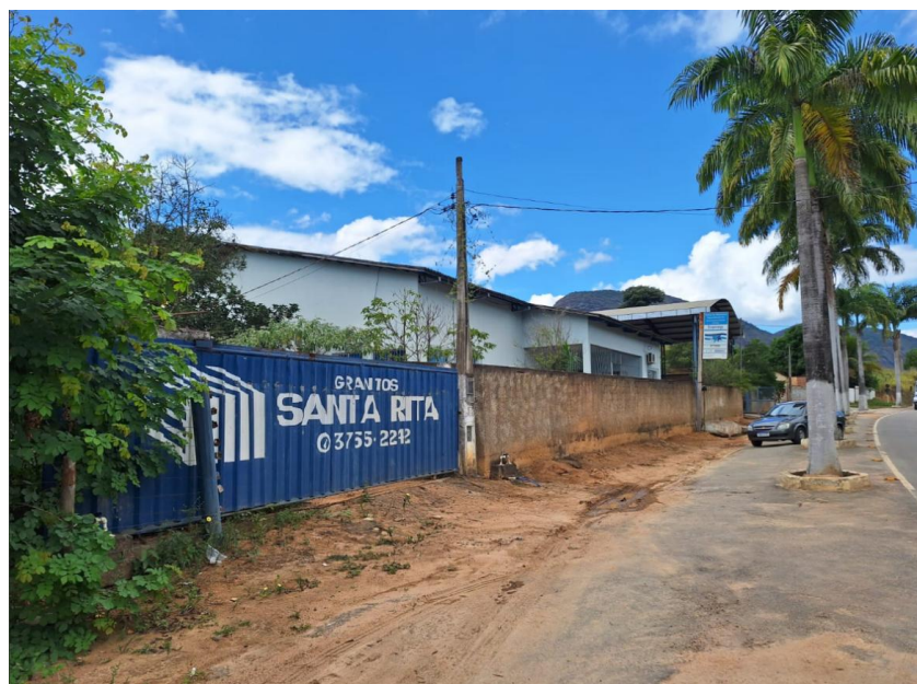
Figura 3 - Portão