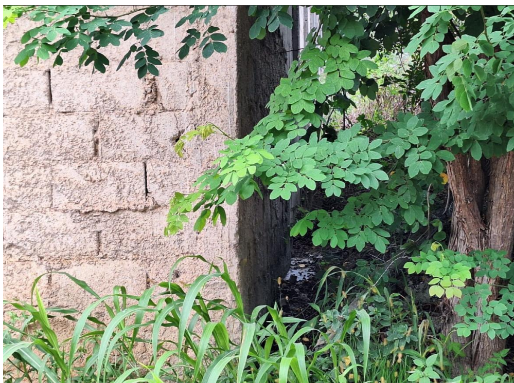
Figura 5 - Lateral do imóvel