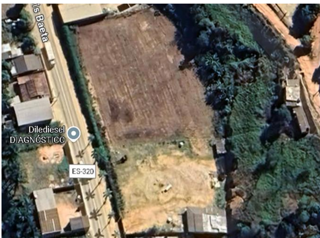
Figura 1 - vista aérea do terreno

https://maps.app.goo.gl/K5AaEUc9xQAtnFi79