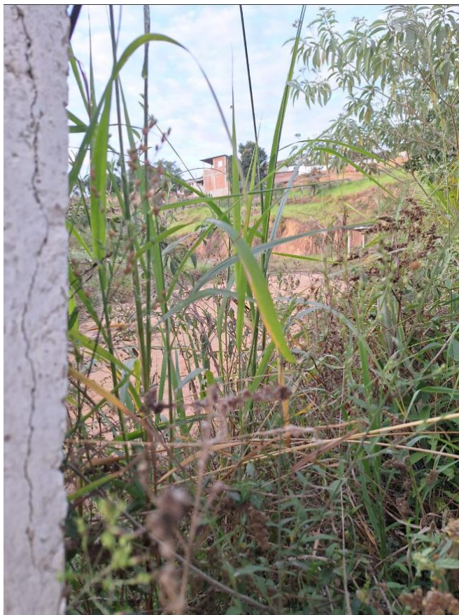
Figura - interior do imóvel