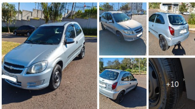
Celta LS 1.0 2P 2012 básico

Logo abaixo, algumas amostras de veículos semelhante ao modelo, em ótimo estado de conservação e funcionamento: