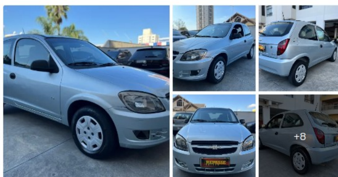
Chevrolet Celta Life/ LS 1.0 MPFI 8V Flexpower 3P 2012