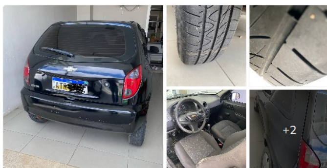
Chevrolet Celta Life/ LS 1.0 MPFI 8V Flexpower 3P 2012