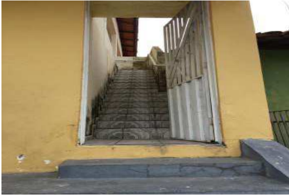
Escada de acesso ao pavimento superior

Poder Judiciário do Estado do Tocantins Comarca de 3ª Entrância de Arraias Sala dos Oficiais de Justiça Central de Perícias, Avaliações e demais atos Rua 18, Qd. 46, Lt. 10, Edifício do Fórum Juiz Alair de Sena Conceição, Setor Parque das Colinas, Arraias-TO CEP: 77330-000; Fone: (63) 3378-1234