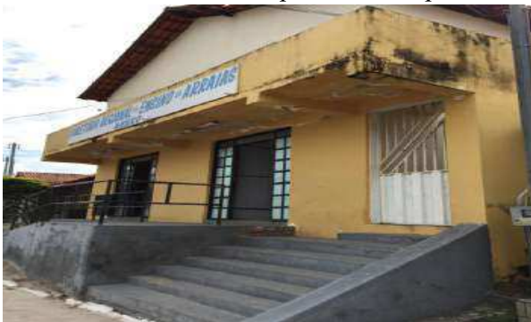
Frente do imóvel