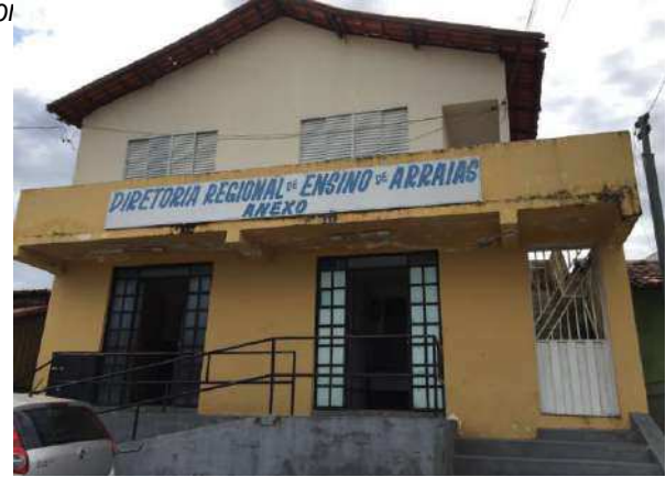
Frente do imóvel