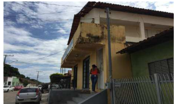
Visão lateral do imóvel