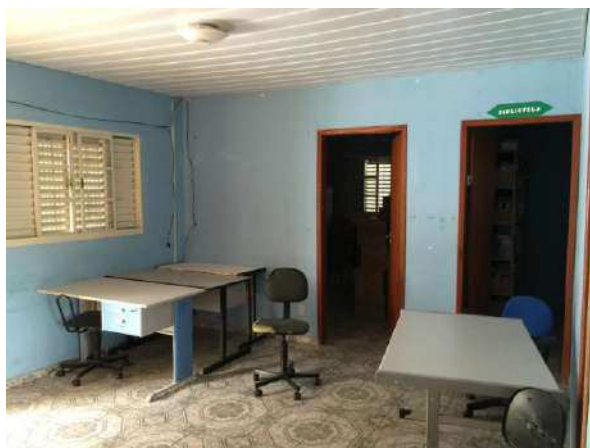
Interior do imóvel