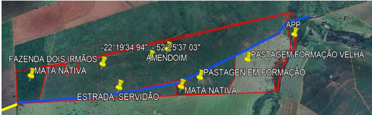
Imagem de Satélite.

Do ponto de vista agrônomo , a propriedade apresenta bom potencial de uso. O solo, embora arenoso, é profundo, bem drenado e apresenta aptidão agrícola moderada a boa para culturas como amendoim, mandioca, cana-de-açúcar e pastagens, desde que manejado corretamente. A topografia com leve declive e levemente ondulada favorece operações mecanizadas. A presença de fragmentos de mata e APP contribui para a regularidade ambiental do imóvel. Esses fatores, somados à localização estratégica e ao uso agrícola regional, conferem ao imóvel uma nota agrônoma intermediária, com bom potencial produtivo e valorização sustentável.