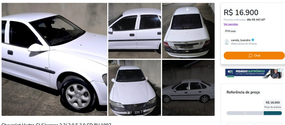
Chevrolet Vectra GLS/express.2.2/ 2.0 E 2.0 CD 8V 1997

www.deonizialeiloes.com.br contato@deonizialeiloes.com.br | deonizia@deonizialeiloes.com.br | 0800 500 9934