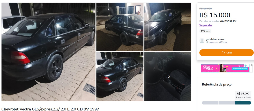
Chevrolet Vectra GLS/express.2.2/ 2.0 E 2.0 CD 8V 1997