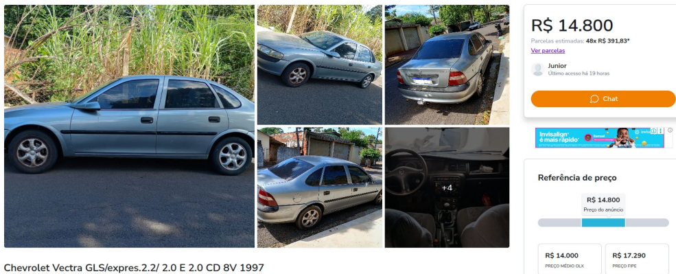
Chevrolet Vectra GLS/express.2.2/ 2.0 E 2.0 CD 8V 1997

Segue abaixo, algumas amostras de veículos do mesmo ano, modelo e em bom estado de conservação e funcionamento: