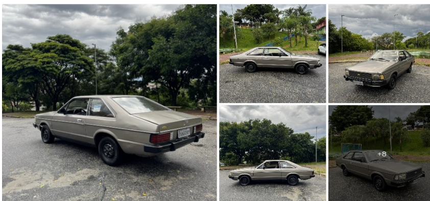
Ford Corcel II Gl/gt 1981