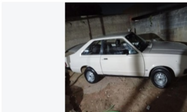
Ford Corcel II L 1983

Logo abaixo, seguem algumas amostras de veículos do mesmo ano, modelo e em bom estado de conservação e funcionamento: