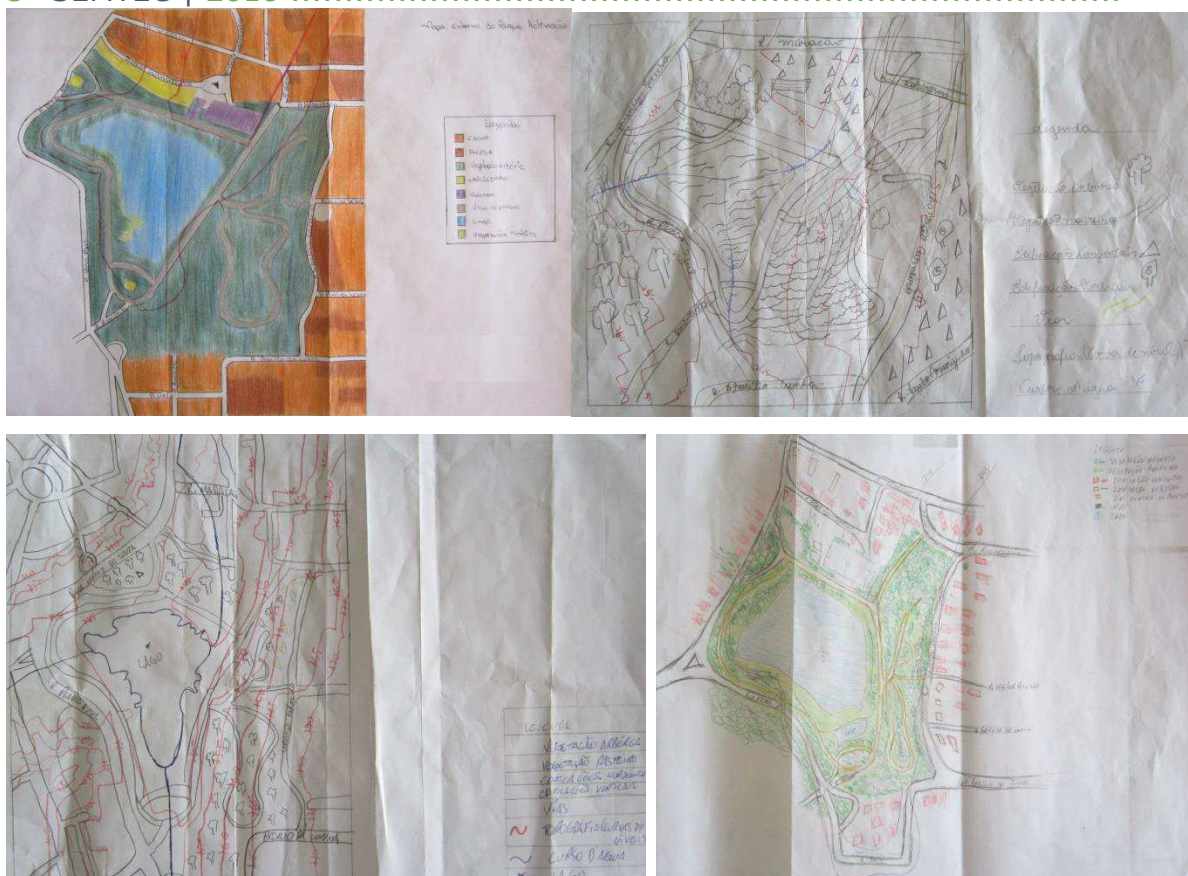
Figura 04: Mapas (sem escala) representados pelos alunos em aula na sala de informática e confirmados em aula de campo.

A maior dificuldade encontrada pelos alunos foi representar as curvas de nível e dos cursos d'água, que foram demonstrados e referendados no trabalho de campo para o perfeito entendimento dos estudantes.