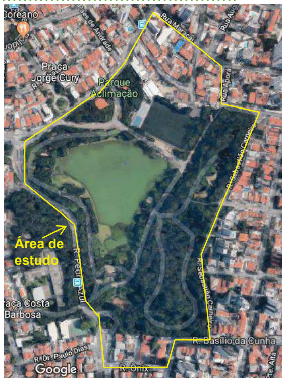
Figura 02: Área de estudo.

Nesses sítios, os alunos localizaram o Parque da Aclimação e seus arredores, nas abas de procura. A partir daí, iniciaram os trabalhos de escritório, desenhando, em folha de papel sulfite A3, a área de estudo e as seguintes ocupações do solo, visualizadas no Google Maps : vegetação arbórea, vegetação rasteira, edificações horizontais, edificações verticais e vias de acesso. Os alunos também mapearam as curvas de nível, que representam a topografia do terreno e os cursos d'água, que banham a área de estudo, baseadas nas informações do GeoSampa .