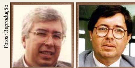
Luiz Antônio Fleury Filho, ex-governador de SP, e Luiz Antonio Guimarães Marrey, ex-PGJ

‘CARTA DE CURITIBA’ – Como presidente da APMP (e da Conamp), Fleury Filho também participou do 1º Encontro Nacional de Procuradores-Gerais e Presidentes de Associações Estaduais de MP, em junho de 1986, no Paraná, como integrante da comitiva do MPSP e como um dos autores da “Carta de Curitiba”, conjunto de propostas que serviria como tex-