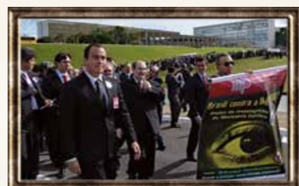
Marcha de representantes do MP em Brasília