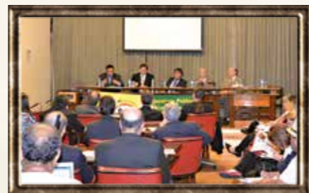
Audiência organizada pela APMP na Alesp

intitulado “A quem interessa enfraquecer o Defensor da Sociedade?”. Oito dias depois, mais de 300 pessoas compareceram ao ato contra a PEC 37 organizado pela APMP, o MPD, a Escola Superior do Ministério Público (ESMP) e a Procuradoria-Geral de Justiça (PGJ) no edifício-sede do Ministério Público de São Paulo (MPSP).