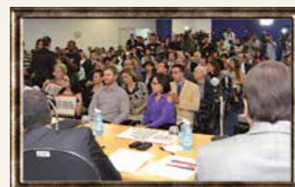
'Carta de SP' foi lançada em evento na ESMP

Para disseminar a campanha no interior, o (então)