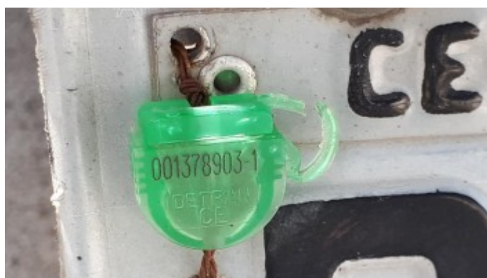
Foto do lacre da placa