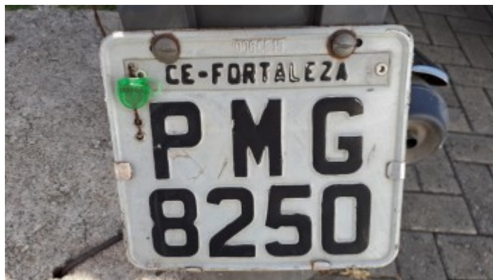
Foto da placa traseira