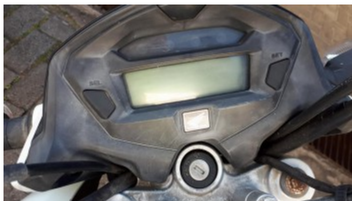
Foto do painel