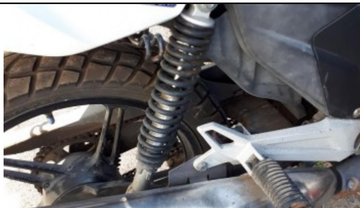
Foto Estrutura Suspensão traseira