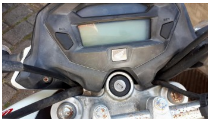
Foto do odômetro