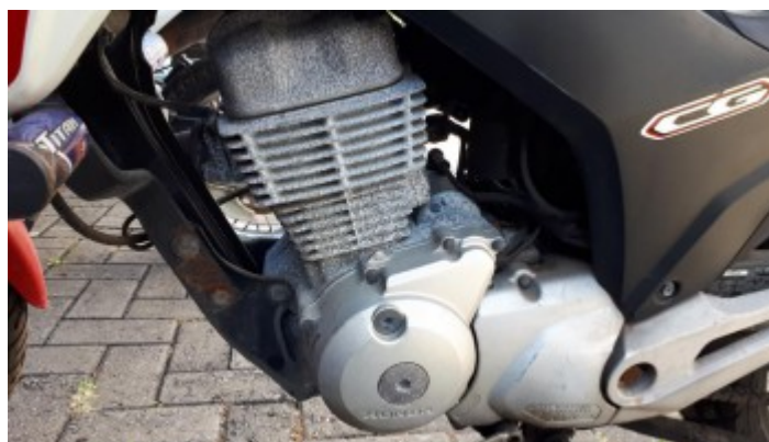
Foto do compartimento do motor