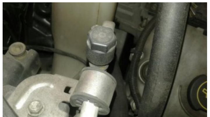
Foto Ar Condicionado