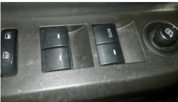
Foto Vidros Elétricos