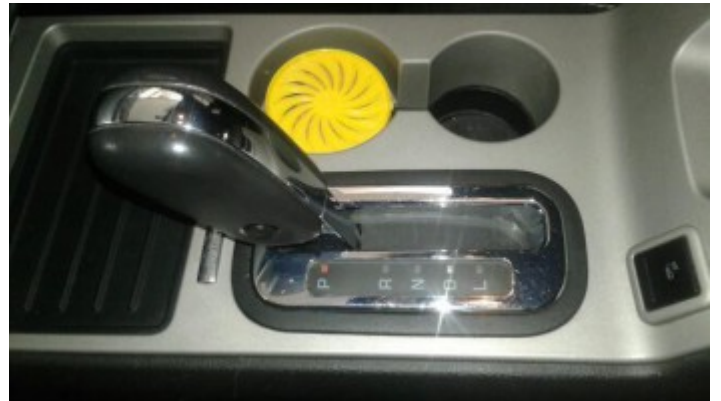
Foto Cambio Automático