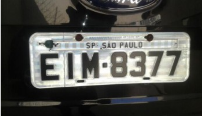
Foto da placa traseira