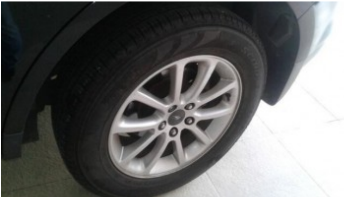
Foto Rodas de Liga Leve