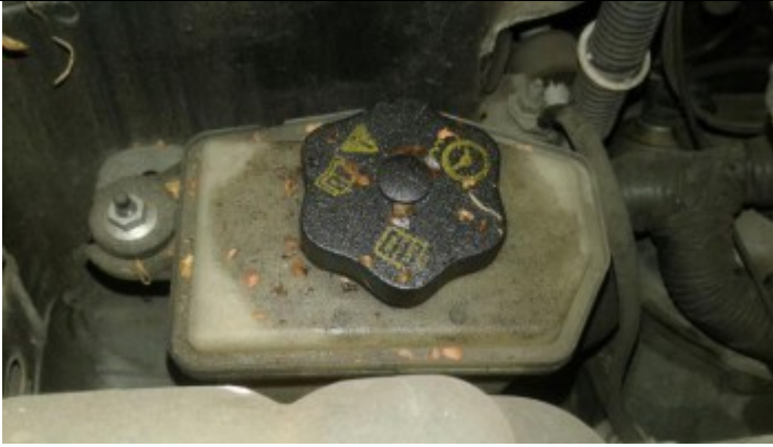
Foto Direção Assistida