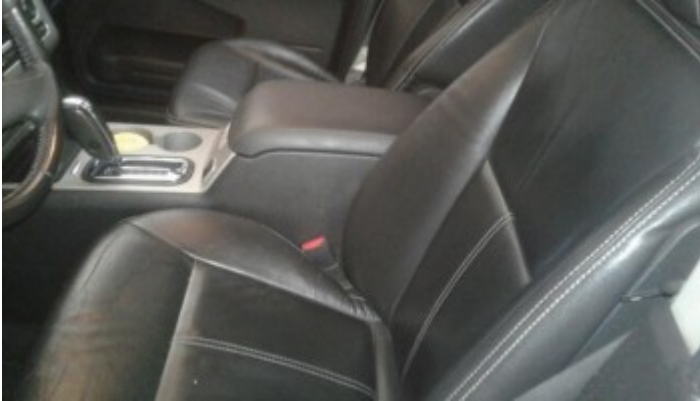
Foto Forrações em Couro