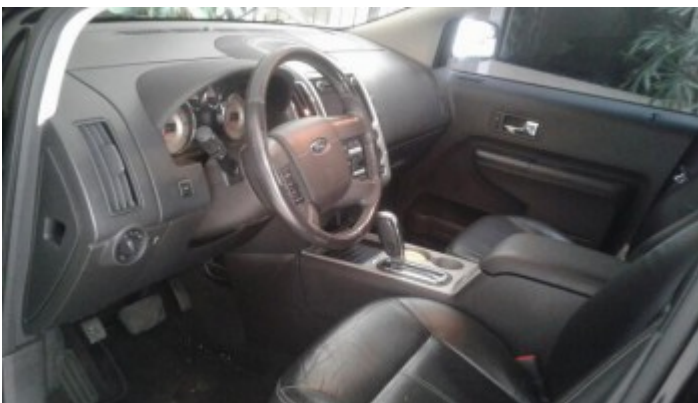
Foto do interior do veículo