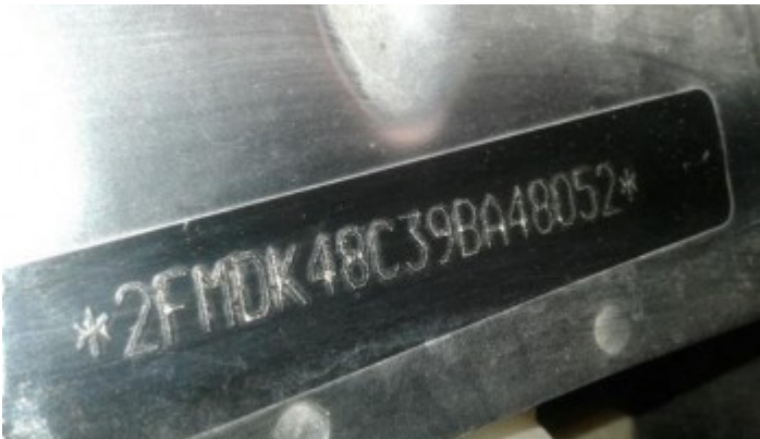
Chassi : 2FMDK48C39BA48052