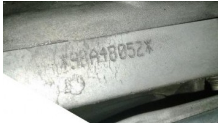
Número do Motor : 9BA48052