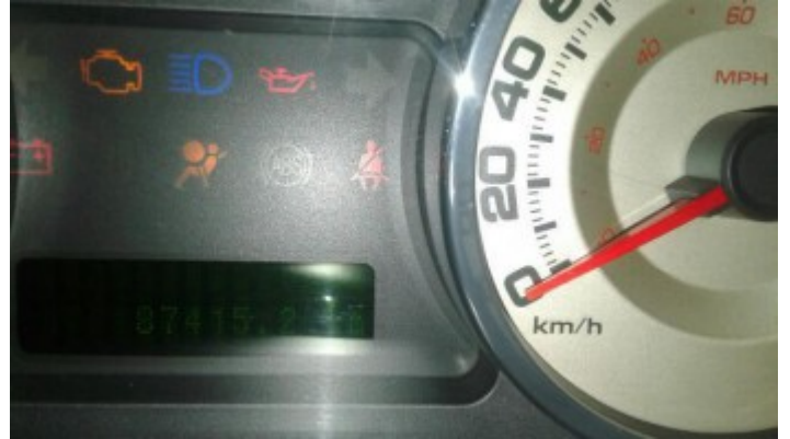
Foto Freios ABS