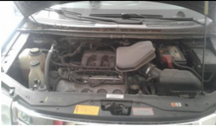
Foto do compartimento do motor