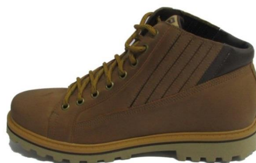
Calçado com laminado “Mamute”