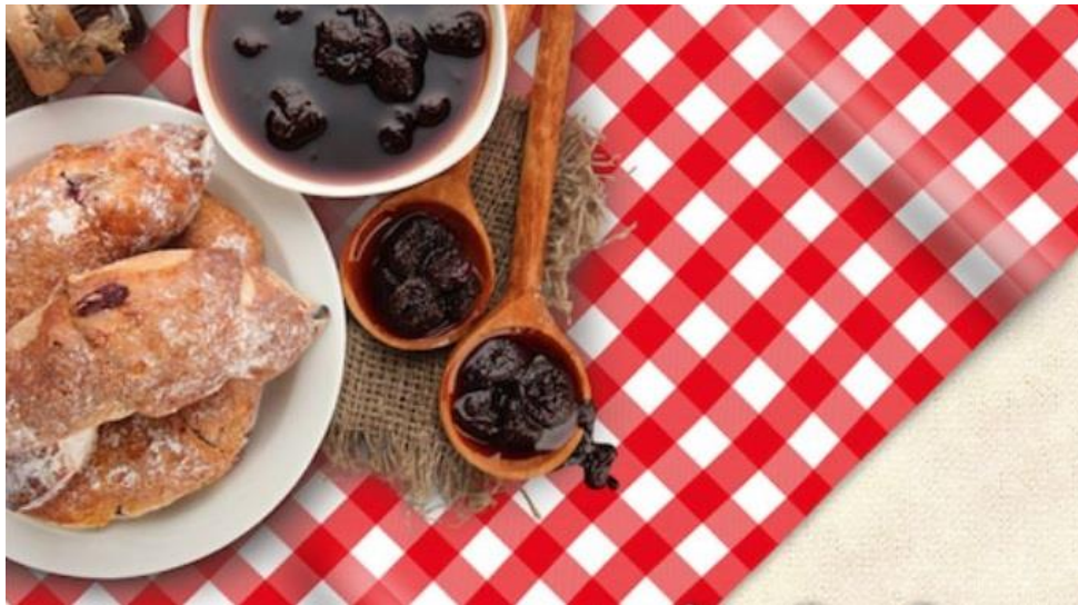
Versão Chessmate da marca Decorelli

A Cipatex®, por meio da marca Decorelli®, oferece ao mercado toalhas em PVC em diversas estampas para compor a festança. O xadrez aparece na versão Chessmate nas cores preto, azul, verde e vermelho. Nas mesmas cores, flores e quadrados se misturam na estampa Tavern.