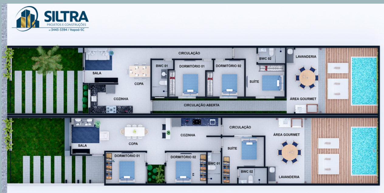
01 PLANTA BAIXA TÉRREO ESCALA 1:75

A FACHADA FOI CRIADA COM O OBJETIVO DE DAR A ILUSÃO DE SER APENAS UMA CASA PARA QUEM VER DA RUA. FOI UTILIZADO TONS NEUTROS E BASTANTE ILUMINAÇÃO COM DETALHES MODERNOS.