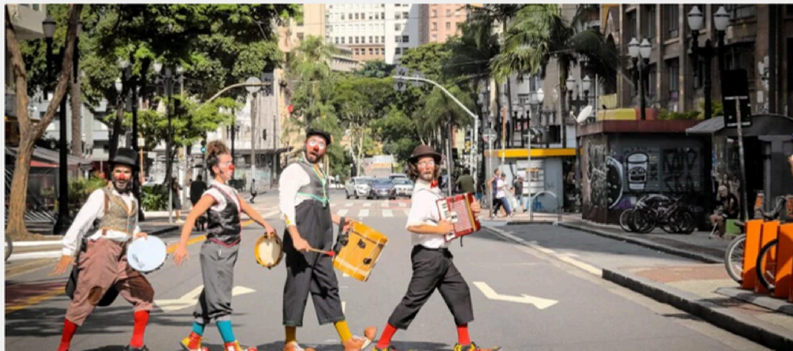
Truques e Trambiques na Mostra de Teatro Rua Lino Rojas em SP

Com o estresse térmico das ondas de calor e as perdas com a chuva, tanto a arte quanto às possibilidades financeiras são afetadas