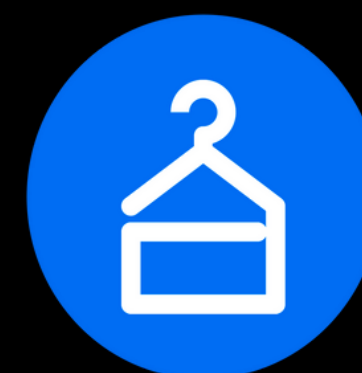
Pavilhão do Atacado