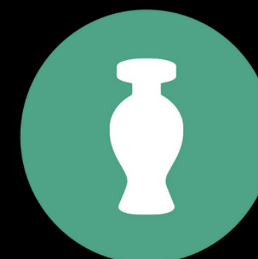
Grupo Glória (Boticário)