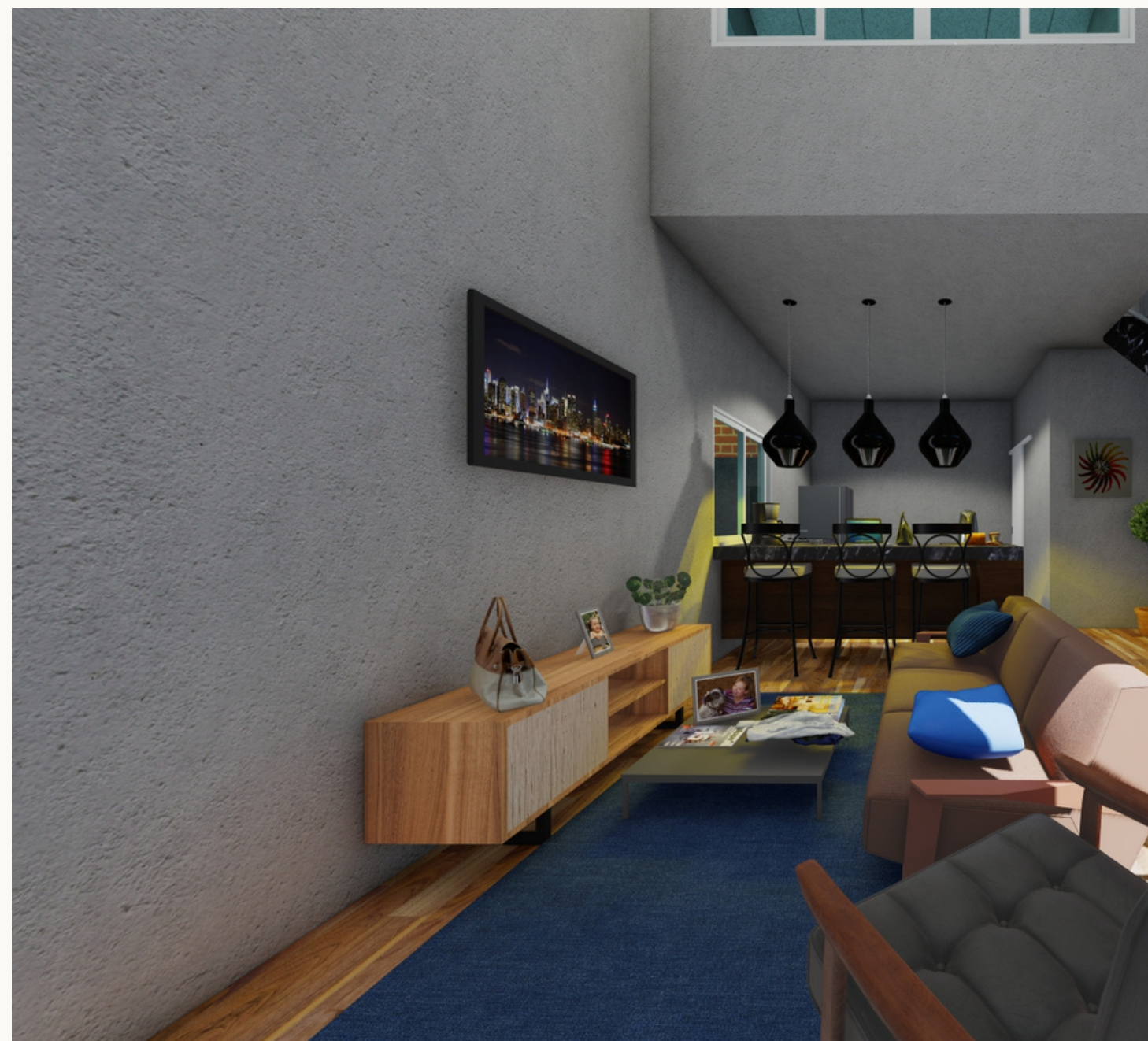
Casa Conexão Ímpar