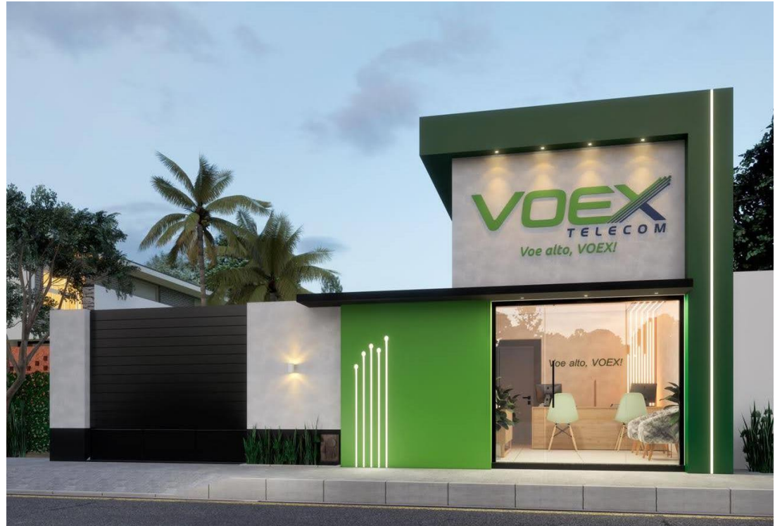
VOEX Telecom, Jaícos - PI