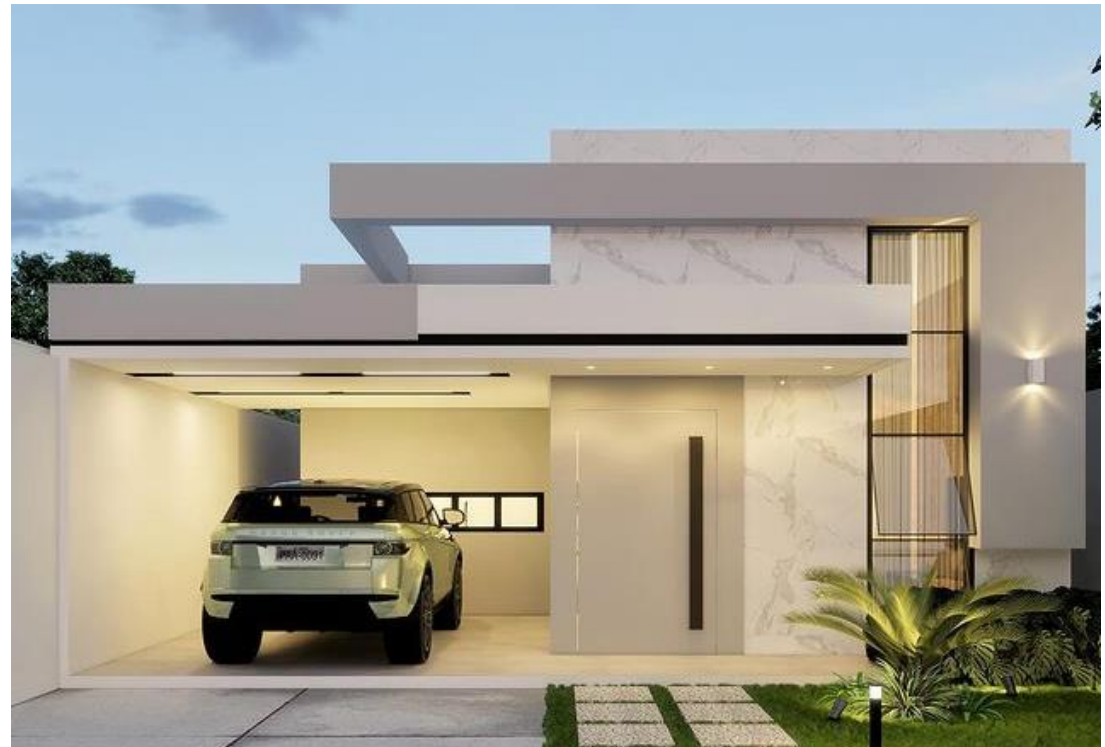
Fachada RF, Picos – PI [parceria Casa A2]