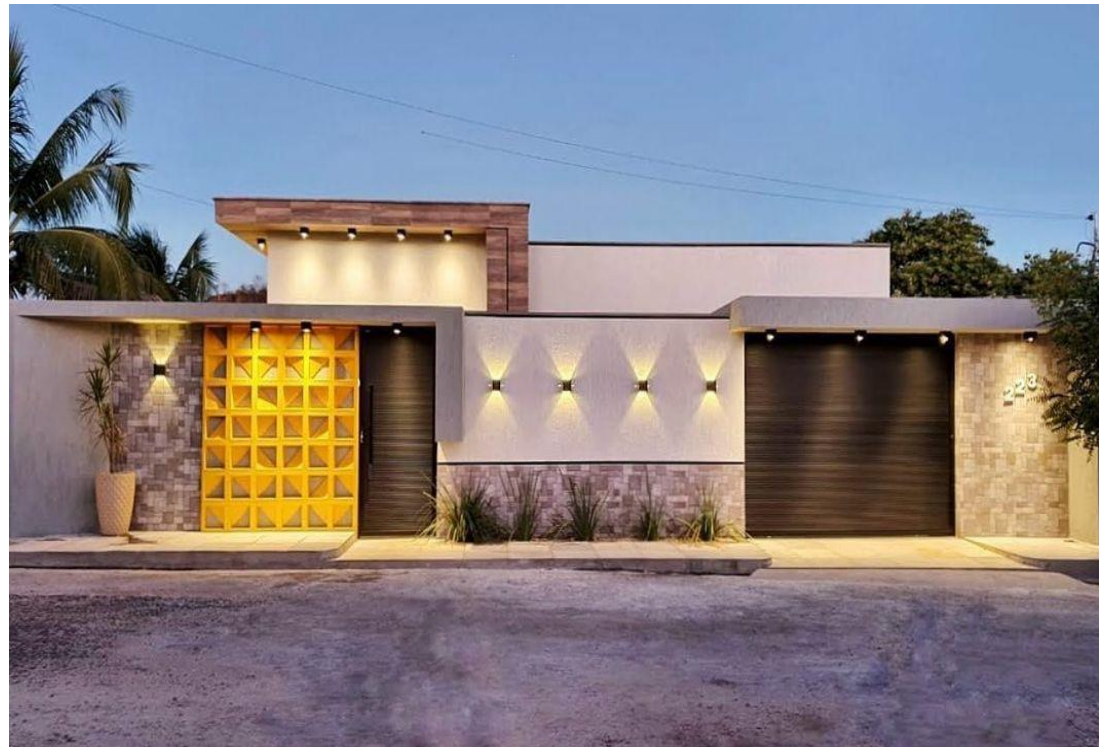
Reforma de Fachada, Dom Expedito Lopes – PI [parceria LUCAR Arquiteto]