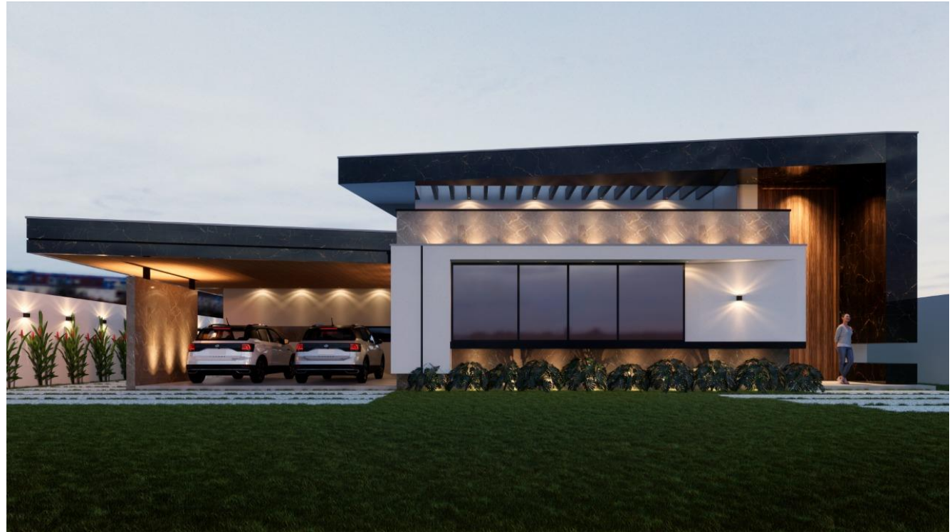
Casa AS, Picos – PI [parceria LUCAR Arquiteto]