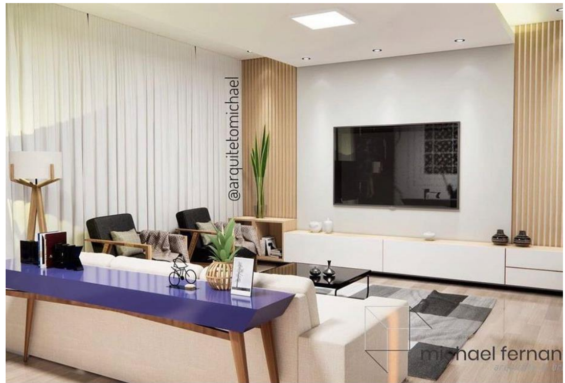
Sala AC, Redenção do Gurguéia - PI