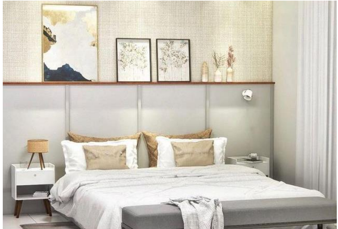
Quarto MJ, Redenção do Gurguéia - PI