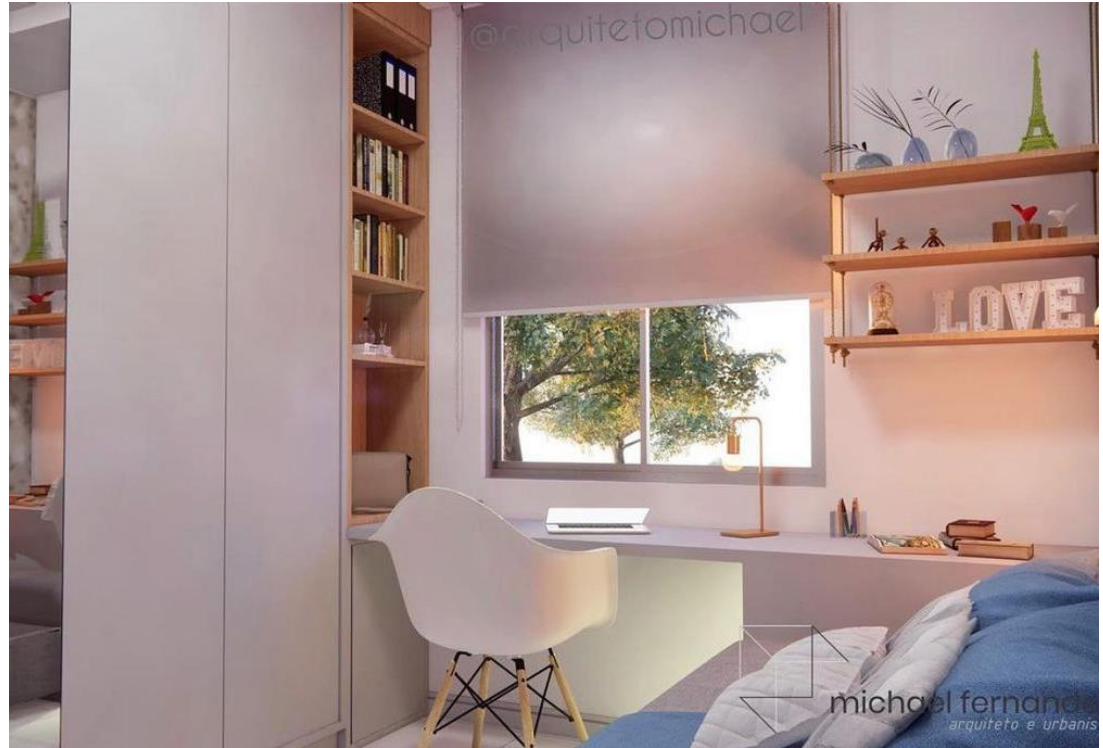
Quarto IV, Redenção do Gurguéia - PI