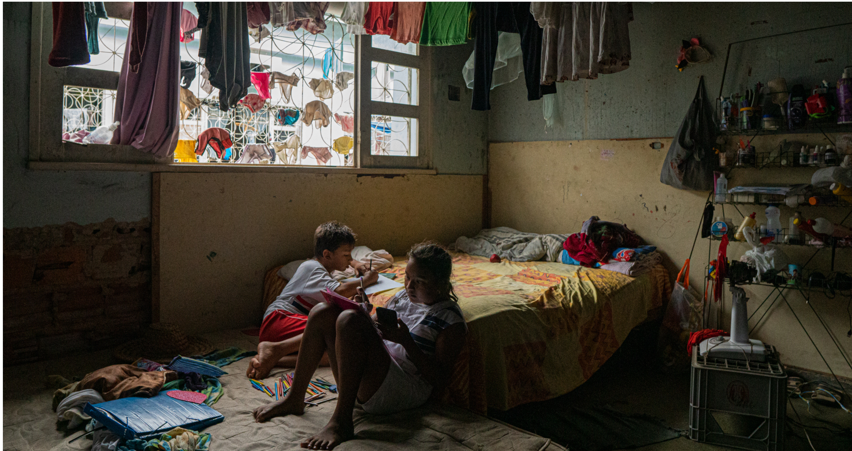
Ocupação de imigrantes venezuelanos em Boa Vista, RR, Brasil, 2019.