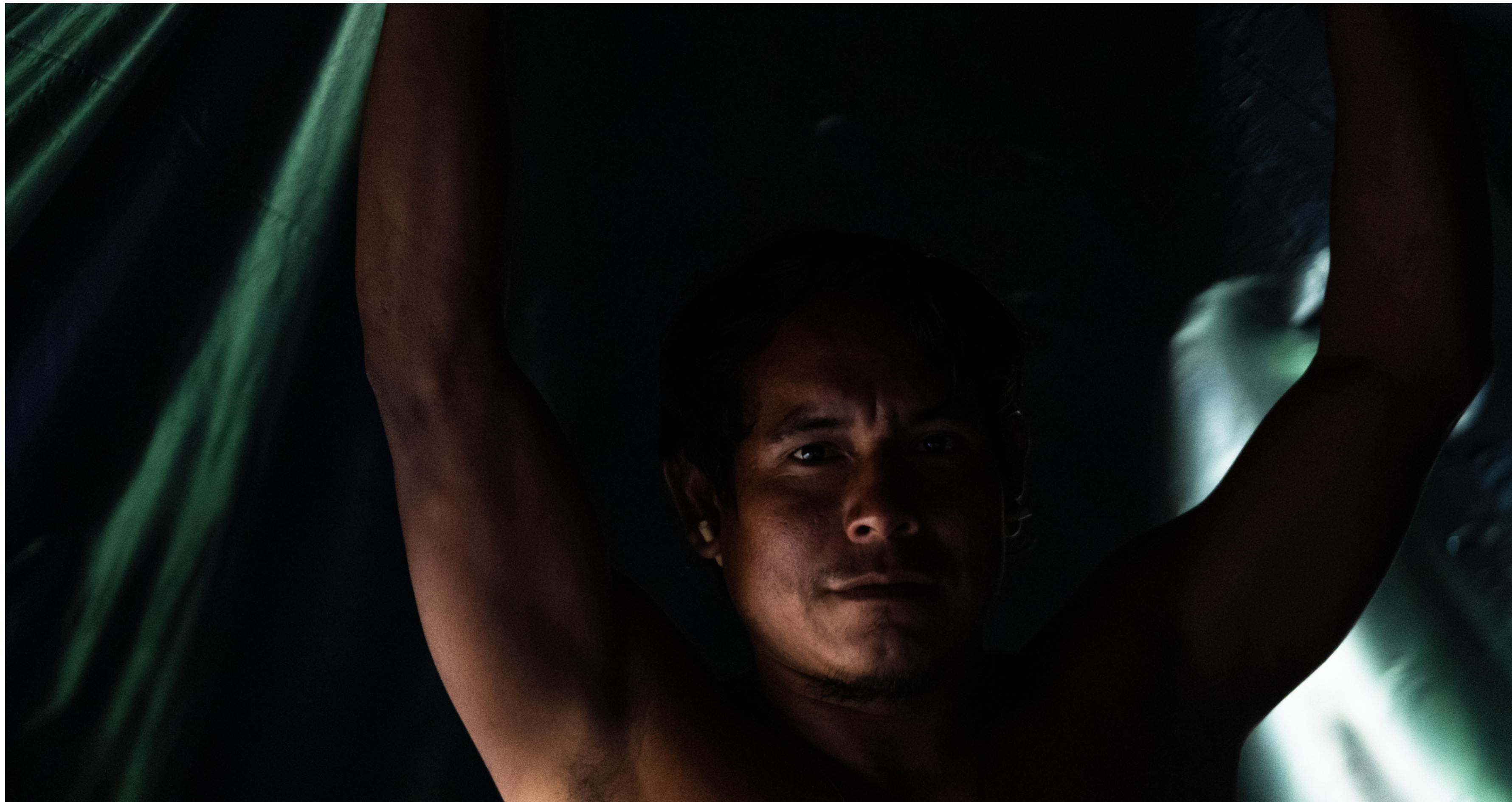
18º Acampamento Terra Livre , Brasília, DF, Brasil, 2022.