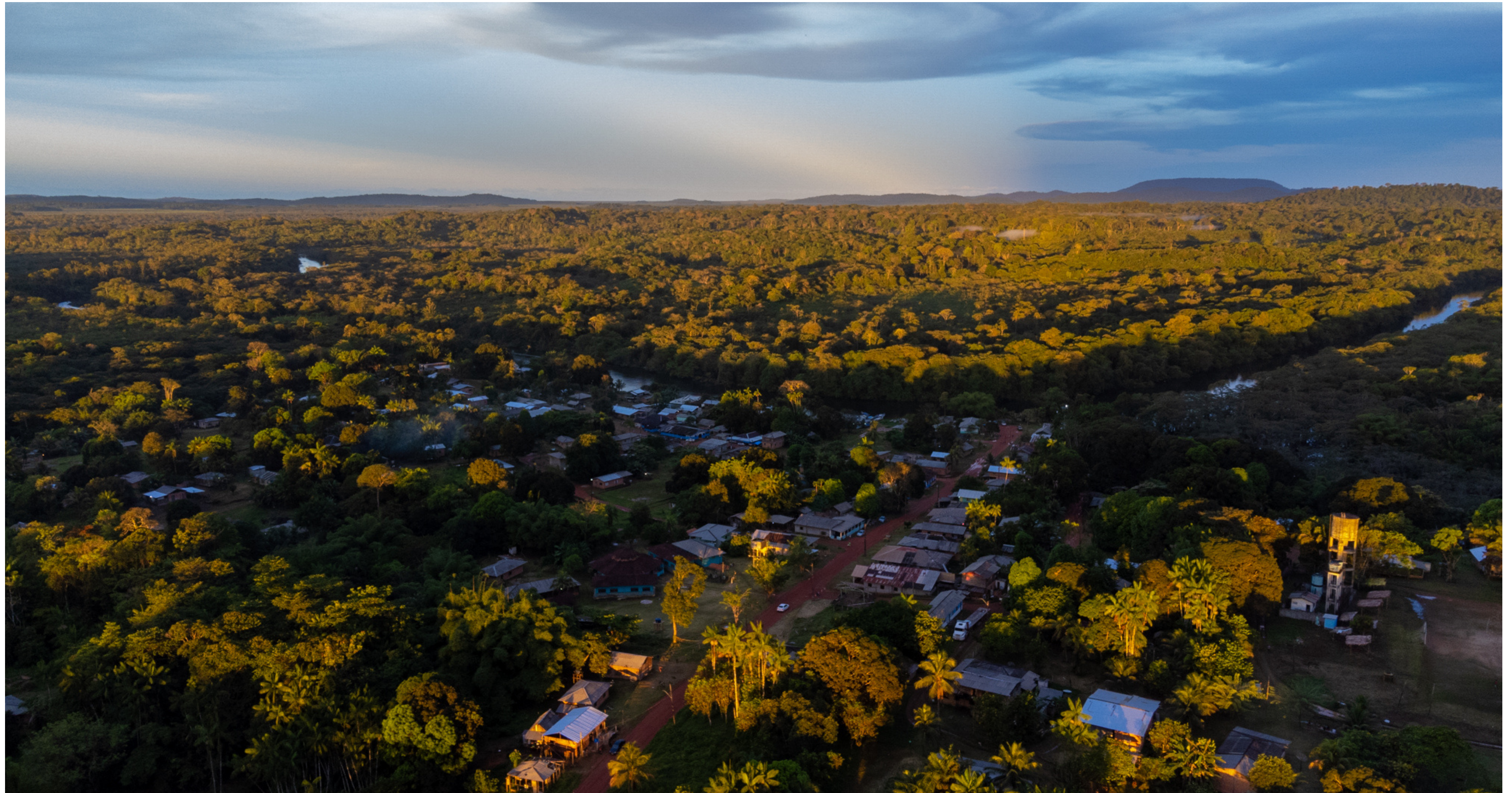
Aldeia Manga, Terra Indígena Uaçá, AP, Brasil, 2022.