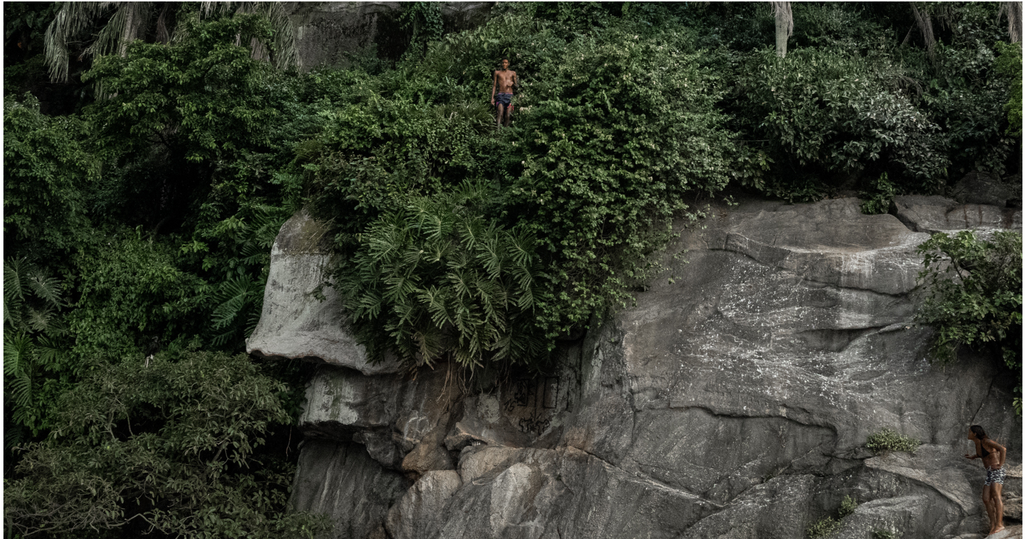
Ilha de Urubuqueçaba, Santos, SP, Brasil, 2020.