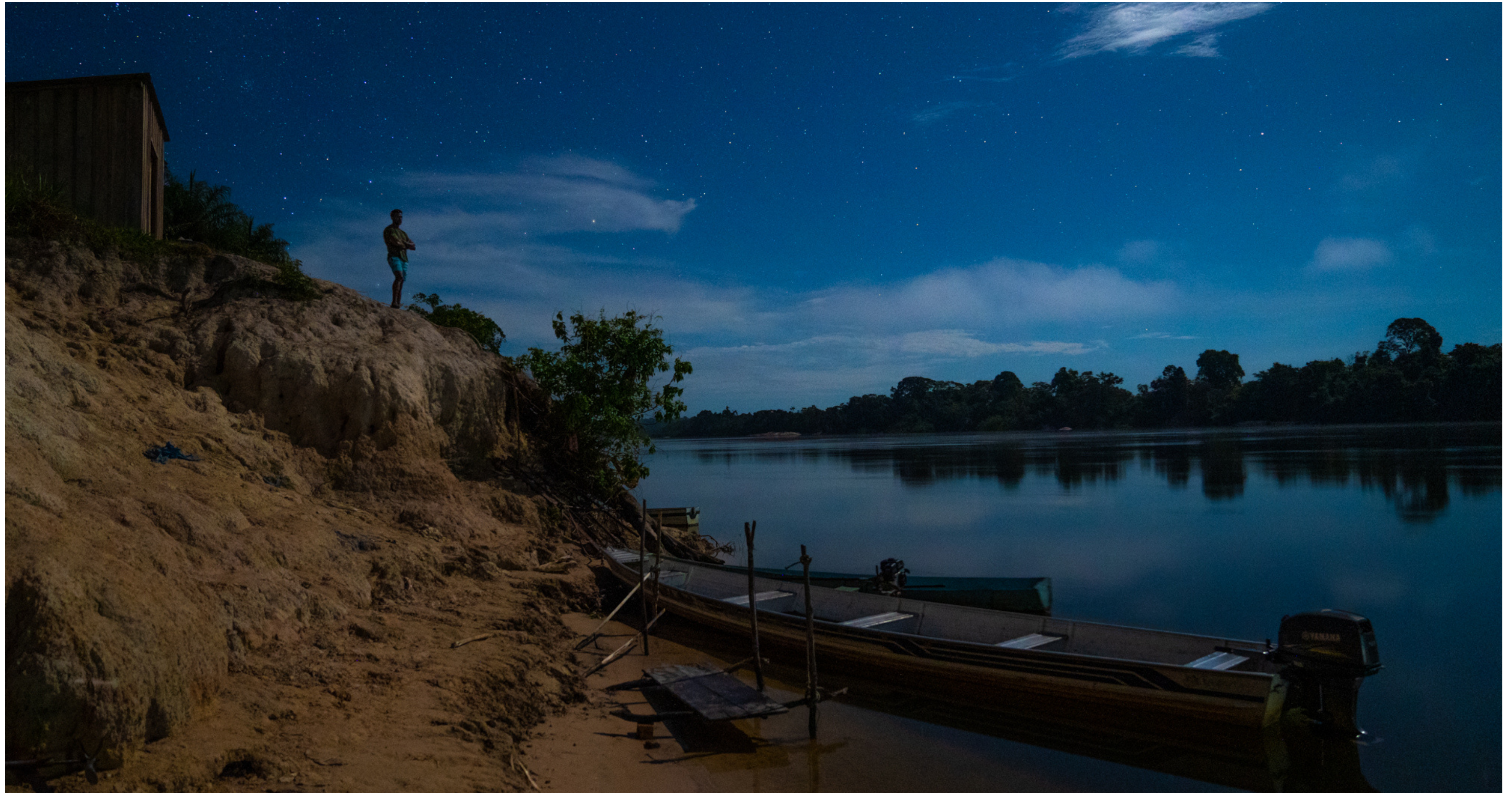
Aldeia Teles Pires do povo Munduruku, TI Kayabi, PA, Brasil, 2022.