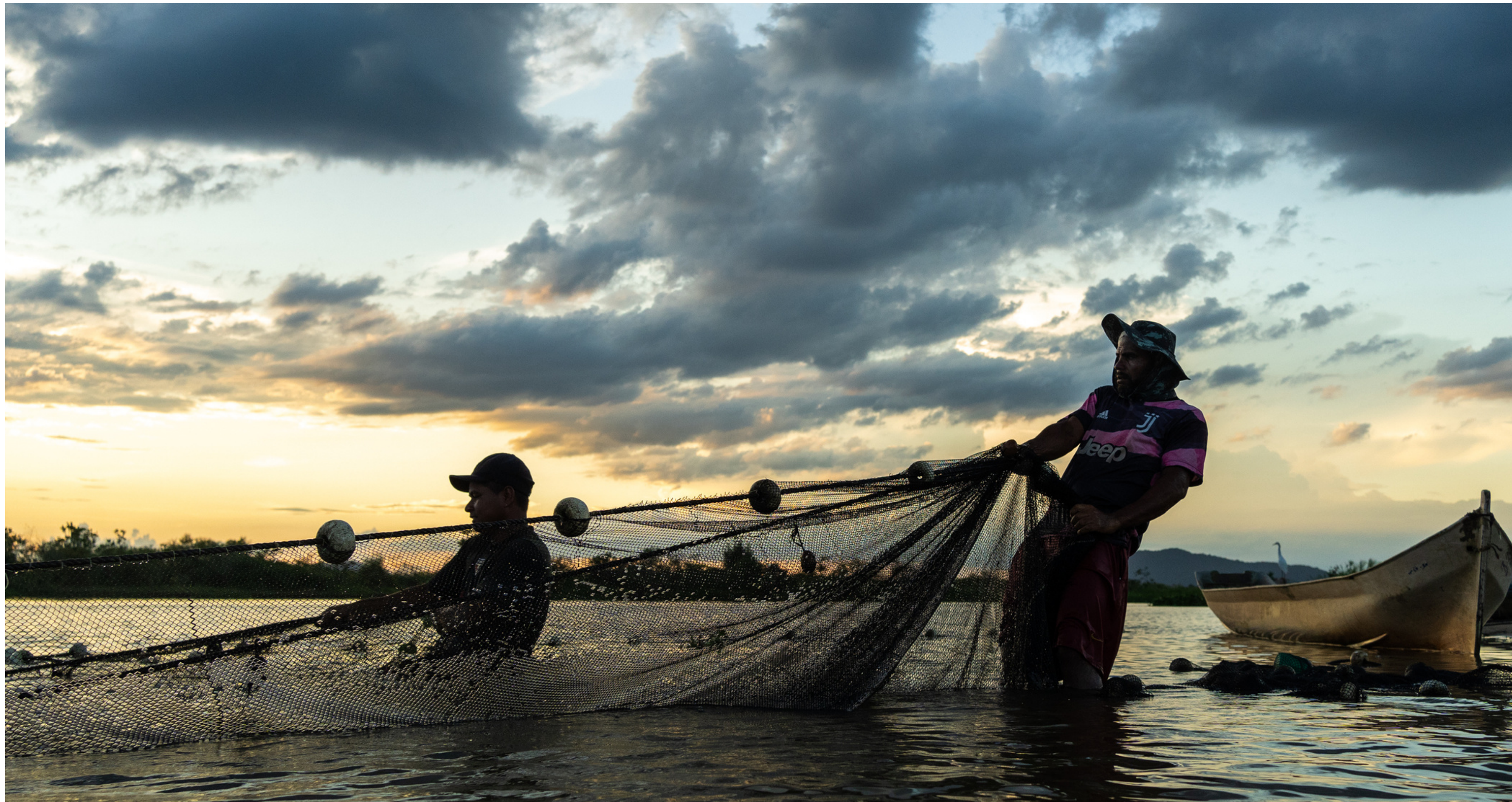
Pesca tradicional de Manjubas por caiçaras no Rio Ribeira de Iguape, Iguape, SP, Brasil, 2022.