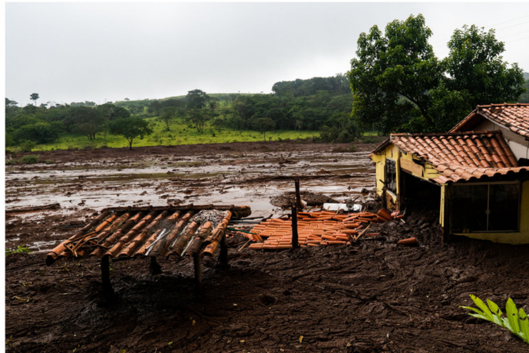
Fotógrafo registrou o cenário de destruição em Brumadinho, após rompimento de barragem

29/01/2019 05h23 · Atualizado há 10 meses