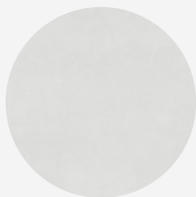
PORCELANATO BROOKLYN NEBBIA SATIN