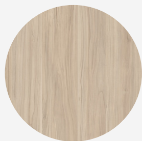
MDF COR MANZANO