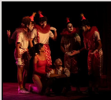
“Pantomimas e Utopias” 16 de junho de 2024