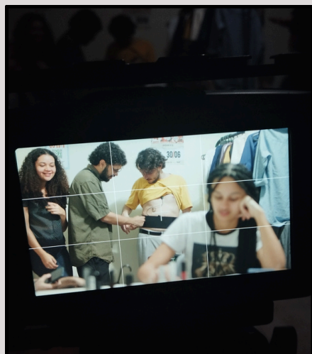
Teste de cenário de "O Ensaio"

Imagens e material comprobatório: drive.portfolio.material/o-ensaio