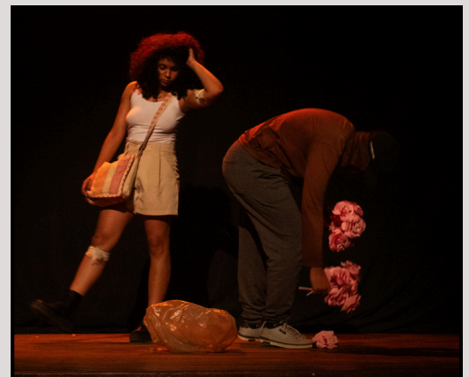
“Catacrese” 15 de setembro de 2024 (Em “Exílio II”, uma antologia teatral)