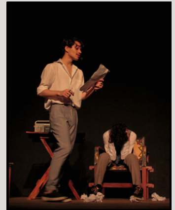
“La Plague” Dias 04 e 05 de março de 2023 (Em “Exílio”, uma antologia teatral)