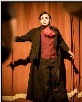
“Guia de Sobrevivência ao Halloween” 29 de outubro de 2023