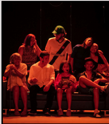
“Ceia de Casa Nova” 14 de dezembro de 2022 (minha peça de estreia)

O grupo fez a maioria das suas estreias na sua primeira sede, o Teatro Violeta Arraes, em Nova Olinda – CE, e, atualmente, também está sediado no Núcleo Cultural Unidance na cidade de Crato – CE.