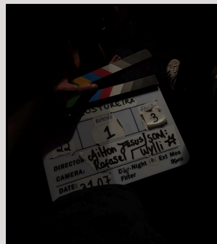
Última claquete de "A Costureira"