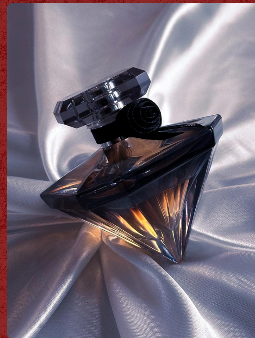
Aula prática de fotografia comercial pelo celular - Senac Americana