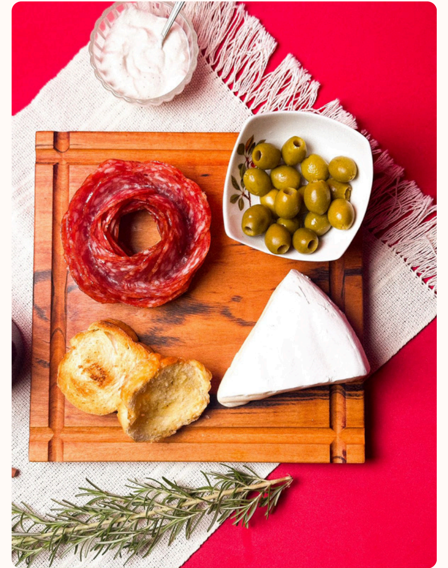
Aula prática de fotografia comercial pelo celular - Senac Americana