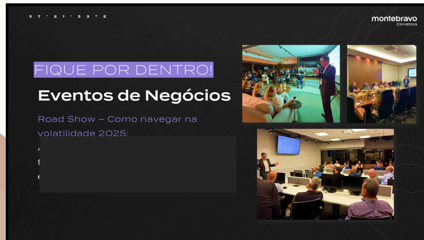
“Fique Por Dentro” - Newsletter adaptada para TV.

Criação e adaptação de conteúdos para intranet SharePoint, TV corporativa, newsletter e e-mail marketing, garantindo maior alinhamento de informações e consistência na comunicação entre áreas.