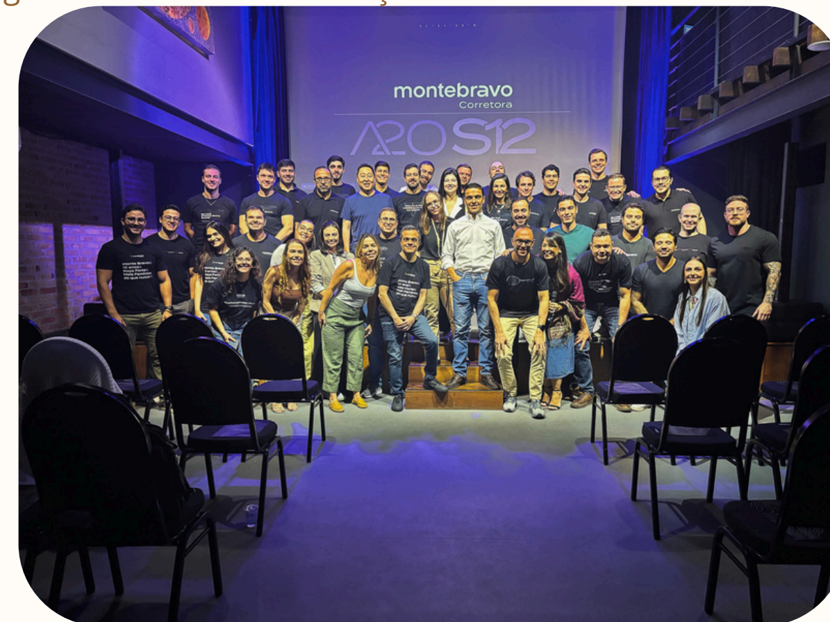
Evento de reconhecimento - destaques comerciais