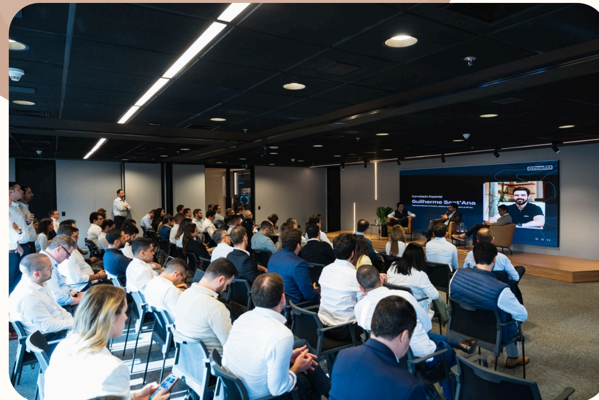
Evento estratégico - encontro de lideranças comerciais

Organização de eventos corporativos end-to-end, desde encontros de reconhecimento para times comerciais até comitês executivos com alta liderança, incluindo narrativa e apresentações, contribuindo para o engajamento dos times e fortalecimento da cultura organizacional.