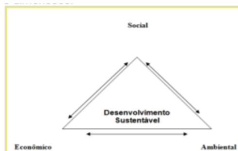
Figura 3: Dimensões de Equilíbrio de Dias (2009)

Ainda no que se refere ao “equilíbrio empreendedor”, Pereira et al (2010), ressaltam em seu artigo as “Dimensões de Equilíbrio” proposto por Dias (2009) ( apud PEREIRA et al 2010), em que o triângulo do Desenvolvimento Sustentável, apresenta as dimensões de equilíbrio nas categorias empreendedoras proposta por Savitz (2007). Podemos observar a Dimensões de Equilíbrio, na figura a seguir: