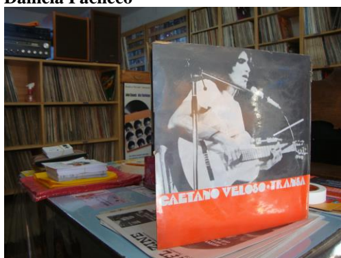
B Box do vinil Transa , de Caetano Veloso, lançado em 1972 .

Verdade. No site Sempre Vinil, o disco Tecni Color , dos Mutantes, está á venda por R$ 1800, mas ao ver detalhes sobre o produto, você percebe vários fatores que contribuem para tal: trata-se da primeira edição do produto, que tem somente 300 cópias no mundo todo, e traz em sua capa as letras das canções escritas por Sean, filho de John Lennon. Enquanto isso, o LP Love Country Style , de Ray Charles, custa R$ 30 por tratar-se de um disco de maior tiragem e sem um detalhe que aumente seu valor, como o anterior.