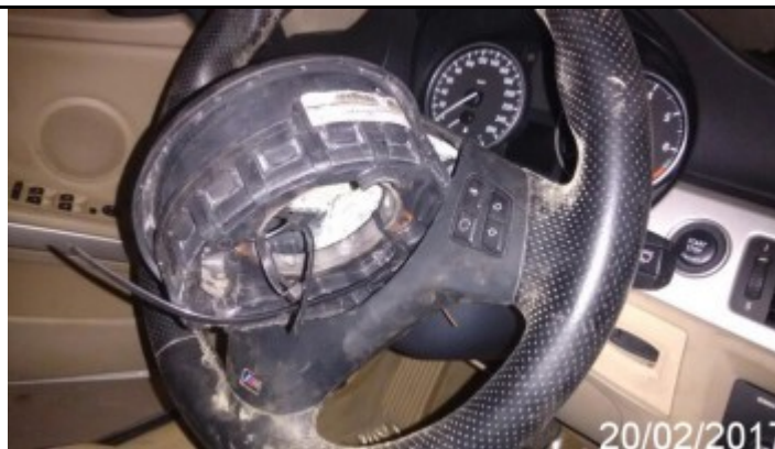
Detalhe da Avaria