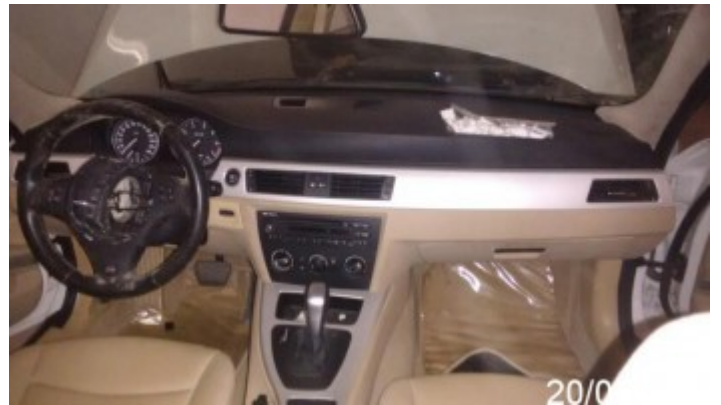
Interior do Veículo