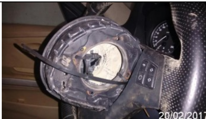
Detalhe da Avaria