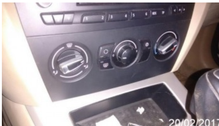
Foto Ar Condicionado