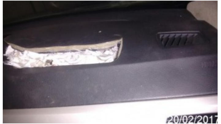
Detalhe da Avaria