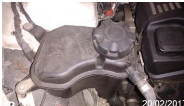
Foto Direção Assistida