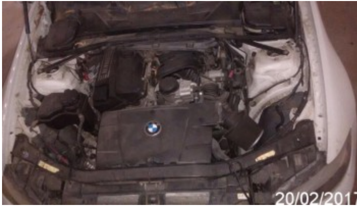
Foto do compartimento do motor