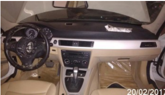
Interior do Veículo