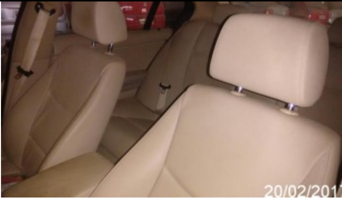
Foto Forrações em Couro