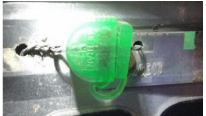
Foto do lacre da placa