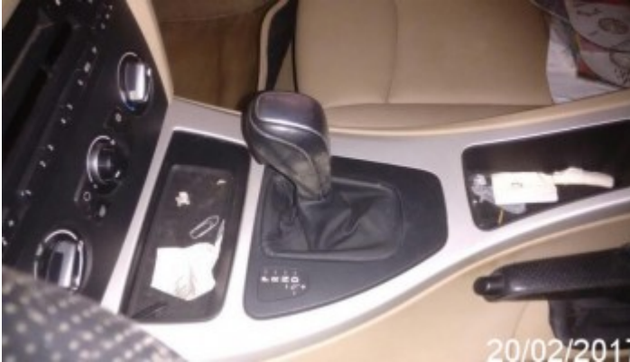
Foto Cambio Automático