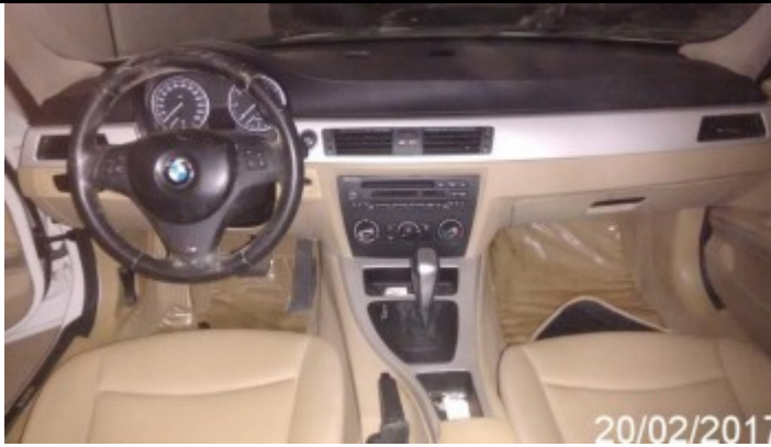
Foto do interior do veículo