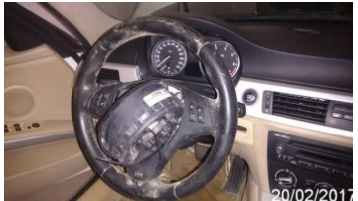
Detalhe da Avaria