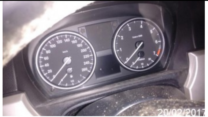
Foto do odômetro