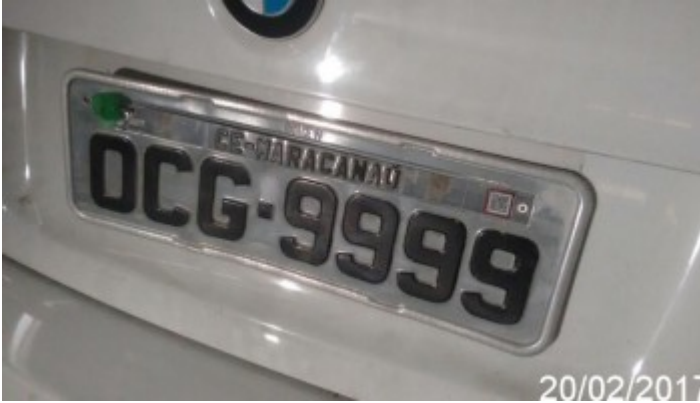
Foto da placa traseira