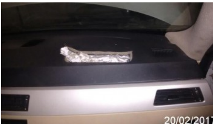
Detalhe da Avaria