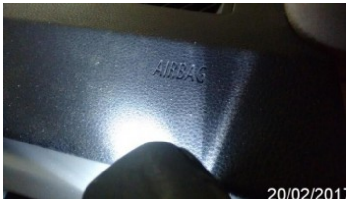
Foto Air Bag