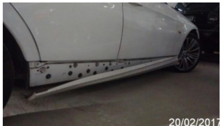
Detalhe da Avaria