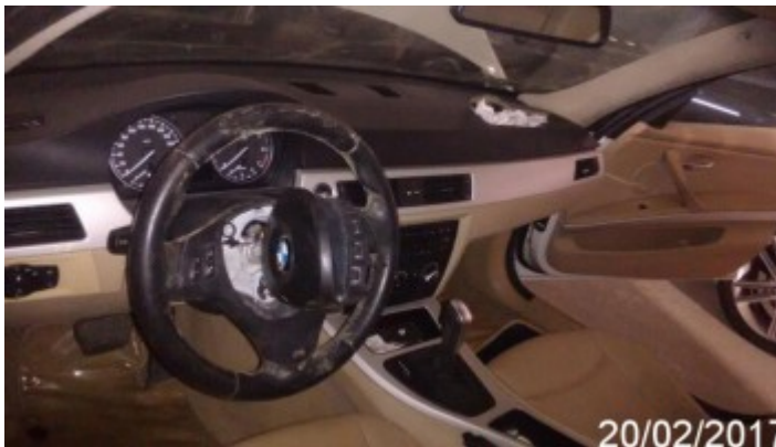
Detalhe da Avaria