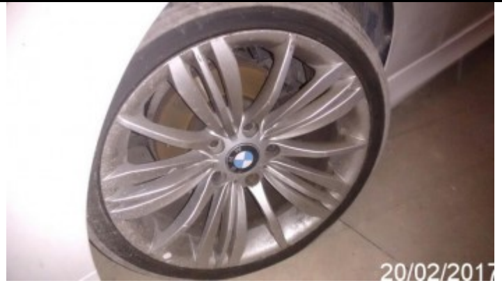
Foto Rodas de Liga Leve