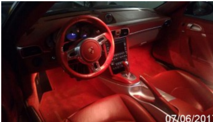
Foto do interior do veículo