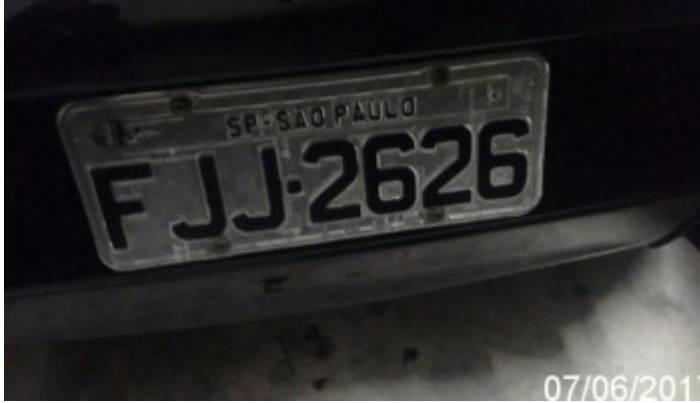
Foto da placa traseira