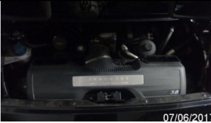
Foto do compartimento do motor