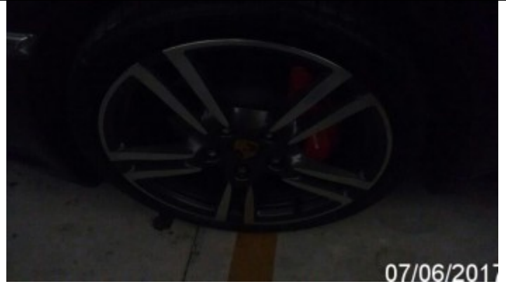
Foto Rodas de Liga Leve