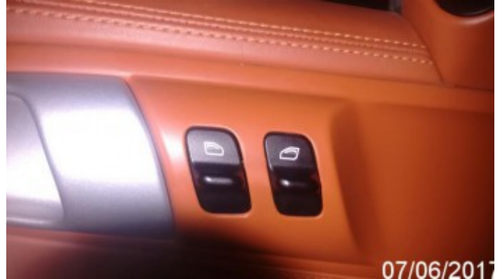
Foto Vidros Elétricos