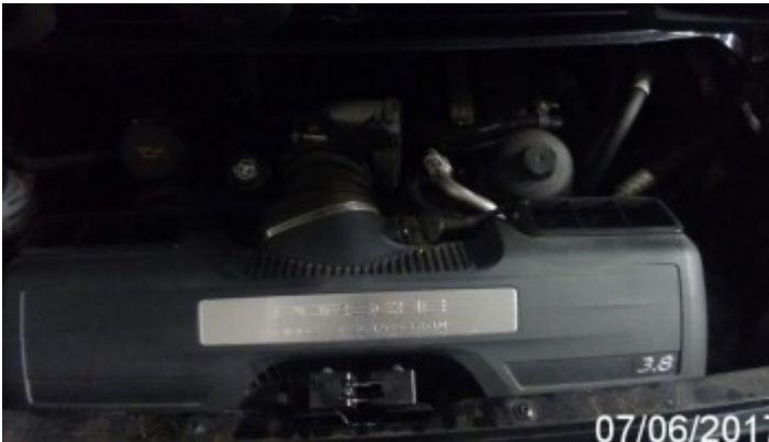
Foto Ar Condicionado