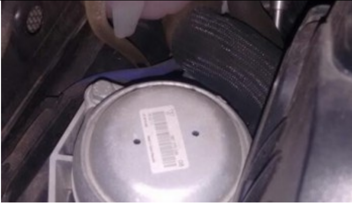
Foto Freios ABS