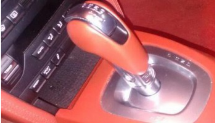
Foto Cambio Automático