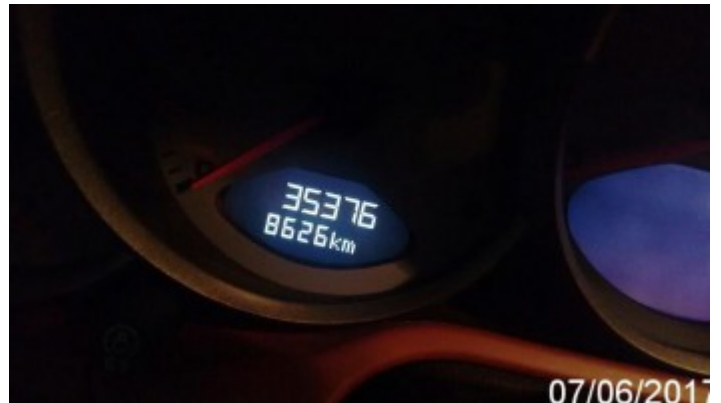
Foto do odômetro