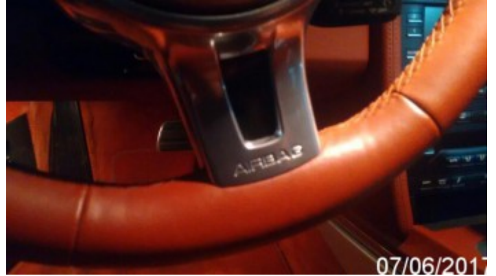
Foto Air Bag