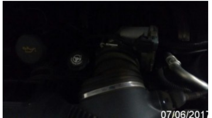
Foto Direção Assistida