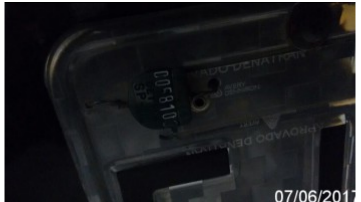
Foto do laque da placa