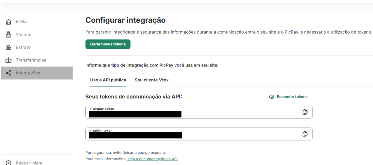
[Figura 4] - Obter credenciais PicPay