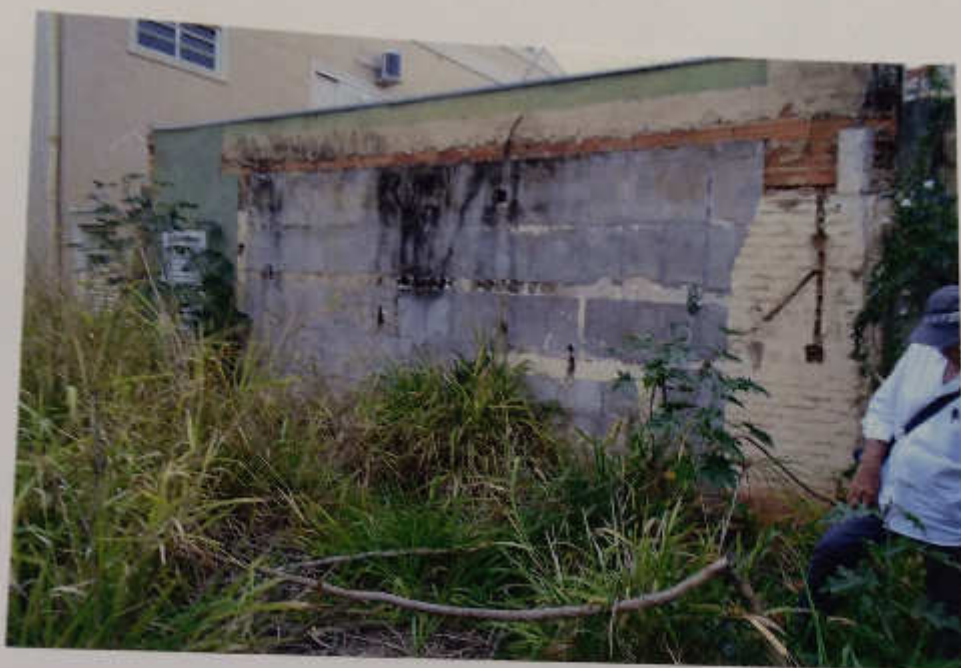
FOTO 02: MOSTRA A DIVISA DOS FUNDOS DO IMÓVEL, FECHADA COM MURO, VISTA DA ÁREA VERDE. OBSERVANDO QUE AS BENFEITORIAS QUE ALI EXISTIAM FORAM TODAS DEMOLIDAS.