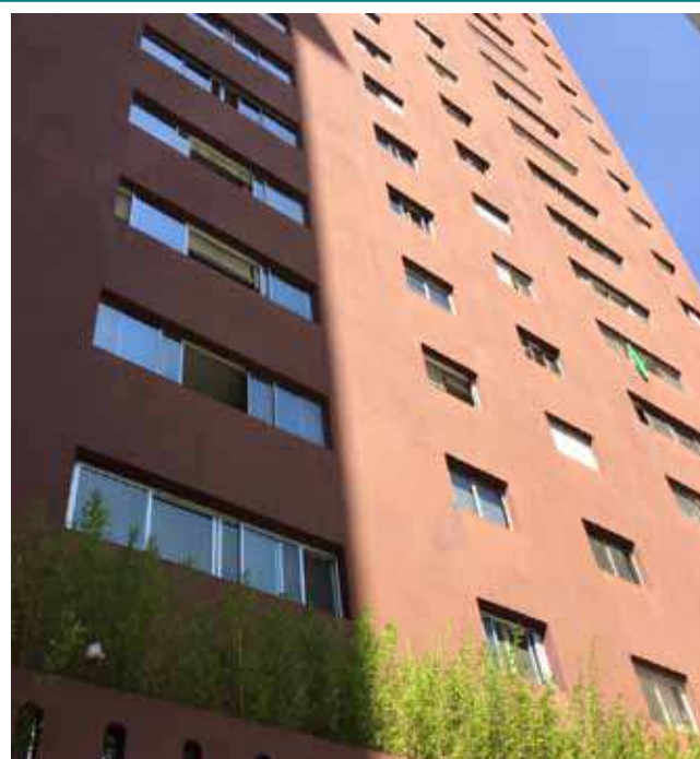
Aspecto externo do condomínio