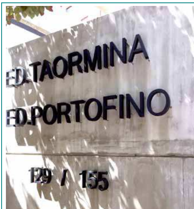
Nomenclatura do empreendimento