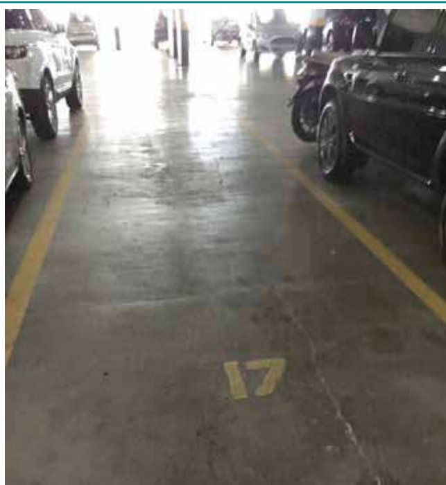
Vista da garagem