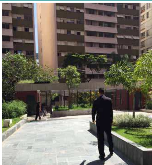
Aspecto externo do condomínio

av. sapopemba, 414 são paulo sp cep.: 03345-001 tel.: 11/2021-6418 email: eng.salvadorbueno@terra.com.br