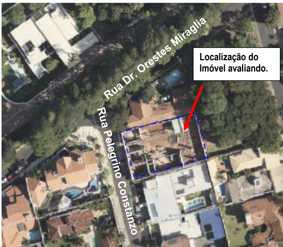
Imagem obtida na PMB – Localização do imóvel Rua Pelegrino Constanzo, s/nº – Bauru/SP.

cidade de Bauru/SP. A imagem a seguir obtida na PMB, mostra a localização do imóvel.