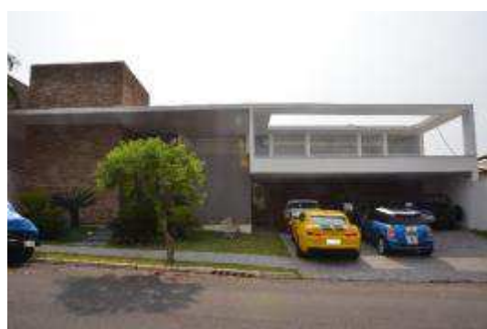
Imagem 02. Residência do réu na Rua Pelegrino Constanzo, n.º 1-45.