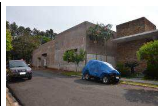
Imagem 01. Vista geral do imóvel objeto da ação localizado na Rua Pelegrino Constanzo, s/n.º

As imagens a seguir foram obtidas no dia da vistoria realizada em 26 de setembro de 2015.