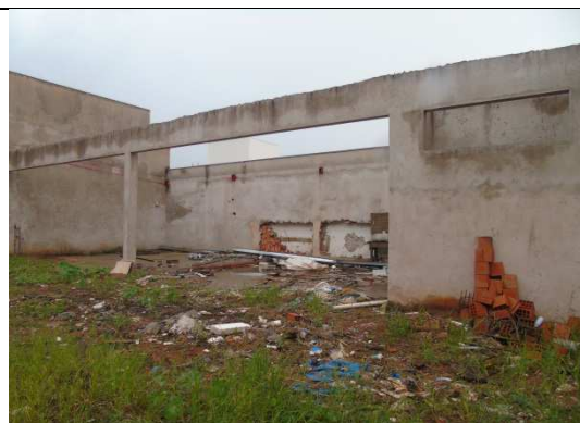
Imagem 04. Vista interna do imóvel.