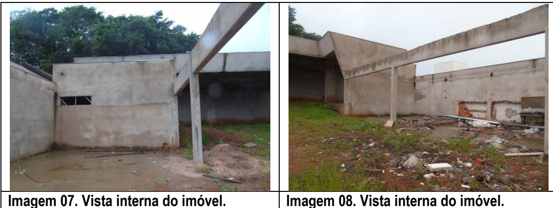
Imagem 07. Vista interna do imóvel.