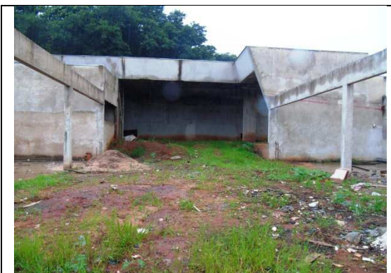
Imagem 03. Vista interna do imóvel.