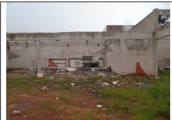
Imagem 05. Vista interna do imóvel.