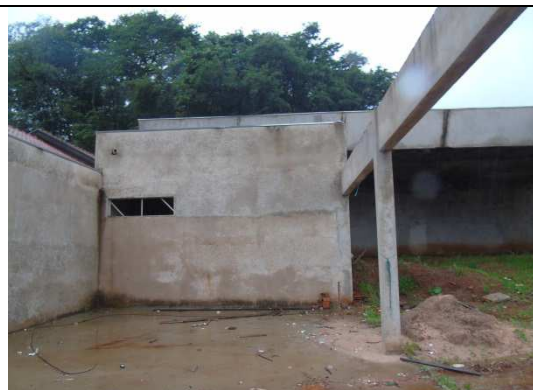
Imagem 06. Vista interna do imóvel.