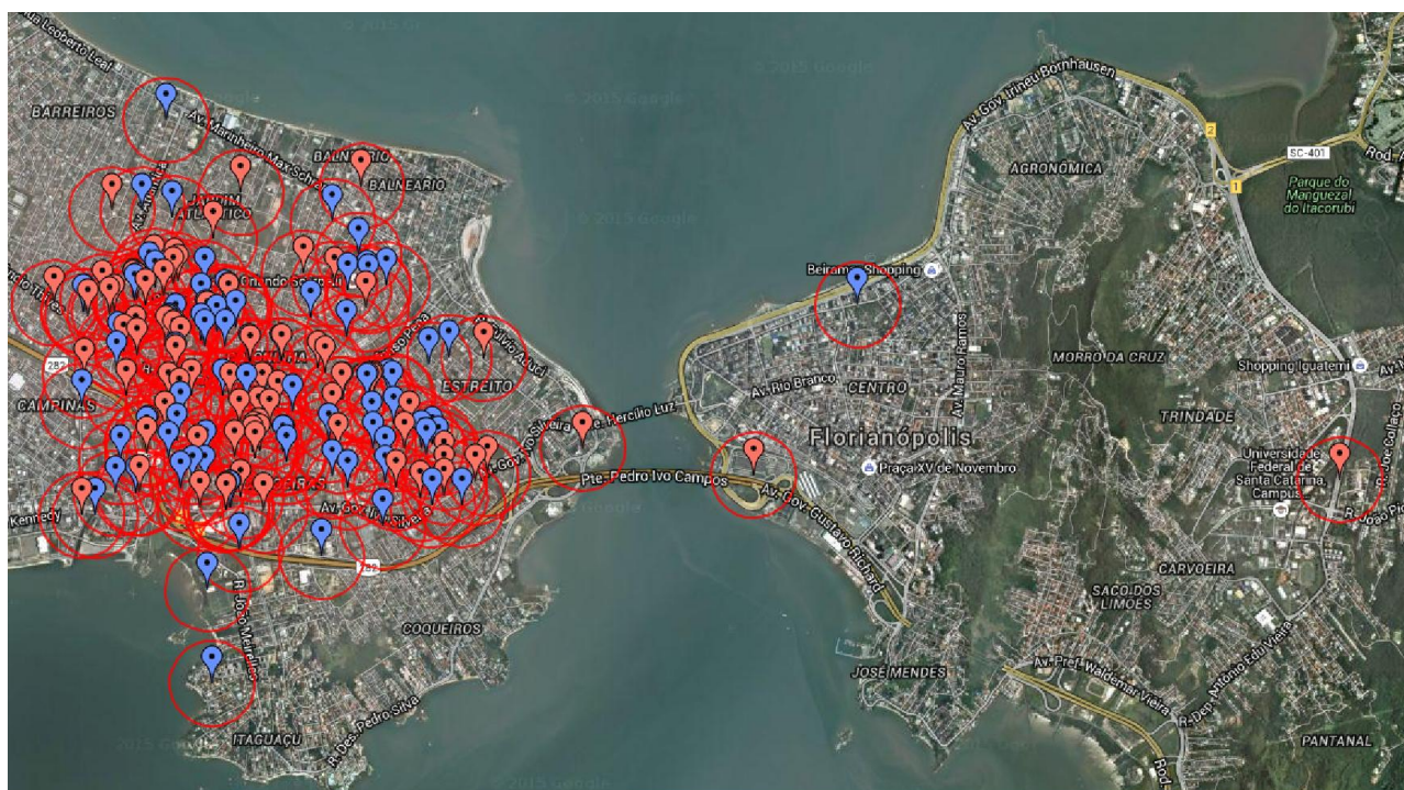
Figura 1- Áreas de foco no Continente, Centro e Leste.

A região Continental continua sendo a mais vulnerável do município, registrando, só este ano, 199 focos de Aedes, 92 dos quais estão no Bairro Capoeiras, que registrou os últimos casos autóctones de Dengue. Entretanto, praticamente todo o Distrito encontra-se em situação de infestação.