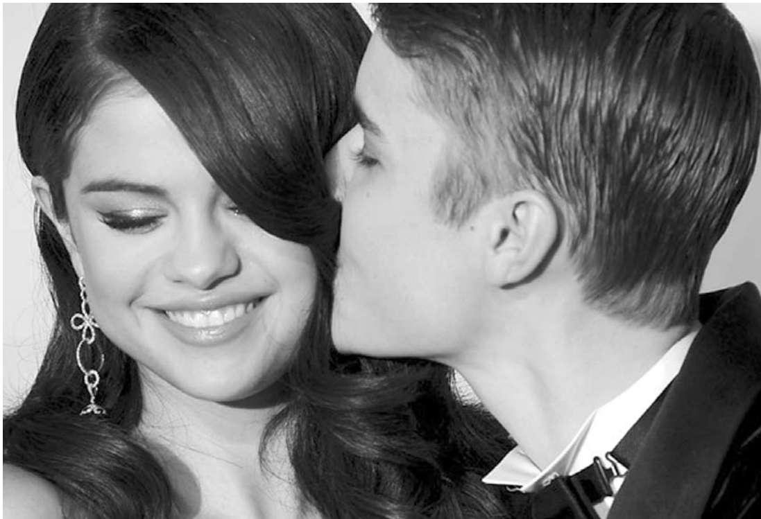
Vai e volta do casal já dura um bom tempo

Vale lembrar que há pouco menos de uma semana o cantor postou uma foto da ex (ou atual, pelo jeito) no Instagram dizendo que se trata da “princesa mais elegante do mundo”.