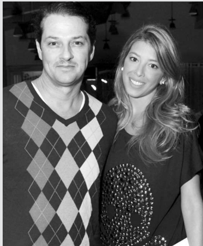
Ator se divertiu ao lado da esposa