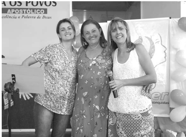
Destaque para a comemoração das Mulheres do MLP, no último sábado, festejando o Dia Internacional da Mulher