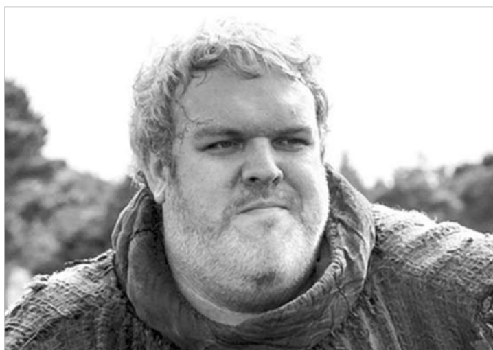
Hodor é um dos mais carismáticos da série

O irlandês também comentou questões como privacidade e respeito, mencionando seus colegas de elenco. “Fui educado para respeitar a privacidade alheia, e o direito das pessoas a ser e escolher o que quiserem, e espero, aliás, exijo o mesmo para mim”.