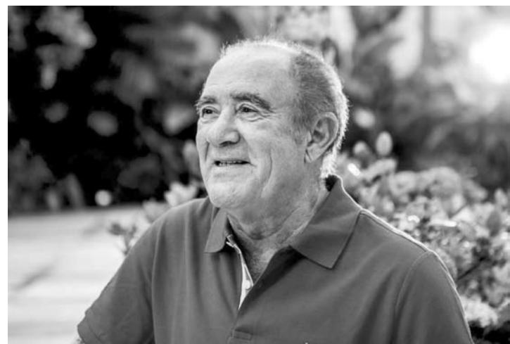
O humorista conversou com Ana Maria Braga no ‘Mais Você’ e tranquilizou os fãs sobre seu estado de saúde

por mim. Vou precisar ter três corações para receber esse carinho todo”, afirmou ele. E ratificou: “Não aconteceu nada de grave, mas poderia ter sido. Os anjos foram muito carinhosos comigo, já posso jogar futebol de novo”.