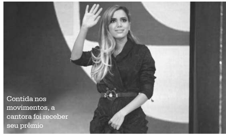
Contida nos movimentos, a cantora foi receber seu prêmio

“Ao mesmo tempo acompanhei meus fãs votando enlouquecidos pra que eu ganhasse esse prêmio hoje. Eu tinha certeza, pelo amor que sinto por eles e pela dedicação que eles têm por mim que eles estariam todos em frente a TV me esperando ansiosos pra talvez me verem recebendo o presente que eles me deram. E não podia falhar. Tudo foi feito com muita segurança.”