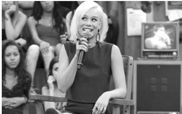
Balinha na bolsa e fica tudo certo

Já Moranguinho postou uma imagem de fé e recebeu o apoio de muitos internautas, que enviaram palavras de apoio nos comentários da foto.