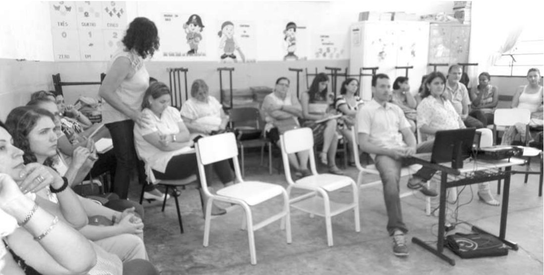
Docentes das escolas municipais participaram do planejamento escolar para programar as ações neste ano letivo