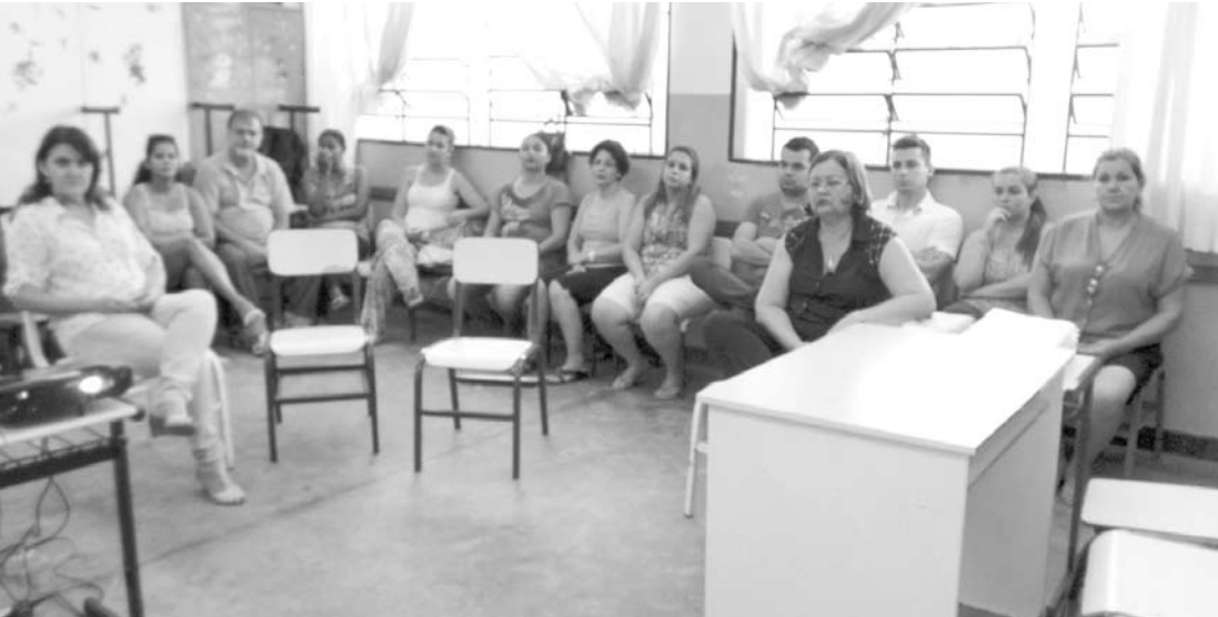
Os encontros são uma tarefa docente que incluiu a previsão das atividades em termos de organização e coordenação em face aos objetivos propostos

→ Da REDAÇÃO contato@oextra.net A Secretaria de Educação do município de Ouroroste realizou nos últimos dias 5, 6 e 7, em toda a rede municipal de ensino, o planejamento escolar 2014. A iniciativa teve as seguintes funções: expli-