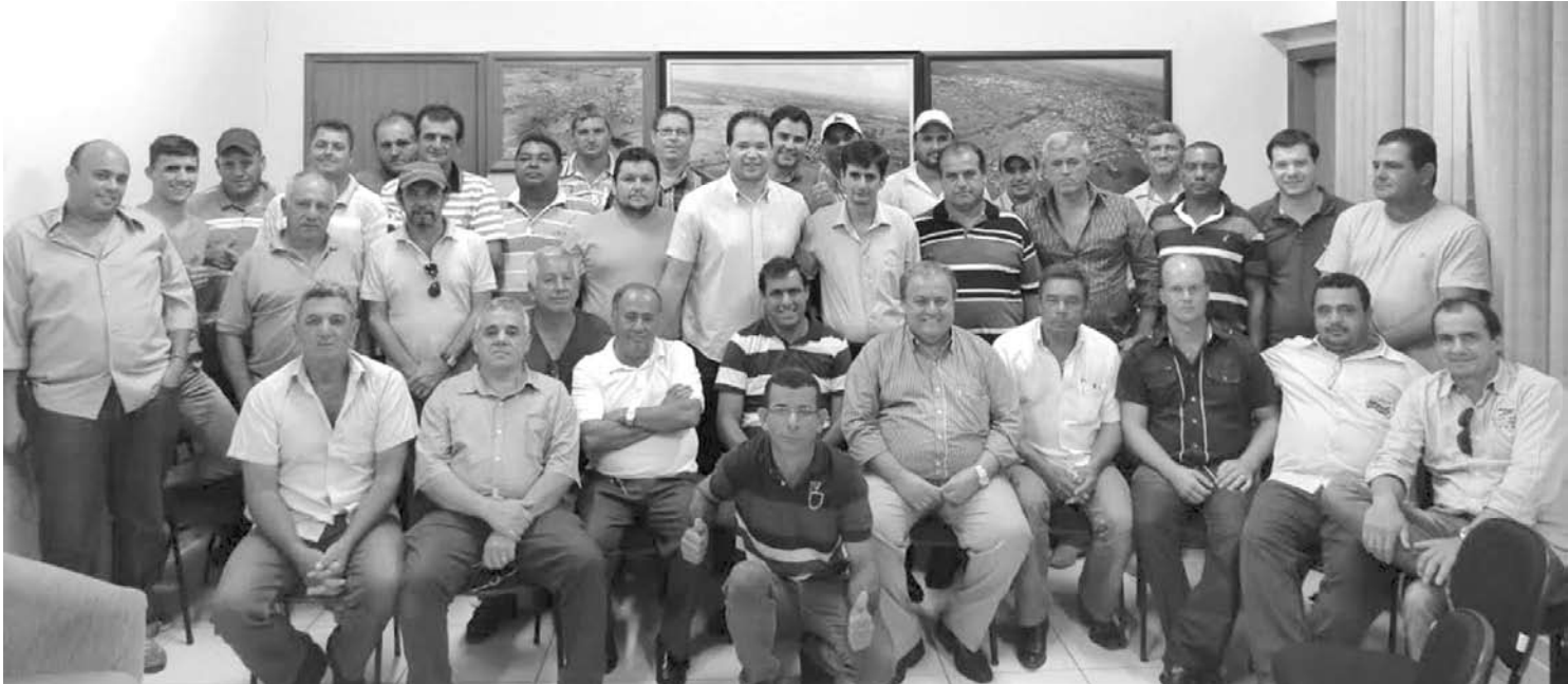
Integrantes da Comissão Organizadora da 29ª Festa do Peão de Valentim Gentil

Valentim Gentil será realizada de 30 de abril a 3 de maio, no Recinto de Exposições do município, localizado às margens do Ramal de Acesso “Antonio Pimentel”, na entrada da ci-