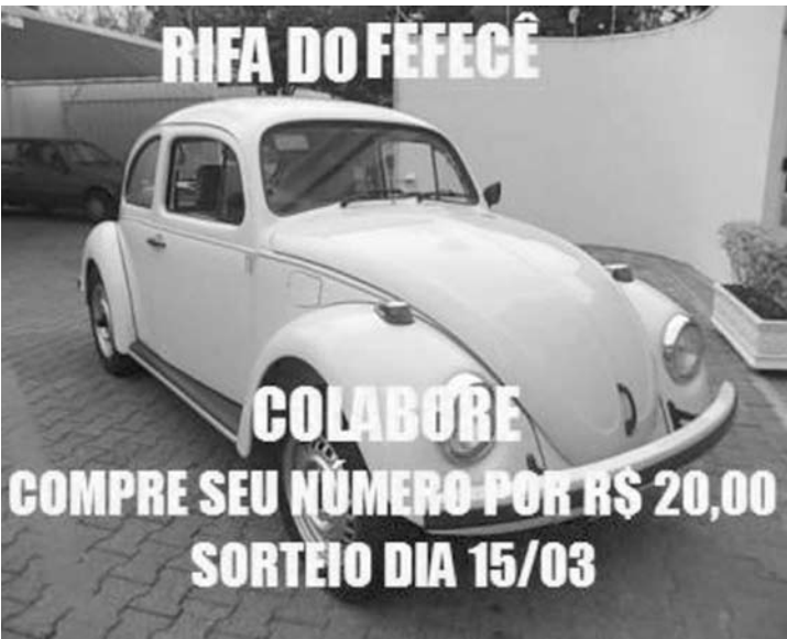
Campanha visa fortalecer o caixa da Águia