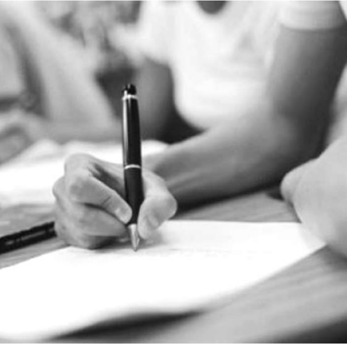
O MEC estima que 52% das redações do Enem 2013 passaram por um terceiro corretor

por uma banca com três professores, que dá a nota final. O MEC estima que 52% das redações do Enem 2013 passaram por um terceiro corretor. Para dar conta desse volume, o número de avaliadores contratados subiu de 5,6 mil em 2012 para 9,5 mil este ano. Desde o Enem de 2012, o estudante pode ter acesso ao texto corrigido para fins pedagógicos, ver como foi a correção por competência. No entanto, o candidato não pode questionar a correção e pedir a revisão da nota, de acordo com o edital do exame. A nota do Enem pode ser usada para a participação em programas como o Sistema de Seleção