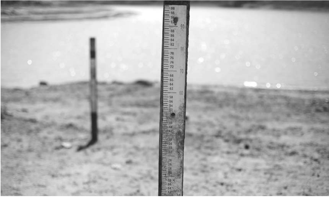
A falta de chuva já é sentida pelos agricultores, que este ano tiveram menor produção no primeiro trimestre

O engenheiro do EDA explica que a agricultura na região de Fernandópolis ficou prejudicada com a falta de chuva esse ano, em especial o milho e a soja, pois faltou água para as plantações quando as sementes estavam germinando e essa perda não se recupera mais esse ano. Os seringais também foram prejudicados com menor produção de látex e a pastagem também sofreu com a falta de água, o que vai refletir no aumen-