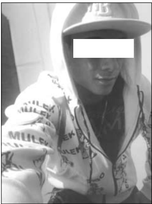
Imagens que o soldador deixou públicas no seu perfil da rede social

e graves erros, mas você vai se f... bonito na cadeia, boa sorte”, se espalharam pelo Face dele ontem.