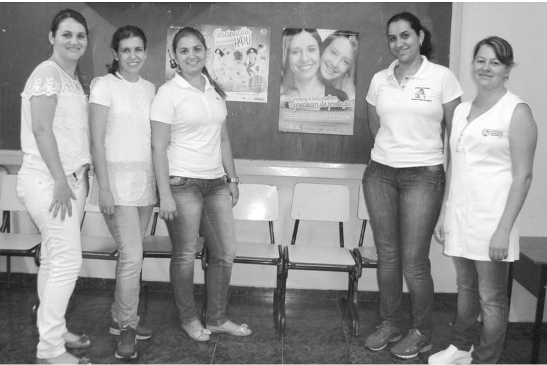
As equipes de saúde estarão vacinando nas escolas e Unidades de Saúde de Ouroeste e Arabá