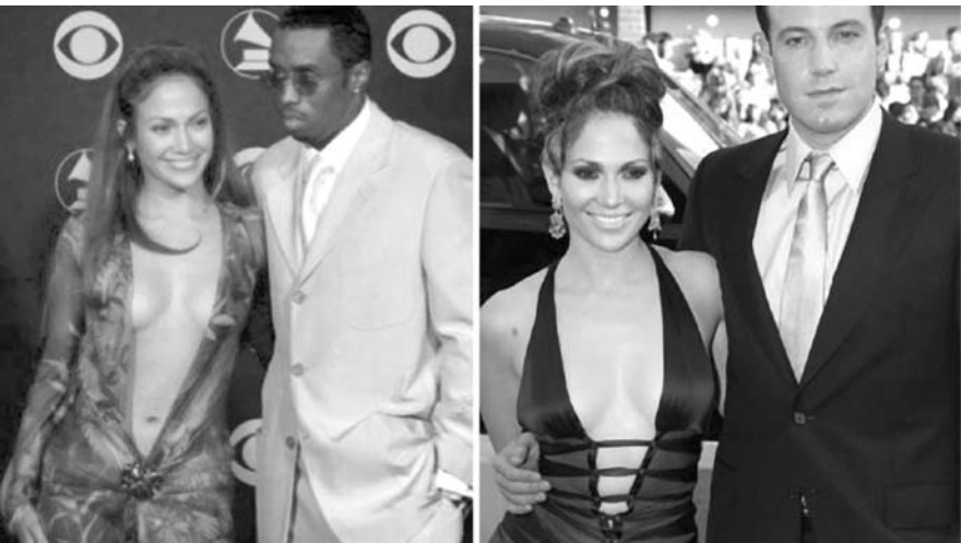
Muda o bofe, mas o decote continua lá

Ninguém sabe com certeza sobre o atual estado civil de Jennifer Lopez, mas é bom Casper Smart ficar esperto. Durante uma participação em um programa de rádio em Los Angeles, a cantora deixou claro que passado é passado, mas que nem sempre lembrado com carinho. Questionada sobre o que faria caso visse seu ex-noivo magya Ben Affleck e o rapper Sean Combs (que já foi conhecido como Puff Daddy, P.Diddy, Puff, etc) se afogando, J.Lo hesitou, mas soltou o verbo: “Eu deixaria aqueles dois filhos da p*** se afogarem.” Depois de chocar meio mundo com a declaração, a diva latina se explicou. “Isto é terrível. Estou apenas brincando. Bem, Puffy vocês sabem que eu amo vocês.”