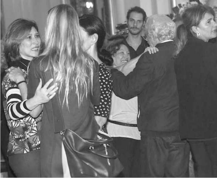
Emoção e recordações no velório de Paulo Goulart; filha se declarou ao pai

Poucos meses depois de anunciar seu divórcio de Roberto Justus, Ticiane Pinheiro precisou engolir o orgulho quando viu o ex-marido assumir um namoro com a loira, jovem e modelo Ana Paula Siebert. Seis meses depois, a apresentadora confirmou que o coração está ocupado novamente. O sortudo não é nenhum empresário paulistano, como sugerem os últimos casinhos da loira. Quem conseguiu fisgar o coração de Tici foi o jornalista global César Tralli. Os boatos sobre o relacionamento surgiram nesta quinta-feira, dia 13, foi confirmado por sua assessoria de imprensa. “Estamos namorando e muito felizes”, declarou.