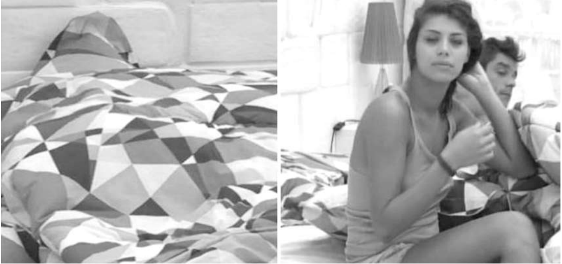
Os dois fizeram da Sibéria o lugar mais quente da casa

do riscos. A mulherada está terrível lá na casa e eu estou quase entrando lá para bater em algumas”, brincou.