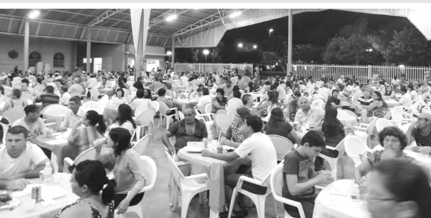
Público lotou o Salão Paroquial no evento promovido pela Casa da Amizade