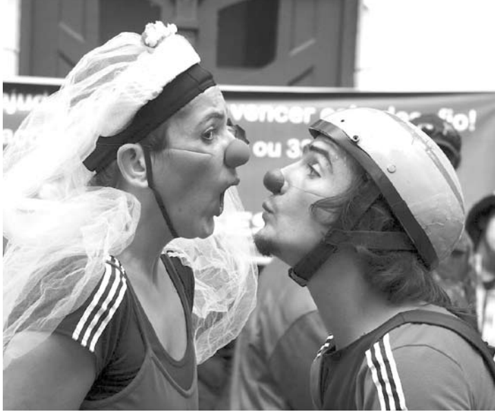
O espetáculo conta a verdadeira história de amor entre Camomila e Quindim

SOBRE O CIRCUITO CULTURAL O Circuito Cultural Paulista é um programa desenvolvido pela Secretaria Estadual da Cultura que leva apresentações de teatro,