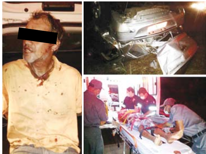
F.F. ao ser detido após o acidente; carro ficou totalmente destruído

local e constaram que se tratava dos bandidos que haviam roubado e ferido o taxista, socorrido minutos antes. Os envolvidos foram conduzidos ao Pronto Socorro da Santa Casa e depois encaminhados ao Plantão Policial. F.F. foi levado à Cadeia Pública de Guarani d'Oeste, já os adolescentes foram apresentados na Vara da Infância e Juventude na tarde de ontem. Com eles, no carro, que ficou totalmente destruído, foram encontrados cerca de R$ 2.500 pertencentes ao taxista, que também foi atendido pelos médicos e liberado horas mais tarde para prestar depoimento.