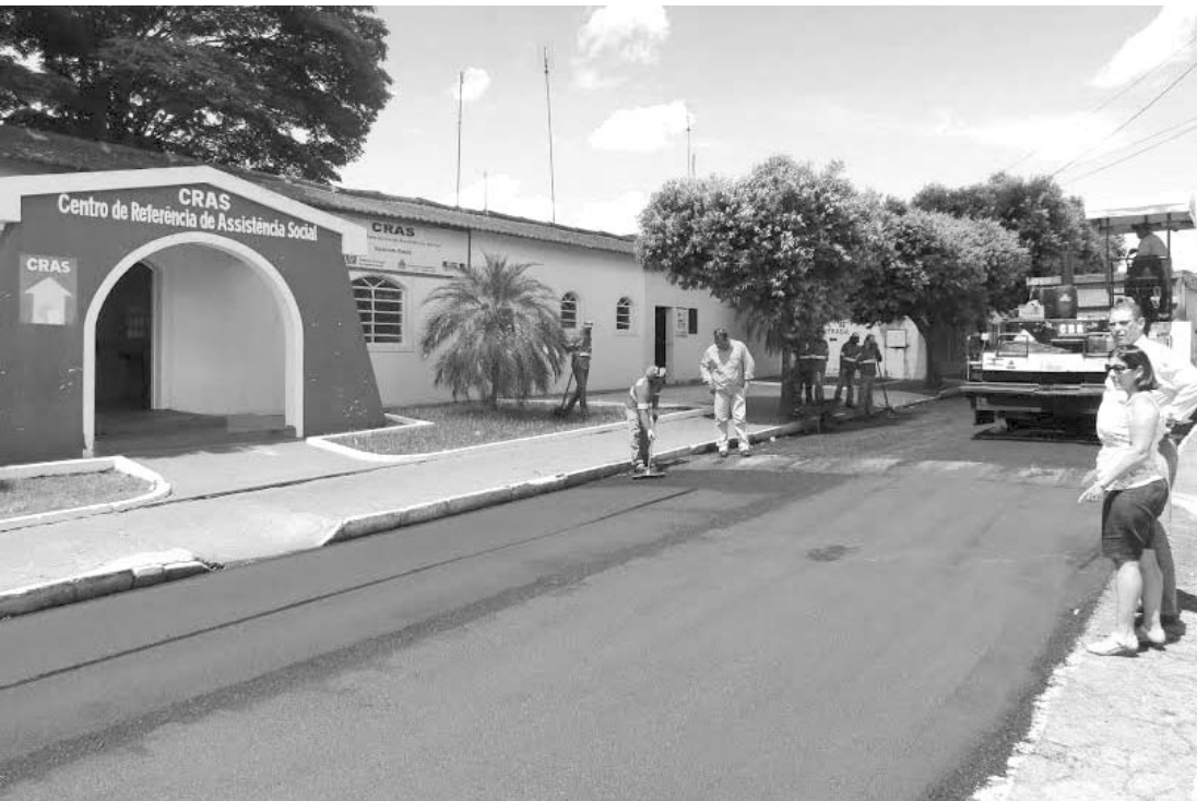
Prefeita Rosa Caldeira acompanha a execução do recape na Avenida Cavalin

Serão recapeados 6.333,39 m 2 das referidas vias; investimento nas obras é de R$ 150 mil, com recursos conquistados pela prefeita Rosa Caldeira