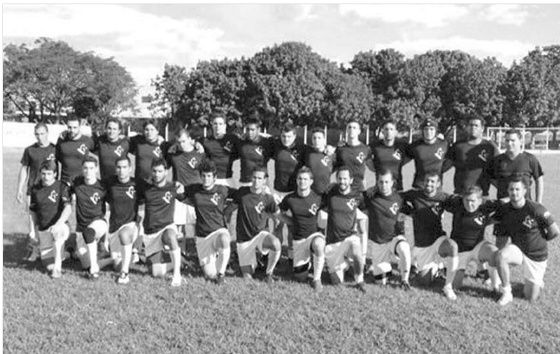
“Cavalos Rugby” há mais de quatro anos representando Fernandópolis em competições

→ JOÃO LEONEL joaoleonel@oextra.net Hoje, às 22h, no Estádio Joia da Princesa, em Feira de Santana, na Bahia, o Corinthians estreia pela Copa do Brasil 2014. O adversário será o Bahia de Feira de Santana, e o Timão vai em busca de uma vitória convincente para superar o iminente retorno da crise que se abateu sobre o clube no fim do ano passado, se agravou no início de 2014 e dava mostras que seria superada ainda neste primeiro semestre. Após o fatídico episódio da “invasão” do CT Joaquim Grava - que acabou em pizza - e as saídas de vários jogadores, seguindo um “planejamento” de reformulação do elenco alvinegro, mesmo contra a vontade da maioria da diretoria e da comissão técnica, a precoce eliminação no Paulistão acendeu novamente os sinais de alerta no Parque São Jorge. Vencendo hoje por pelo menos 2 gols de vantagem, elimi-