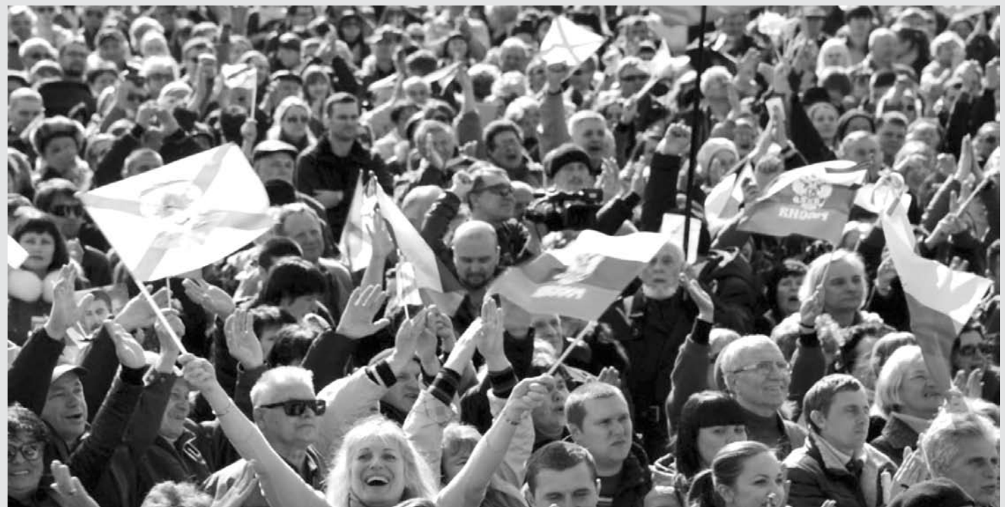
Multidão acompanha a transmissão de pronunciamento do presidente russo , Vladimir Putin, em Sebastopol, na Crimeia. Putin e líderes da Crimeia assinaram nesta terça-feira, dia 18, um tratado por meio do qual a república da Crimeia é anexada à Rússia. A decisão levou o Reino Unido a suspender a exportação de armas para a Rússia.